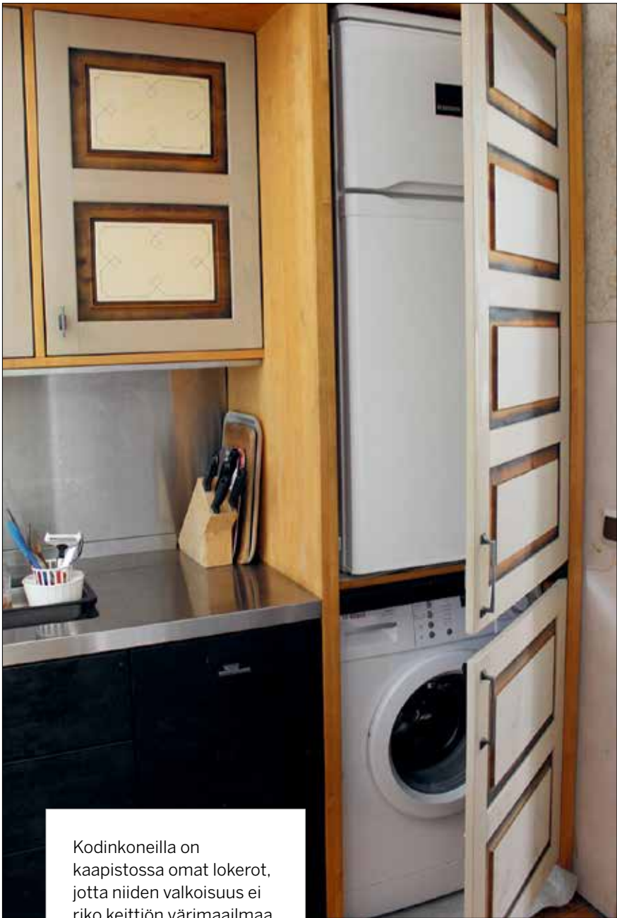
Kodinkoneilla on kaapistossa omat lokerot, jotta niiden valkoisuus ei riko keittiön värimaailmaa.

toja voi siirtää seuraavaa keittiöremonttia eteenpäin ja vahvistaa kodin kriisinkestävyyttä.