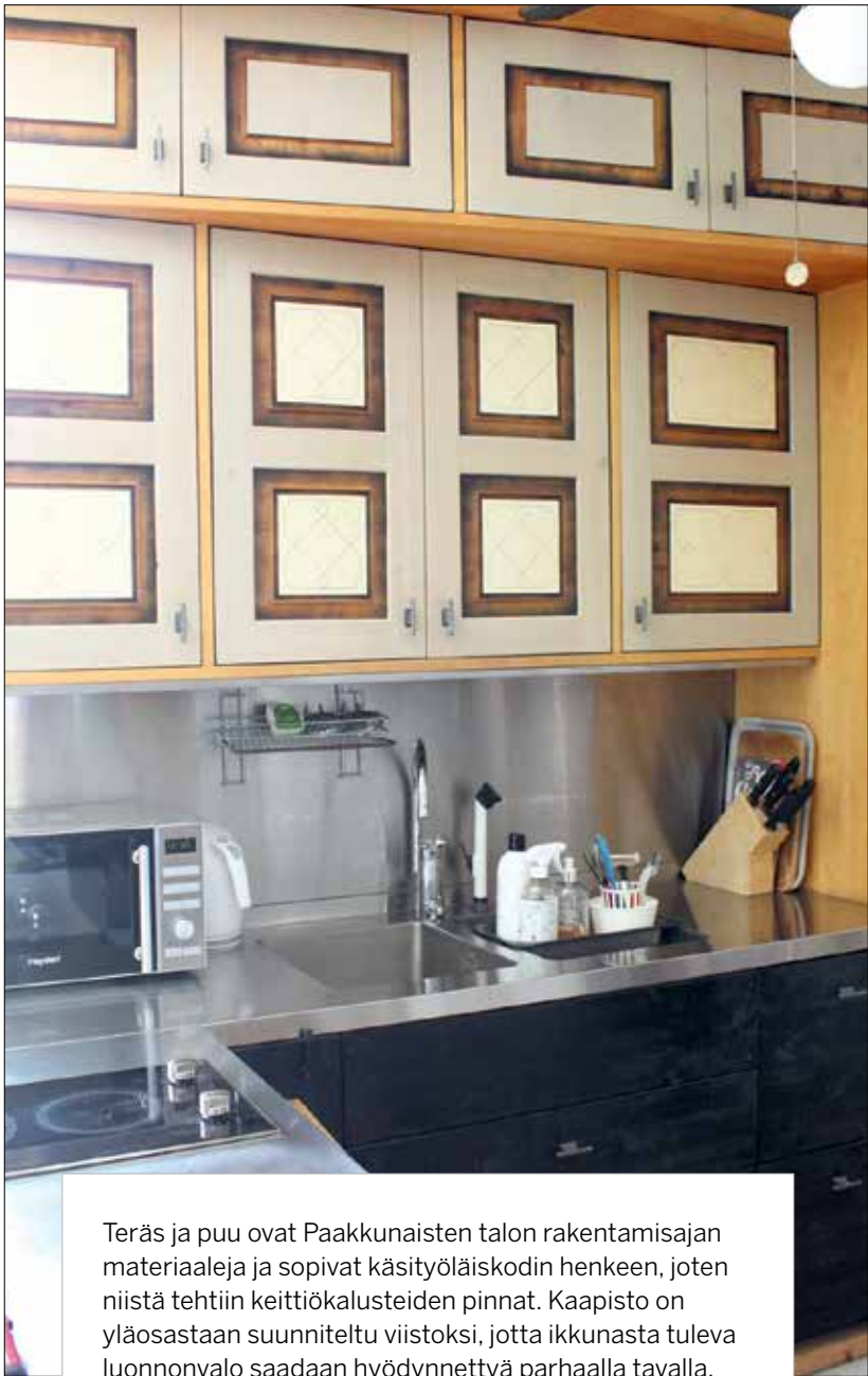
Teräs ja puu ovat Paakkunaisten talon rakentamisajan materiaaleja ja sopivat käsityöläiskodin henkeen, joten niistä tehtiin keittiökalusteiden pinnat. Kaapisto on yläosastaan suunniteltu viistoksi, jotta ikkunasta tuleva luonnonvalo saadaan hyödynnettyä parhaalla tavalla.