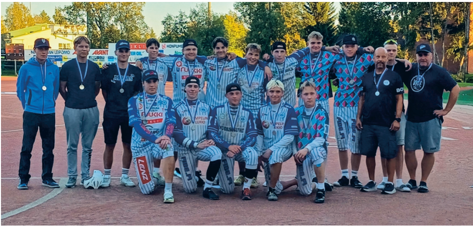
Vimpelin Vedon poikien Ykköspesis-joukkueen kausi päättyi Saarikentällä hopeajuhliin.

Lähetä päiväyriaineisto lehteen sähköpostitse: toimitus@torstai-lehti.fi