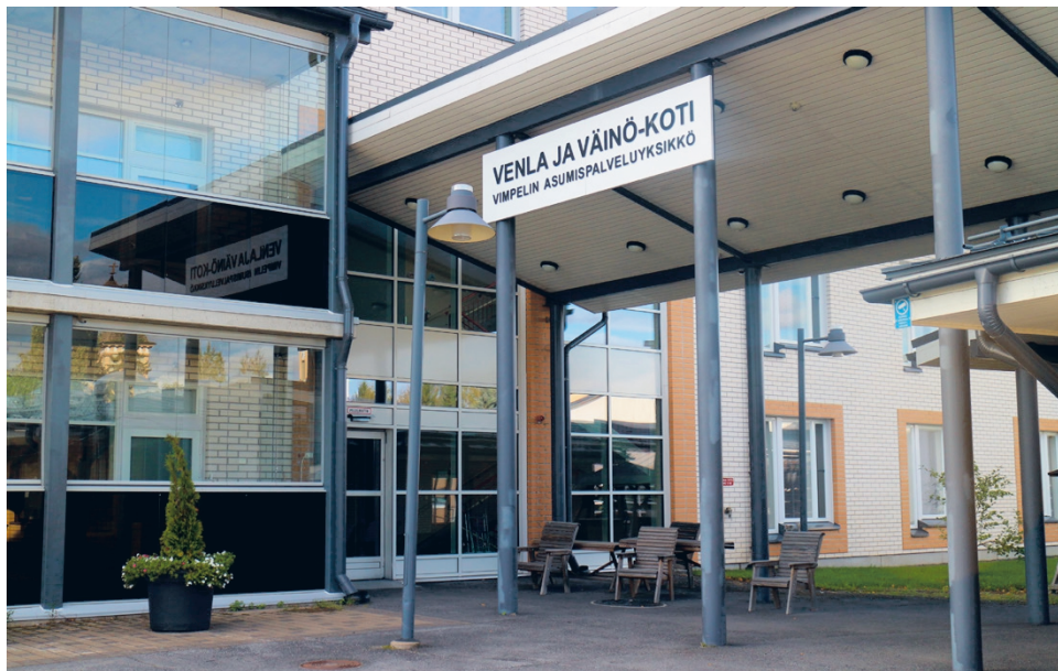
Etelä-Pohjanmaan aluevaltuusto kävi laajan keskustelun ja hyväksyi viime viikolla pidetyssä kokouksessaan ikäihmisten palveluiden kehittämissuunnitelman. Se kattaa vuodet 2024–2035. Puheenvuoroissa käsiteltiin muiden muassa ikäihmisten hoivapalveluita. Kuva Vimpelissä toimivasta Venla ja Väinö -kodista, joka on ympärivuorokautinen palveluasumisyksikkö.

– Pyrimme vahvaan hyvinvointia ja terveyttä edistävään yhteistyöhön kuntien ja järjestöjen kanssa. Kotiin annettavissa palveluissa merkittävää on kuntouttava toimintatapa. Panostamme myös yhteisölli-