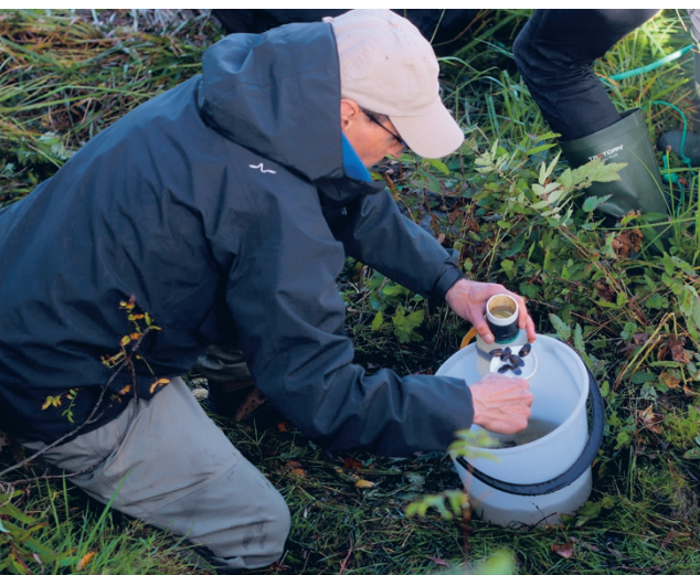
Ähtävänjokeen on tänään istutettu vuonna 2019 syntyneitä pikkuraakkuja, jotka ovat kooltaan 3–4 senttimetriä. Etelä-Pohjanmaan ely-keskus tekee Jyväskylän yliopiston kanssa yhteistyötä raakkujen viljelemiseksi Ähtävänjoessa.

Hyviä esimerkkejä tästä työstä ovat vuonna 2021 käynnistynyt LIFE Revives -hanke ja vuonna 2022 päättynyt Freshabit LIFE IP -hanke. Näiden hankkeiden tavoitteena on muun