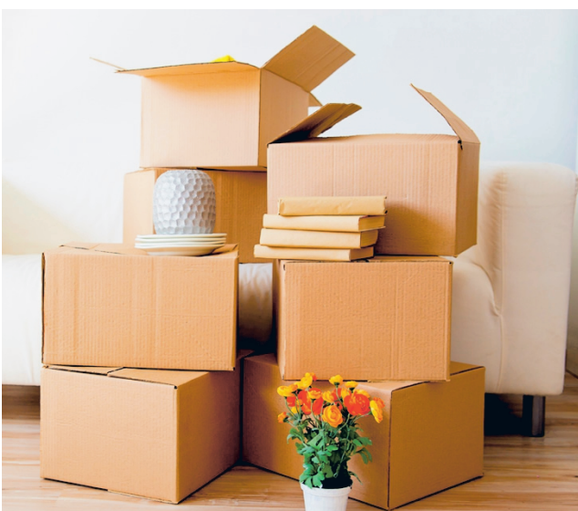
Etelä-Pohjanmaan maakunnan väkiluku on laskenut vuodesta 2013 saakka muuttoliikkeen ja vähenevän syntyvyyden vuoksi. Kuvituskuva.

Vuoden 2024 heinäkuuhun asti ulottuvien väestön ennakkotietojen perusteella Etelä-Pohjanmaan maakunnan väestötappio – 85 henkilöä – oli huomattavasti ennakoitua pienempi. Luonnollinen väestökehitys on pysynyt edellisten vuosien tasolla. Maahanmuutto on pysynyt lähellä viime vuoden tasoa, ollen 515 henkilöä. Suurin yksittäinen muutos tapahtui kuntien välisessä muuttoliik-