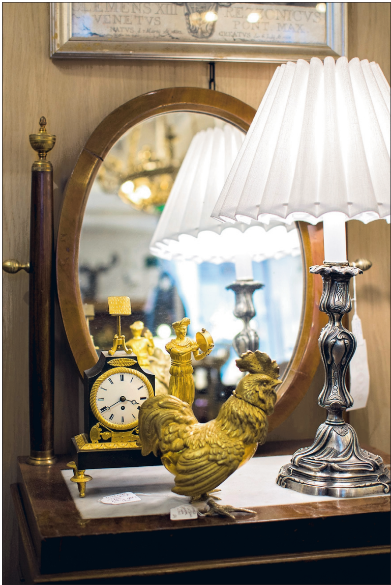
Sisustamisen katseenvangitsijoiden ei aina tarvitse olla mittasuhteiltaan suuria.

Teimme koronan jälkeisen kävijäennätyksen”, Muuri iloitsee.