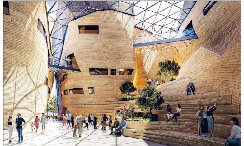
Kivi Tähti -niminen kilpailutyö muistuttaa ulkopuolelta kiviä ja tähteä.

Hankkeen tavoiteaikataulun mukaan Arkkitehtuurimuseon ja