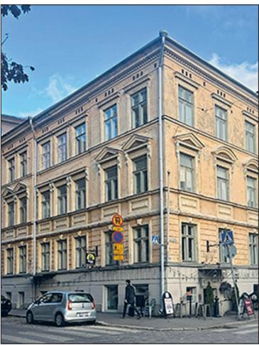
Badger sijaitsee vuonna 1861 valmistuneessa kivitalossa.

joiltavalla pääruoalla. Kermanen lohikeitto, jota on ryyditetty Kekkosen tapaan Koskenlaskijalla, on täydellinen maanantairuoka. Viime perjantaina söin Simon leikkeen eli oscarinleikkeen inspiroiman leivitetyn possupihvin, jota oli höystetty katkaravuilla kera caesar-kastikkeeseen. Schnitzelin kanssa maistui luonnollisesti la-sillinen lahtelaista Oktoberfest-olutta.