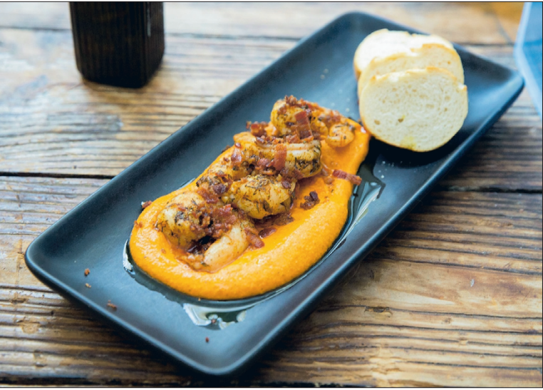
Baarissa pitää olla juoman lisäksi myös hyvää syötävää. Badgerin baariuokalistalta voi tilata vaikka cajunmaustetut katkaravut Romescon kera.

Lindroth esittelee uutuutena cajunmaustetut mehevät katkaravut, joita kirittää reilusti maukas romesco ja rapea pekoni. Kasvisversiossa on paahdettua mskikurpitsaa ja pinjansiemeniä, johon Katalonian aurinko eli paahdetusta tomaatista ja paprikasta sekä manteleista tehty Romesco tuo hyvän makunsa.