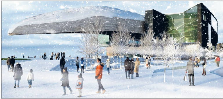
Ehdotus nro 13, Leijua, kirjaimellisesti leijuu ilmassa.