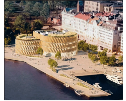
Kilpailuehdotus nro 1, MetsäKaiku.

Makasiinirannan laajemmassa suunnitelmassa johtoajatuksena on, että museon ja Vanhan kauphallin väliin muodostuu kaupunkitori eli aukio, jossa voi olla erilaista tapahtumallisuutta.