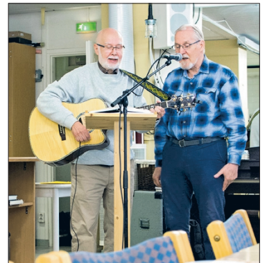
Lounasta syötiin elävän musiikin siivittämänä.

VIADIA Helsinki ry. on 10-vuotias diakoniyhdistys, joka toimii Helsingin vapaaseurakunnan yhteydessä. Sen toimintamuotoja ovat Soppakirkko ja ”Levähdyspaikka”, liikkuva kahvinjakelupiste. Kansallinen ViaDia-yhdistys