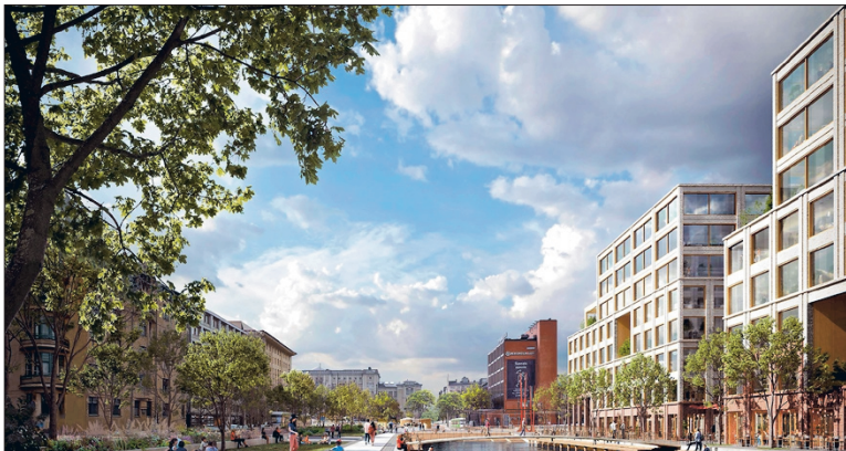
Hietalahdenrannan vanhat talot näyttävät pieniltä toimistokolossin rinnalla.