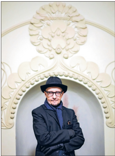
Luotsikatu 1:n sisäänkäynnissä on näyttävää ornamentiikkaa.

HURJALLA nimellä nimetty kier- ros keskittyy lähinnä Katajanokan