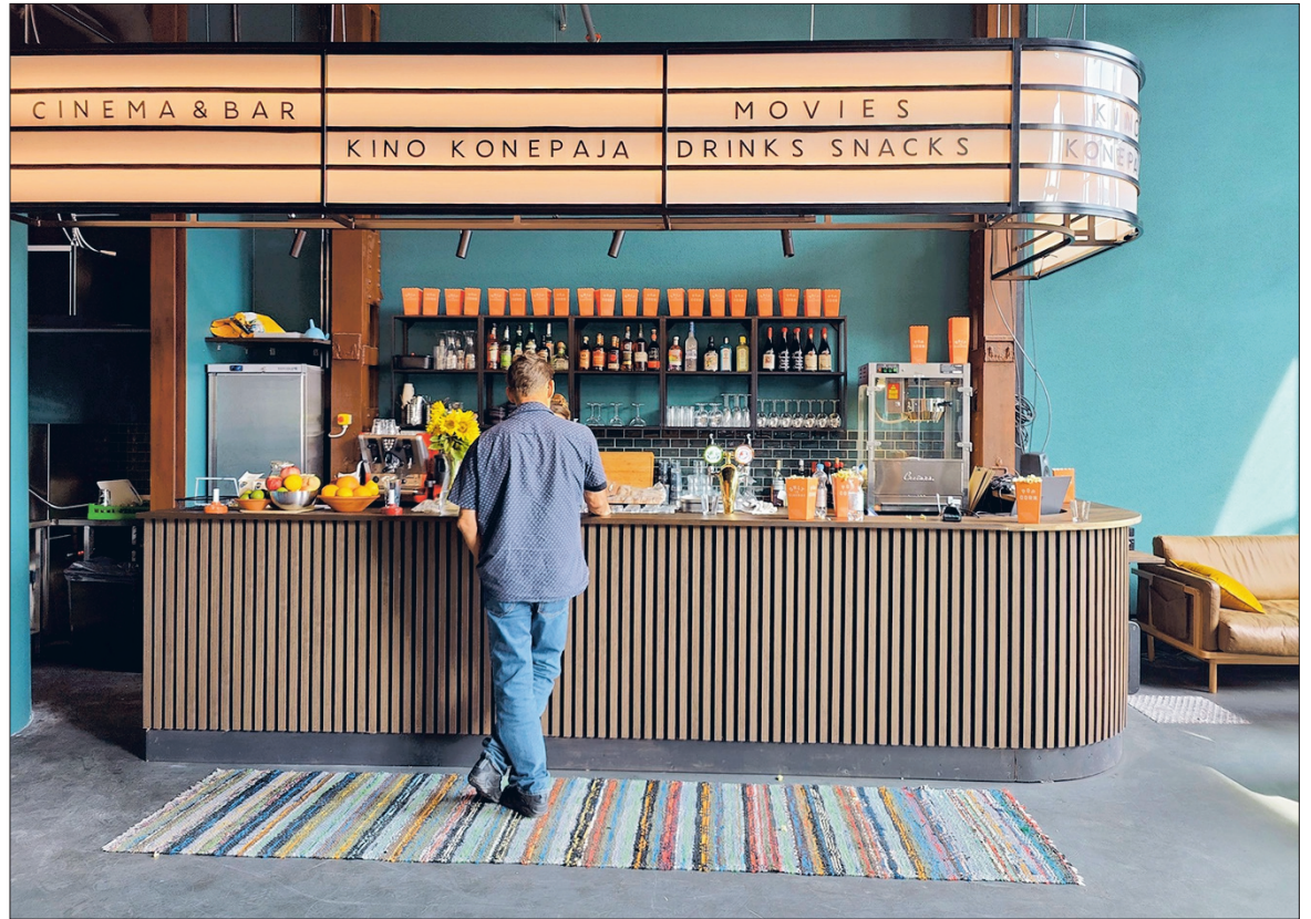
TEKSTI JA KUVAT / JUHANI STYRMAN