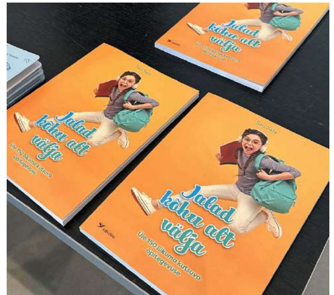
Sari Salon ensimmäisen, Suomessa 2017 ilmestyneen kirjan Peppu irti penkistä, ideat toiminnallisiin oppitunteihin ovat nyt käytössä myös Virossa!