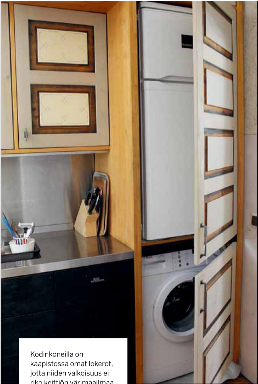
Kodinkoneilla on kaapistossa omat lokerot, jotta niiden valkoisuus ei riko keittiön värimaailmaa.