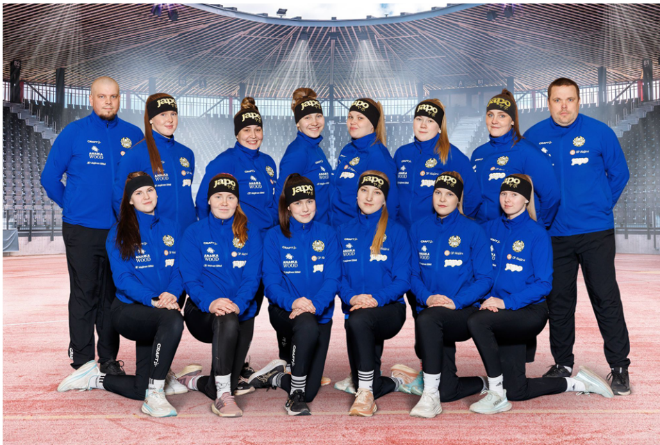
Tulevana lauantaina tehdään Kitrolla alajärveläistä pesäpallohistoriaa. Tuolloin alkaa Ankkureiden historian ensimmäinen Naisten Ykkösespiskaus kotiottelulla paikallisvastustaja Lappajärven Veikkoja vastaan.

- Talouden osalta Ykköspesis vaatii rahaa enemmän, yksinkertaisesti kustannukset vaan kasvavat. Olemme saaneet tukijoita taaksemme mukavasti, mikä heijastelee sitä, että kiin-