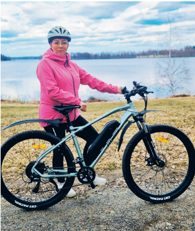
Annen perhe liikkuu paljon ja luonnossa kävely tai pyöräily on hyvä tapa nollata ajatukset.

– Perheissä on keinottomuutta, taloudellisia haasteita, uupumusta, vaikeita valintoja ja monia muita arkea kuor-