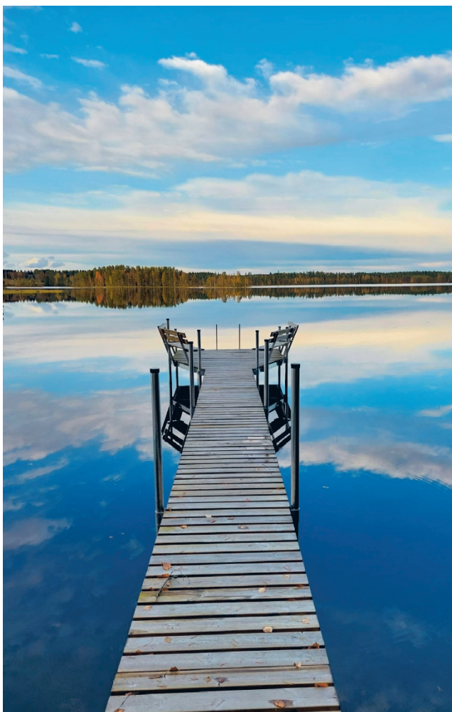
LP-Laiturin valikoima kasvaa entisestään. Ympäristöarvot ovat yritykselle tärkeitä.

kunniakkaat perinteet. Toiminta on viimeisen seitsemän vuoden aikana jatkanut tasaista kasvua. Myös tämä vuosi näyttää hyvältä, tilauksia on enemmän kuin viime vuonna vastaavaan aikaan.