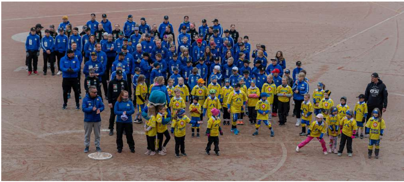
S-ryhmän Kannustajat-ohjelmassa on ollut tänä vuonna mukana 66 eteläpohjalaista seuraa. Alajärveltä on mukana muiden muassa Alajärven Ankkureiden junioripesäpalloliijat.

Ohjelmaan haki ja valittiin alueeltamme 66 seuraa ja heidän kannustajikseen on rekisteröitynyt yli 2 000 Eepeen asiakasomistajaa. Jaamme ohjelman kautta 100 000 euroa tukea alueemme lasten ja nuorten hyväksi. Haluamme tällä tuella olla mahdollisimman massassa mahdollisemman monelle lapselle ja nuorelle harrastusmahdollisuuksia. Kannustajat-ohjelma on osoittautunut hyväksi tavaksi tehdä tätä tukemista ja ohjelmaa jat-