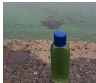
Lappajärvellä on havaittu myöhäinen sinileväkukinto. Levämassa on sotkenut rantoja ja kalastajien verkkoja. Sinilevästä otettiin näytteitä marraskuun 6. päivänä.

Etelä-Pohjanmaan ely-keskuksen erikoistutkija Anssi