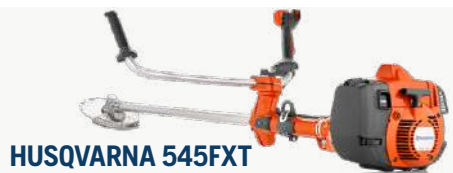
HUSQVARNA 545FXT RAIVAUSSAHA LÄMPÖKAHVOILLA

Suosittu ammattisaha! Autotune kaasuttimella.