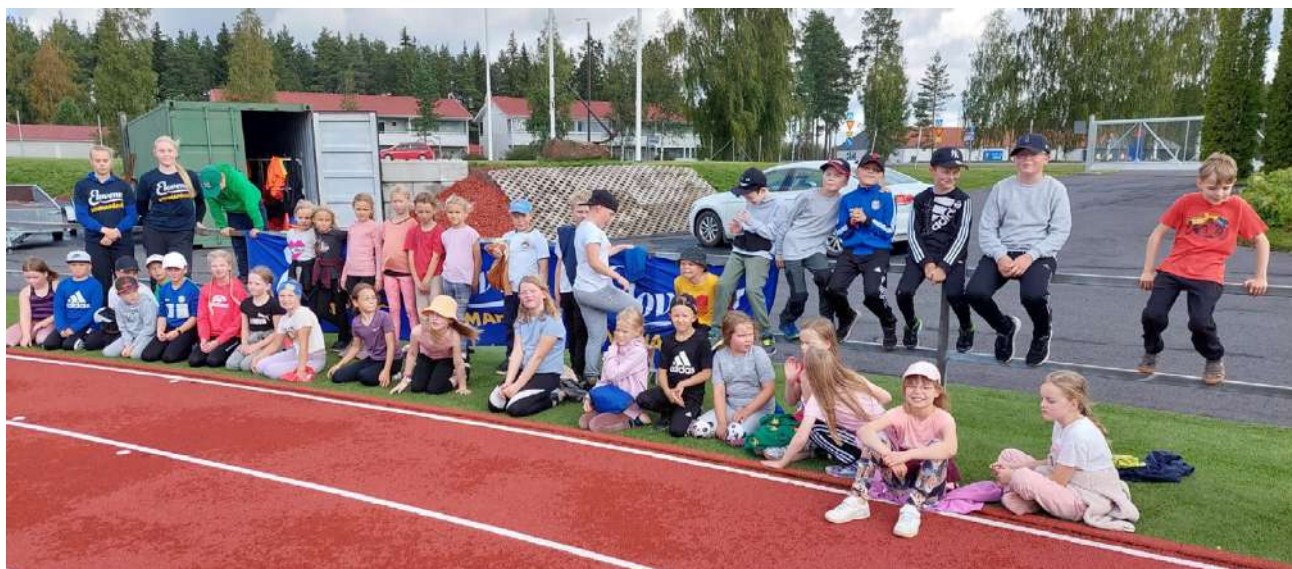
Elovena Voimapäivä liikutti Paavolan koulun oppilaita viime viikolla. Samalla saatiin tärkeää tietoa terveellisistä välipaloista.

Alajärven Ankkurikentällä toteutetussa Elovena Voima-