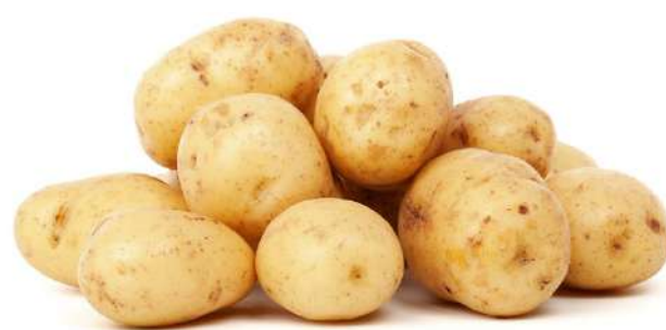
Varastoperunan sato odotukset eivät ole korkealla johtuen sateiden aiheuttamista laatu- ja määrätappioista.

Jatkuvat sateet heikentävät viljan laatua ja sen vuoksi toiveissa on, että sateet loppuisivat ja saisimme kuivan syk-