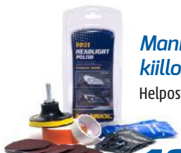
Mannol umpion kiillotussetti