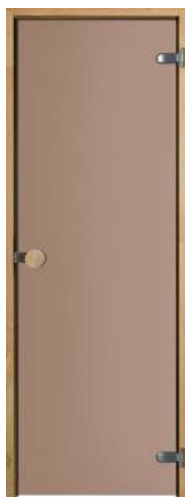
SAUNANOVI VIHTA 9X19 PRONSSI