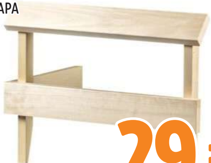
KIUASKAIDE 90X400X600 HAAPA