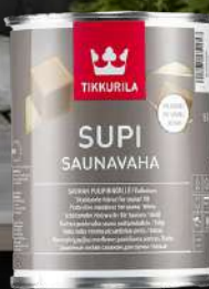
SUPI SAUNAVAHAT 0,225 L, 0,333 L, 0,9 L JA 1 L