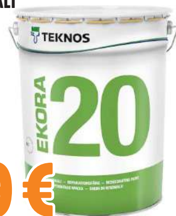
REMONTTIMAALI EKORA 20 VALK. 18 L