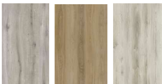
VINYYLILANKKU GOODIY CHLOE VÄRIT: ANIS, MANTELI JA VANILJA

KESKUSVARASTOLTA YLI 500 ERILAISTA LAATTAMALLIA 1-3 ARKIPÄIVÄSSÄ