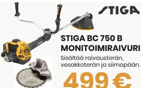
STIGA BC 750 B MONITOIMIRAIVURI

HUSQVARNA TILILLÄ 12 KK KOROTONTA MAKSUAIKAA.