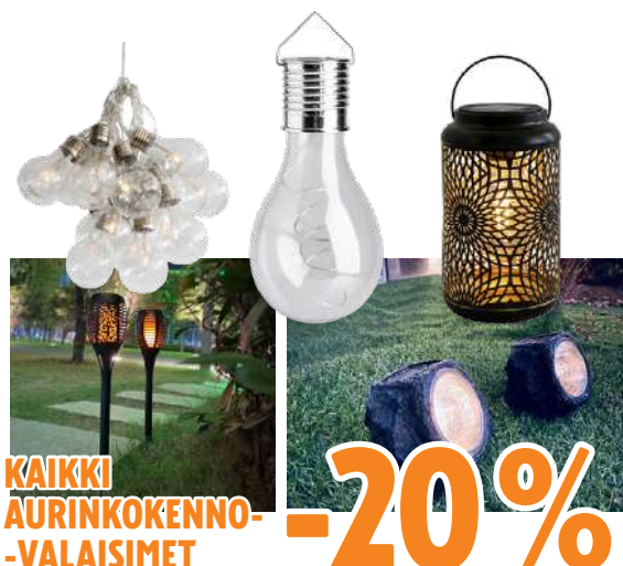
KAIKKI AURINKOKENNO- VALAISIMET