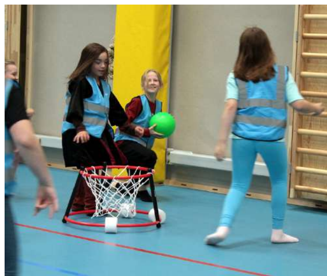
Lappis-Areenalla meno oli jonkin verran villimpää kuin kirjastossa. Lavettaret oli järjestänyt saliin Tavallisten tallaajien jästihuispaus -tapahtuman. Siinä pallo sai kyytiä, lapset hien pintaan ja takuulla erilaisen palloiluelämyksen.