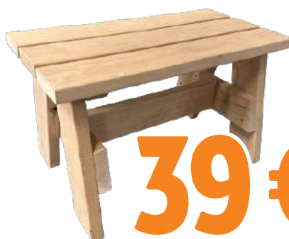
SAUNAJAKKARA LEPPÄ 25X300X600 MM