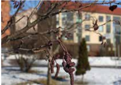
LVI-Tekniset urakoitsijat LVI-TU ry

– Tällä hetkellä asuinrakennusten korjaustar-