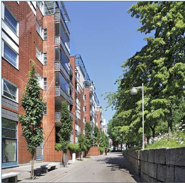
Näkinpuisto Helmiäispolulta nähtynä.