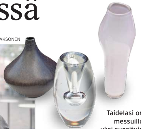
Taidelasi on messuilla yksi suosituin tuoteryhmä.

”Design. Siihen voi luottaa. Designiin kuuluvat myös astiat, jotka tekevät kauppansa, erityisesti 50-