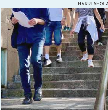
Helsinki -kävelyt on uusi moderni kävelytapahtuma, jota on toteuttamassa Siltasaariseura

Helsinki-kävelyt avaa perjantaina 7.4. klo 11.30 kulturneuvossa oleva, jopa Euroopan parhaaksi kaupunginosakävelyksi arvioitu "Kallio kierros – paskatornin kautta Kallion rajalle". Lähtöpaikka: Nyrkkeilijät patsas, Paasipuisto. Liput 10 e (kirja-arvonta). Tapahtuman pää-