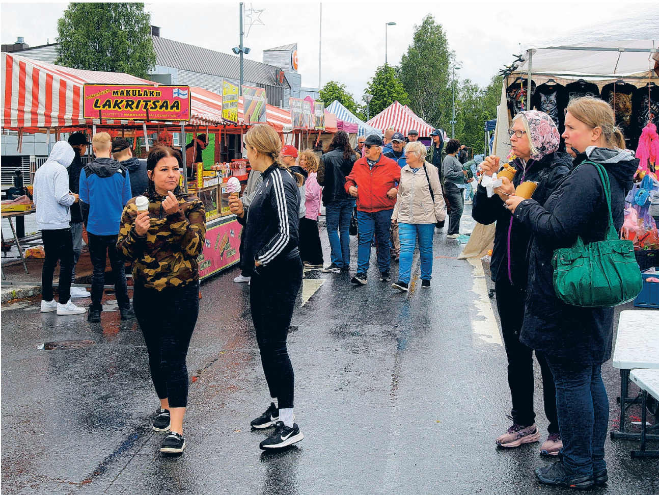
Perjantaina Rokulipäivät avautuivat kosteissa ja erittäin tuulisissa merkeissä. Silti markkinaväkeä alkoi valua paikalle säästä piittaamatta!