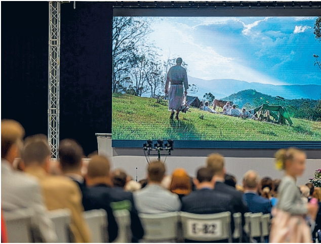
Tampereen Messu- ja Urheilukeskuksessa seurattiin muun muassa videosarjan uusia jaksoja.

Konventissa julkaistiin lisäksi kaksi uutta jaksoa kokonaan vapaaehtoisvoimin toteutetusta suurtuotannosta.