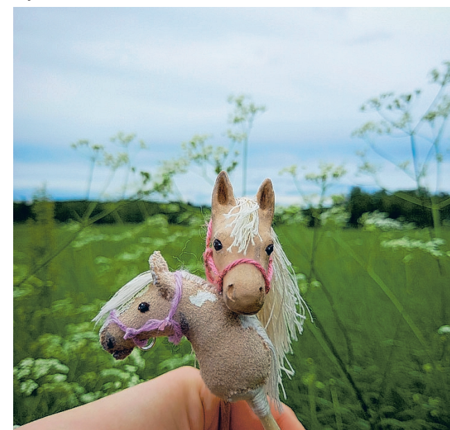
Ihastuttavat minikepparit sopivat loistavasti maskoteiksi tai vaikka valokuvauksikohteiksi!

parit ovat harrastus, jonka parissa aikuisellakin on lupa leikkiä ja pitää hauskaa, samalla kun saa monipuolista liikuntaa ja tapahtumia järjestäessä oppii paljon niiden järjestelystä, järjestötoiminnasta ja harrastukseen kiinteästi liittyvästä valokuvauksesta.