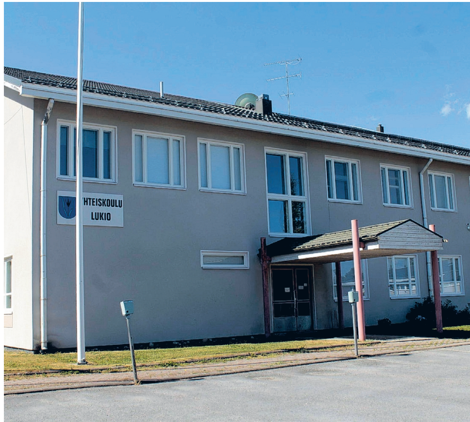
Vimpeli on saanut vuosien tauon jälkeen oman lukioluvan. Arkistokuva.

Hakemus lähti opetusministeriöön 19.12.2024. Lisäksi liitteiksi toimitettiin lukion opetussuunnitelma sekä kunnan talous- ja tilinpäätöstiedot.