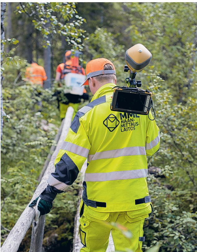
Kartoittajat käyvät maastossa, jotta yhteiskunnan monet karttapalvelut saadaan pidettyä ajan tasalla. Tämä työ on tärkeää, jotta voimme turvata luotettavat kartat ja paikkatiedot nyt ja tulevaisuudessa.

Lisäksi maastoon viedään valkoisia rasteja, joita kutsutaan signaaleiksi. Niiden avulla varmistetaan Maanmittauslaitoksen ilmakuvien onnistuminen, kun ku-