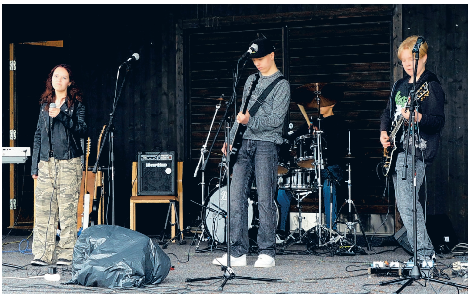
Rokulipäivillä kuultiin useita mainiota paikallisten nuorten bändejä. Tässä vuorossa The Revenant.