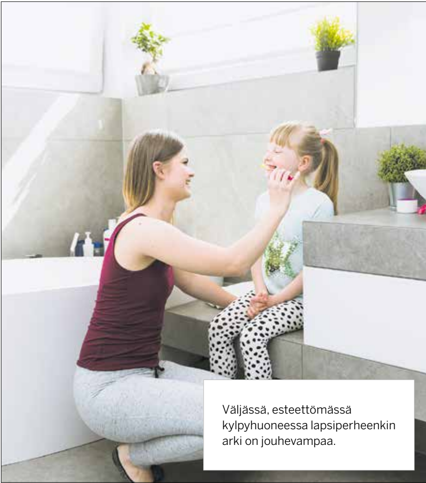
Väljässä, esteettömässä kylpyhuoneessa lapsiperheenkin arki on jouhevampaa.

Ikääntyminen voi tuoda mukanaan monenlaisia haasteita perusarkeen.