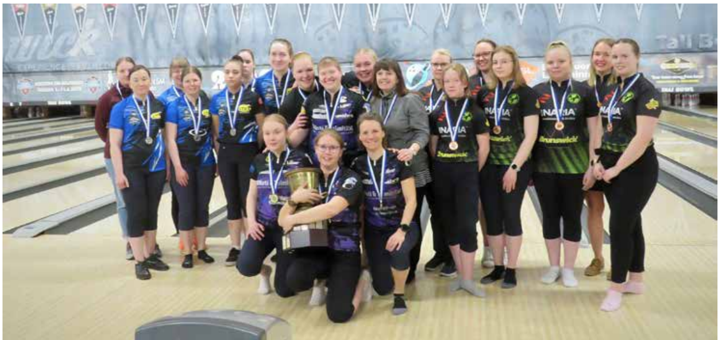
Naisten SM-liigan mitalistit kaudella 2021-22.