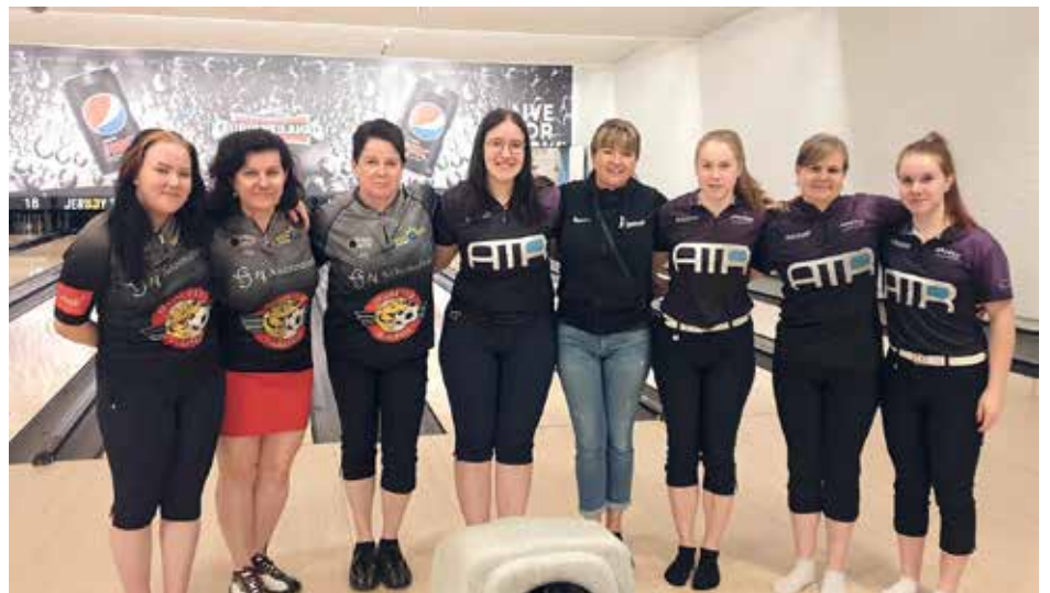
BooM ja Nasevat pelaavat ensi kaudellakin SM-liigassa.