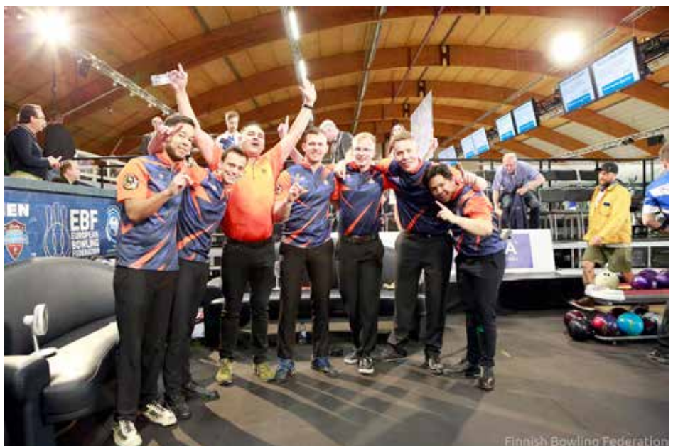
Hollanti teki yllätyksen ja keilasi maan ensimmäisen joukkuekullan miesten EM-kilpailuissa.

Suomen Keilailuliitolla oli kuitenkin vielä isompi suunnitelma juhlistaa sekä Lehtosen että kahden muun huippukeilaaajan merkittäviä maajoukkueuria. ●