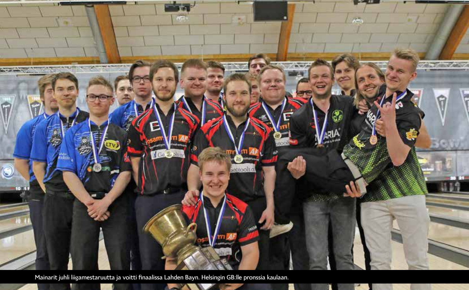
Mainarit juhli liigamestaruutta ja voitti finaalissa Lahden Bayn. Helsingin GB:lle pronssia kaulaan.