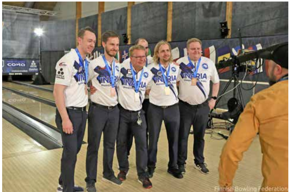
Suomen joukkueelle välierätappio oli pettymys, mutta lopulta pronssimitalikin tuntui hyvältä.