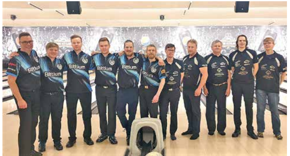
OPS nousee ensi kaudeksi mukaan SM-liigaan, RäMe puolestaan säilytti liigapaikkansa.

– Saimme ensimmäiseen peliin todella hyvän draivin päälle. Bay pelasi hieman ylemmällä ja saimme vedettyä vähän sen alapuolelta,