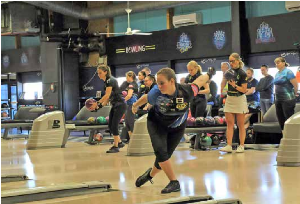
Pakarisen tavoite on naisten maajoukkueessa ja arvokilpailuissa.

– Tarvitsen parempia toistoja ja lisää lajitietämystä, jotta voin kehittyä paremmaksi. Aina voi totta kai kehittyä myös fyysisellä puolella, eikä voi sanoa, että tässä olisi oikeastaan koskaan täysin valmis. Naisten maajoukkue on iso tavoite ja toivotaan, että näytöt sinne tulevaisuudessa riittävät. Haluaisin nähdä itseni pelaamassa ja myös pärjäämässä siellä tulevien vuosien aikana. ●