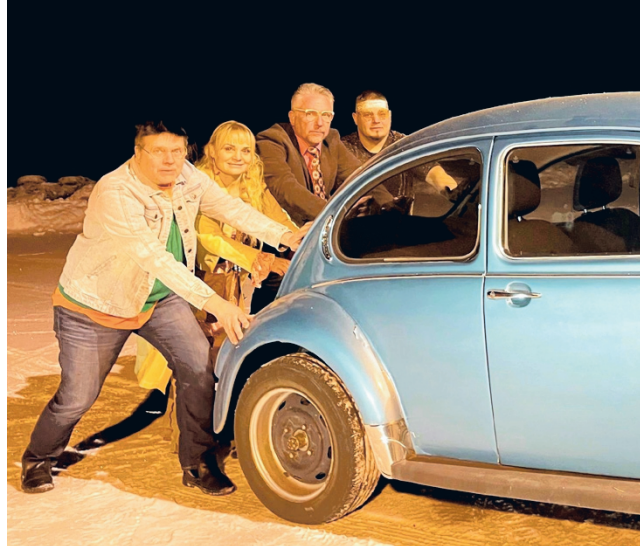
Alajärvellä päästään 70-luvun tunnelmiin Bensaa suonissa -konsertissa.

1970-luvulla Suomessa valitsi presidentti Urho Kekko-