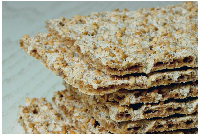
Varautuminen on muutakin kuin näkkileipäpaketti komerossa.

Alajärvellä tilaisuus on 19.3. valtuustosalissa. Kello 18 on aiheena kunnan varautuminen, kello 18.30 kotivara 72 tuntia ja kello 19 varautuminen ja väestönsuojelu.