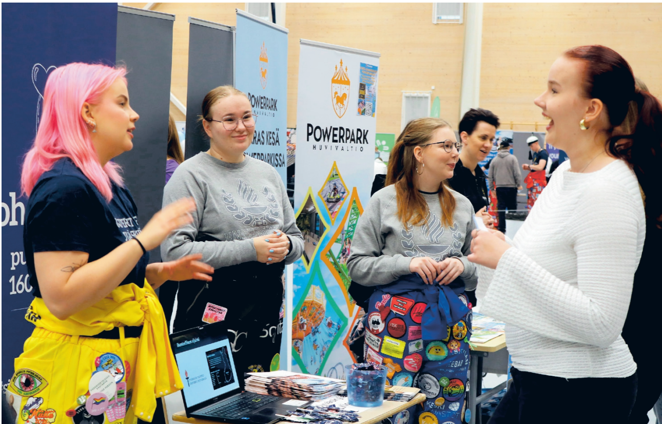
Jyväskylän yliopiston osasto kiinnosti messuyleisöä ja osastolla riittikin lähes jatkuvasti väkeä kyselemässä siitä, millainen paikka on kyseessä.

Paikallisia opiskelumahdollisuuksia esiteltiin Jamin näyttävällä ja toiminnallisella