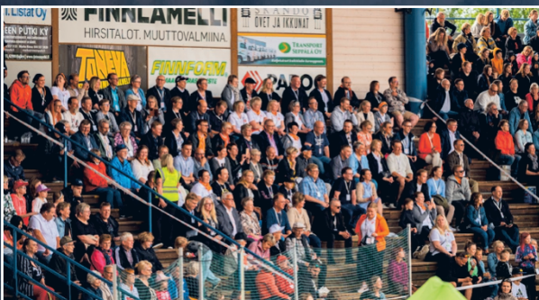
Ainutlaatuiset koko kylän synttärät kokosivat tuhannet juhlimaan.