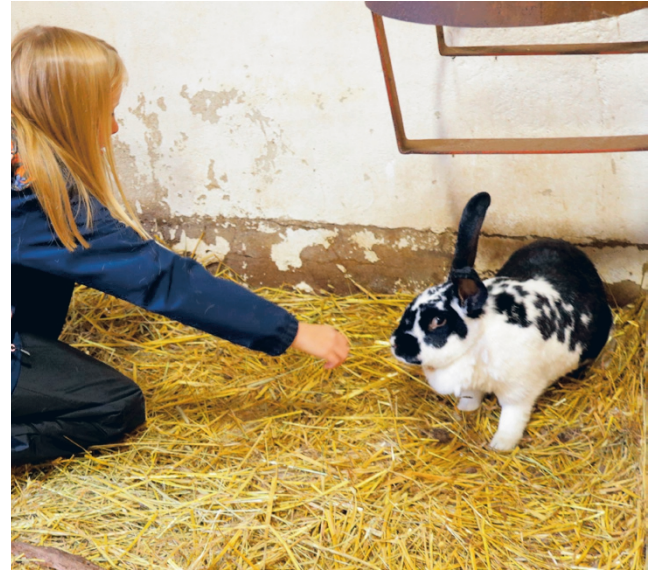
Kanit ovat aina lasten suosikkeja ja kaneihin osattiin myös suhtautua riittävässä rauhallisuudessa.

kerhokerran ohjelma suunnitellaan aina sen mukaan, montako lasta on paikalla ja millainen heidän vireystilansa kulloinkin on.