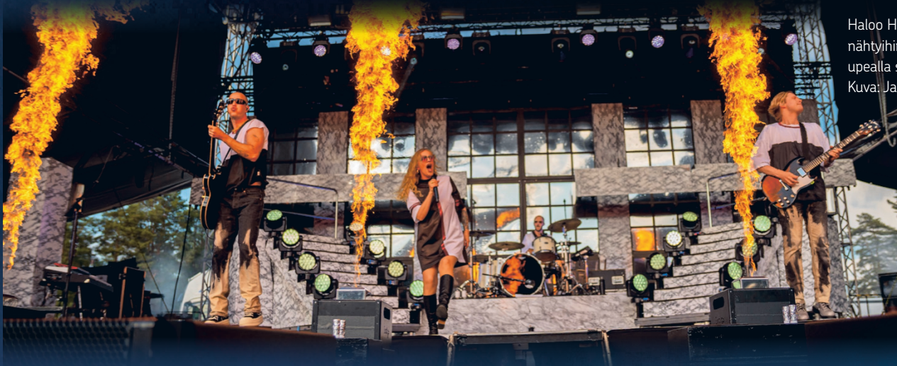
Haloo Helsinki kuuluu Olympiastadionillakin nähtyihin huippubändeihin. Nyt se valtasi upealla showlla Kitron Stadionin.