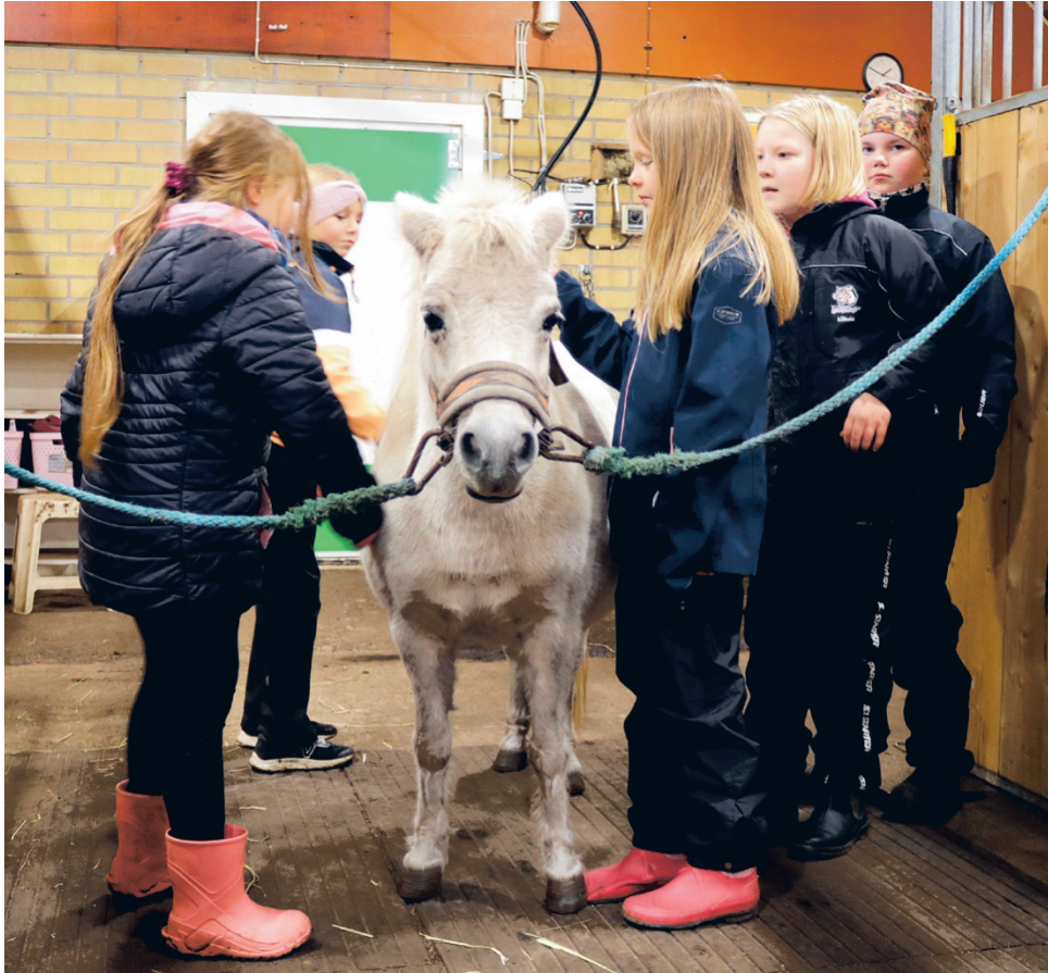
Pikkuisella amerikanminihevosella riitti hoitajia, kun eläinkerhon lapsilla oli vuorossa heppapäivä!

Nopeasti tuli selväksi, että koulupäivän jälkeen lapsilla ei ole enää energiaa teoriapuoliseen asiaan, vaan he kaipaavat nimenomaan eläinten lähellä olemista ja niiden kanssa puuhailua. Niinpä suunnitelmat menivät uusiksi ja nyt kunkin