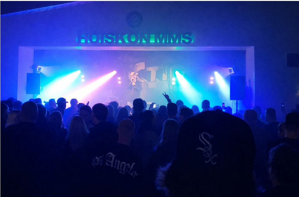
Kevättä kohti mentäessä seuraavana bilekansaa viihdyttävät Teflon Brothers ystäväpäivän aikaan 14. helmikuuta.

Kevättä kohti mentäessä seuraavana bilekansaa viihdyttävät Teflon Brothers ystäväpäivän aikaan 14. helmikuuta. Huhtikuussa, 18. päivä, Hoiskolla nähdään legendaarinen Frederik ja kevät huipentuu 23. toukokuuta, kun lavalle nousee Jari Sillanpää. Ohjelmassa riittää monenlaista, ja odotukset ovat korkealla erityisesti Teflon Brothersien osalta!