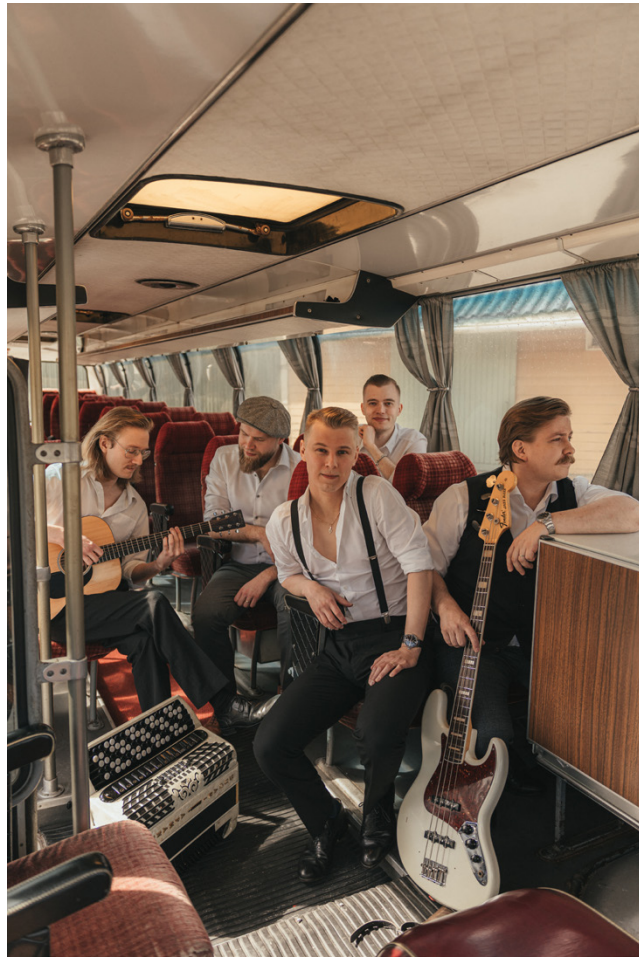
Gaalassa esiintyvä Komiat-yhtye on ehdolla viidessä kategoriassa. Seuraavaksi eniten ehdokkauksia saivat JVG, Bess, Haloo Helsinki! ja Portion Boys.

Iskelmä Gaala järjestetään perjantaina 20. helmikuuta 2026 Tampereen Nokia Arenalla. Tapahtumassa palkitaan Iskelmän vuosiäänestyksen voittajat. Tammikuussa järjestettyyn äänestykseen osallistui yli 20 000 radiokuuntelijaa. Yleisö äänesti voittajat kuudessa kategoriassa: vuoden iskelmä, vuoden albumi, vuoden artisti, vuoden yhtye, vuoden tulokas ja vuoden viihdyttäjä.