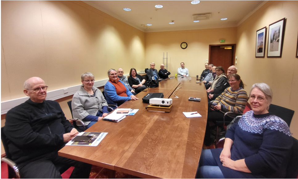
Pohjoisen Pohjanmaan alueen paikkakuntien vapaaehtoiset kokoontuivat yhteiseen työpajaan valmiusavauksessa.

Pohjoisen Pohjanmaan paikkalistoimikuntaan kuuluvat Härmänmaan lisäksi Järvi-