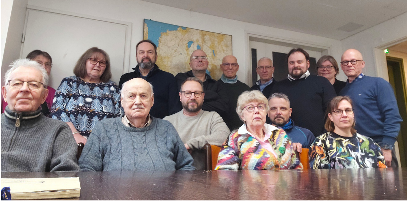
Alajärven toimipisteen nykyinen ja entinen henkilöstö muistelivat mukavia yhteisiä kokemuksia toimipisteen hautajaisissa.