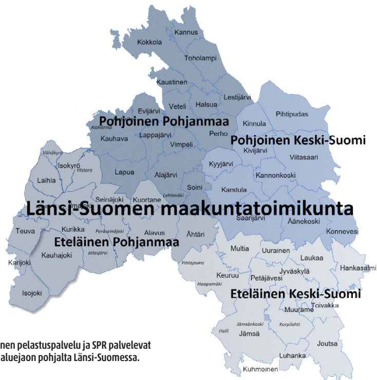
Vapaaehtoinen pelastuspalvelu ja SPR palvelevat yhtenäisen aluejaon pohjalta Länsi-Suomessa.