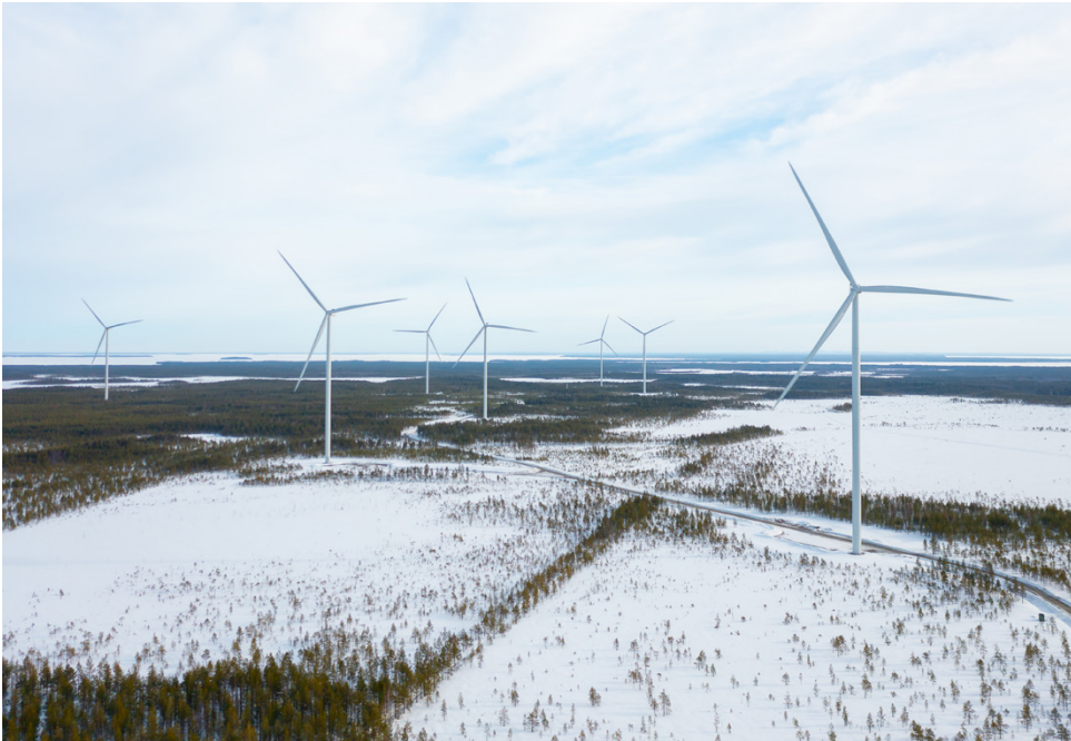
Soiniin rakentuu vuoden 2027 loppuun mennessä 17 tuulivoimalaa, noin seitsemän kilometrin päähän Soinin keskustasta.

– Soinissa työt ovat käynnistyneet noin kymmenen kilometrin mittaisen 110 kilovoltin voimajohtolinjan rakennustyöillä Korkeamaalta Alajärven sähköasemalle. Tällä hetkellä poistetaan puustoa ja pylväiden perustuksia aletaan tehdä vielä helmikuun aikana, Ne-