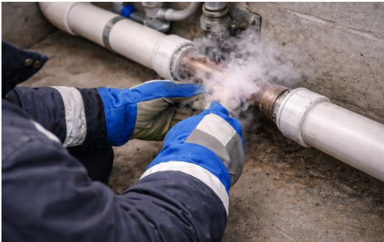
Kun putket jäätyvät, niiden sulattaminen kannattaa jättää ammattilaisen hoidettavaksi lisävahinkojen välttämiseksi. Kuvituskuva/Al.

– Vanha konsti tuoda kivi-jalkaan mahdollisimman pal-