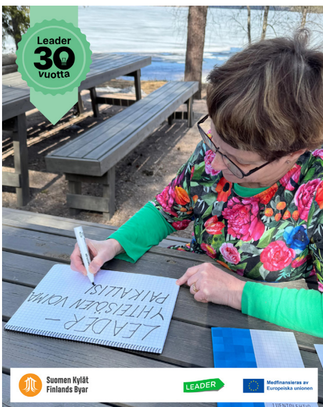
Suomen Leader-toiminta on EU:n vaikuttavinta. Kuluvan ohjelmakauden tulokset osoittavat, että Leader-toiminnan merkitys ihmisille, yhteisöille ja yrityksille on vahvistunut.

Leader-toiminta vastaa paikallisiin tarpeisiin, vahvistaa paikallisia yhteisöjä ja lisää ihmisten mahdollisuutta vaikuttaa. Se tuo myös EU:n lähemmäs kansalaisia, sillä 1 000 Leader-hallituslaista ovat omalla alueellaan EU-päät-