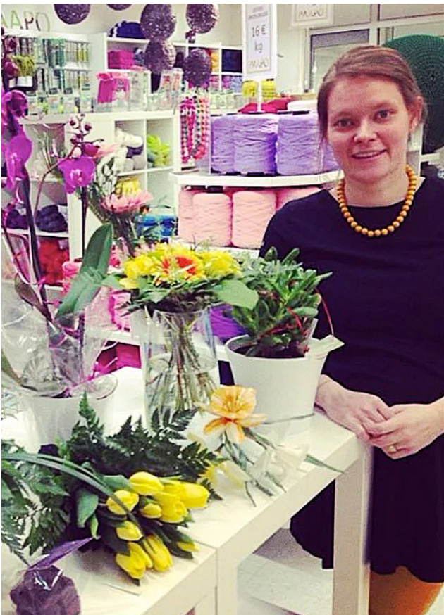
Ensimmäiset oikeat liiketilat Paapo sai muuttaessaan entisiin Tiimarin tiloihin.

Anne kokee, että lapset ovat yrittäjälle myös voimavara. – Yrittäjällä työtä riittää loputtomasti, mutta lapset pakottavat pysähtymään ja irrottautu-