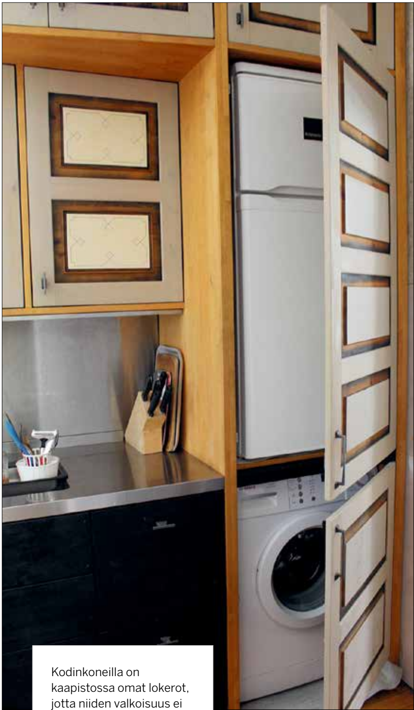
Kodinkoneilla on kaapistossa omat lokerot, jotta niiden valkoisuus ei riko keittiön värimaailmaa.