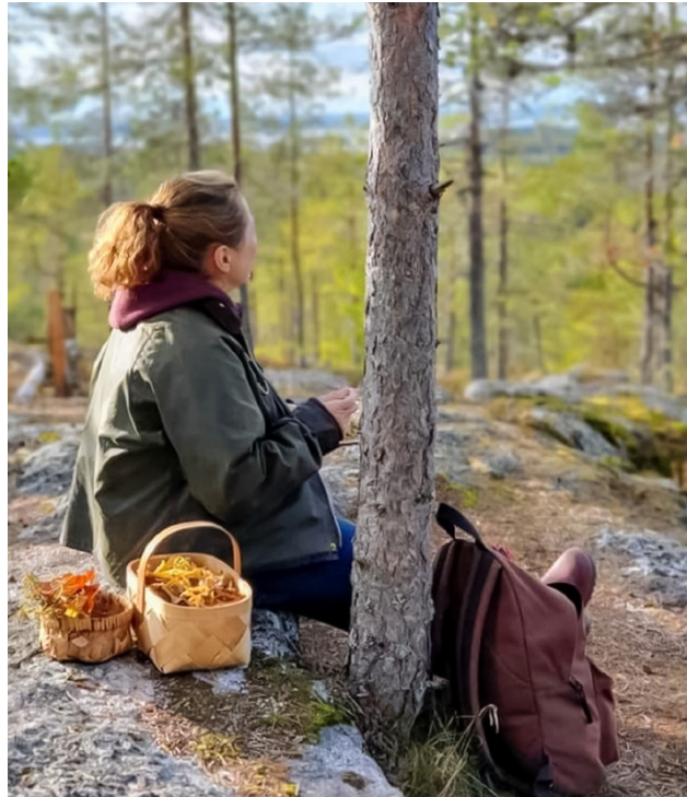
Ohjelmassa jatkavat suositut mm. Lumoudu lähiluonnosta -kurssit, joissa kiinnostaviin lähikohteisiin tutustutaan luonnossa liikkuen.

tut Tule retkeilemään! -kurssit ja Lumoudu lähiluonnosta -kurssit, joissa kotiseutuun ja