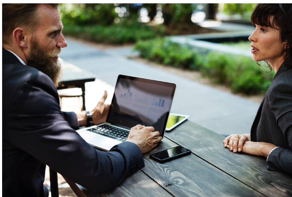
Finnveran Rahoitus & kasvu -kesäkatsauksessa käydään läpi Pk-yritysbarometrien omistajanvaihdostietoja viime vuosilta.

Toisaalta, vaikka yritys olisi myyntihalukas, ei se välttämättä aina ole myyntikelpoi-