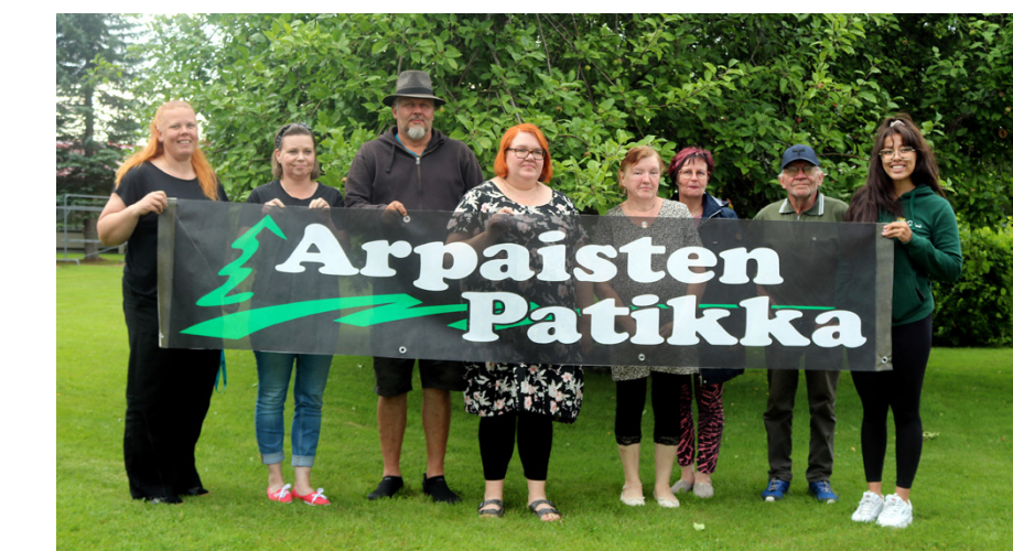
Arpaisten patikan rutinoitunut järjestelyporukka kutsuu jälleen luonnossa liikkuvaa kansaa Soiniin! Kaikkiaan tapahtumapäivänä järjestelyissä on mukana noin 30 henkilöä.

Patikassa on tarjolla kolme reittivaihtoehtoa, joille lähdetään Soinin yhteistalolta. Sieltä bussit kuljettavat osallistujat heidän valitsemilleen lähtöpaikoille. Lähtöpaikoilta patikoidaan omaan tahtiin Kaihiharjuun, mistä on nonstop -tyylinen bussikuljetus takaisin Yhteistalolle.