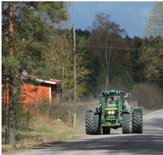
Ennen ison puimurin tai traktorin ohitusta kannattaa miettiä, onko sitä lainkaan tarpeellista ohittaa.