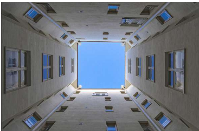
Valopiha tuo valoa asuntoihin, porrashuoneisiin, yhdyskäytävälle ja pihalle. Kuvaushetkellä taivas oli puhtaan sininen.