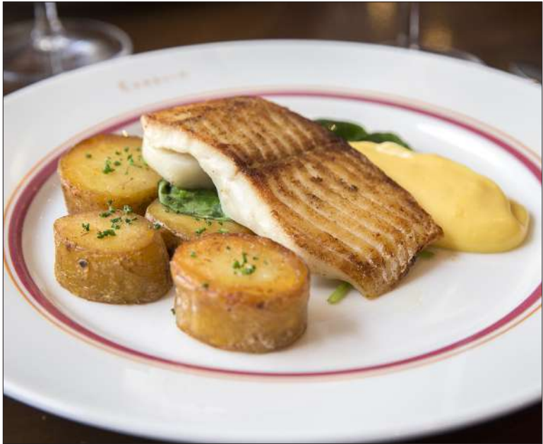
Hiiligrillissä paahdettua haukea tarjoiitiin Carelian klassisen hollandaisen kera.

naristien arvostamaa Hokkaido-kampasimpukkaa saattelee myös hollandaise. Ostereita ja kampa-simpukoita myydään kappaleittain (6-7 e), joten ruokailun ko-reografiaan on kätevää sisällyttää eri makuja. Teemaviikoilla on tarjolla myös sinisimpukoita á la Roquefort ja Marnière sekä päivän seafood-annos, jonka kokoonpano vaihtelee kulloinkin saatavilla olevan parhaan raaka-aineen mukaisesti. Kandidaatteja ovat muun muassa Pohjois-Atlantin ruijanpallas, piikkikampela ja keskitalven ruokasesongin tähti eli teräsjään alta pyydettyä made, jota keittiöpäällikkö suunnittelee paahtavansa hiiligrillissä.