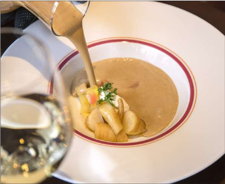
Silkkinen suloisessa palsternakkakeitossa maistui mainio pikkelöity talviomena ja palsternakka.

keittotaito ovat reilassa. Loman luottaa länsirannikon merihaukeen, jota hän tarjoili hiiligrillissä maukkaaksi paahdettuna. Kalan erinomaista makua saatteli klassinen hollandaise, joka Careliassa on viritetty huipputasolle. Simppelille ja mauiltaan rehevälle annokselle istui hyvin reipasta hapokkuutta huokunut hedelmäinen Chardonnay.