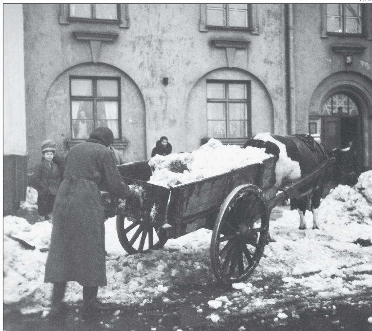
Eteläinen Hesperiankatu 28 vuodelta 1940.