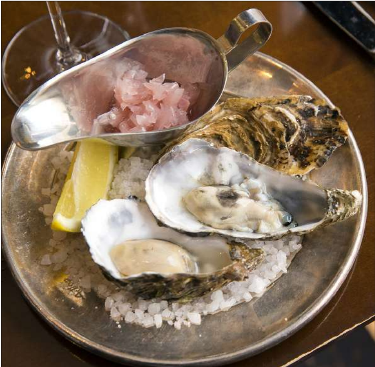
Pousse de Claire -ostereita tarjoiitiin klassisen Mignonette-dressingin kanssa. Kuplivan blanc de blancs'in ihana maku kohotti mielialan sfääreihin.

Keittiöpäällikkö Loman on tunnetusti hauen suuri ystävä. Moni kalastus- ja ruoanlaittotaitoinen eränkävijä määrittelee eritoten hauen suosikkikalakseen. Siihen on helppo yhtyä, kun puhtaista vesistä pyydetty tuore kala ja