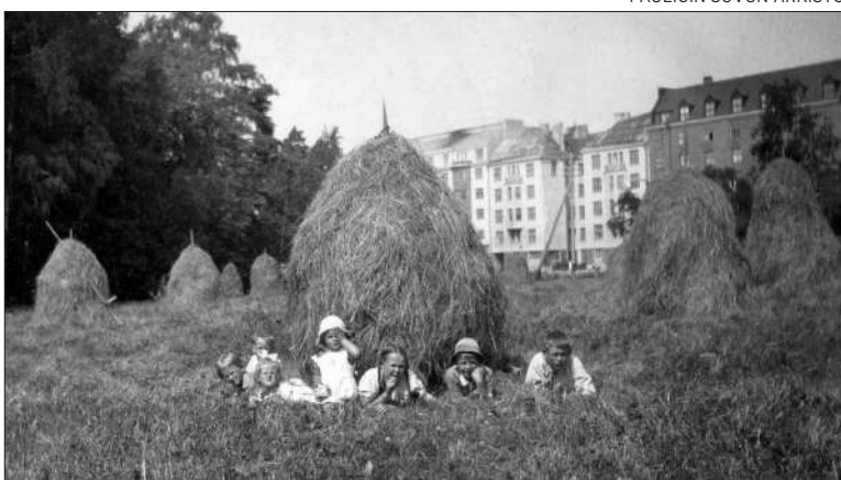
Nykyisen Topeliuksenpuiston kohdalla nähtiin 1920-luvun lopulla heinäseipäitä. Taka-alalla Topeliuksenkatu ja Eureka.

haa, koska ateriat olivat edullisia. Säästön lisäksi korostettiin yhteiskeittiön hygieenisyyttä ja terveellisyttä.