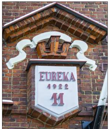
Talon valmistumisvuosi ja katunumero näkyvät julkisivussa.

”Taloon tulijoiden vahtimisen lisäksi portieeri hoiti ruokatilauk-