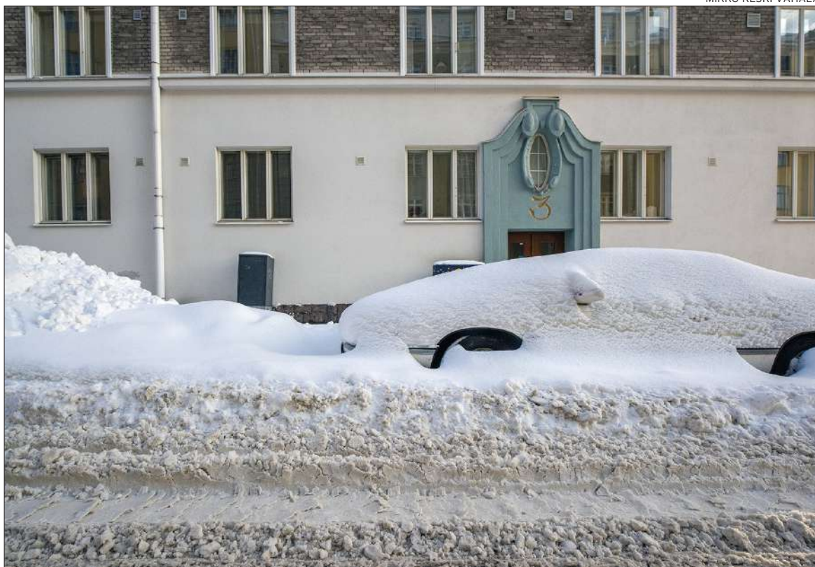
Runsasluminen talvi on haaste kaikkialla kaupungissa.