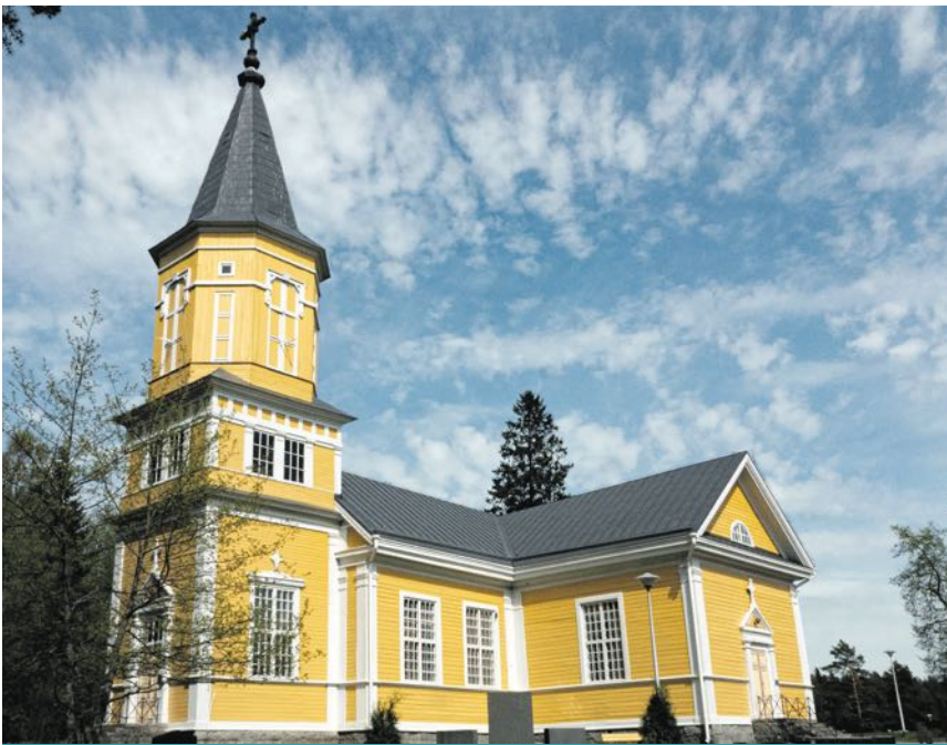
Tyypiltään Lavian kirkko on tasavartinen ristikirkko, johon liittyy pääty- torni.

Perheneuvonta: Luottamuksellista keskusteluapua elämän eri tilanteisiin. Eteläpuisto 10 A, 28100 Pori. Ajanvaraus ma, ke ja pe klo 10-11, p. 0400 309 785. Seurakuntapalvelut: Lähimmäisyyttä arjessa. Yhteinen diakoniatyö, kasvatus ja kirkon oppilaitostyö. Eteläpuisto 10 A, 28100 Pori, p. 0400 309 768. Sairaalasielunhoito potilasta, hänen läheisiään sekä hoitohenkilökuntaa var- ten. Sairaalapappien toimipaikat: Harjavallan psykiatrinen sairaala, Porin perus- turvakeskus, Satasairaala, p. 02 6238 700, www.kirkkoporis.fi/suru-ja-kriisi Toimintakeskukset: Silokallio ja Junnila, p. 044 730 9688, silokallio@evl.fi