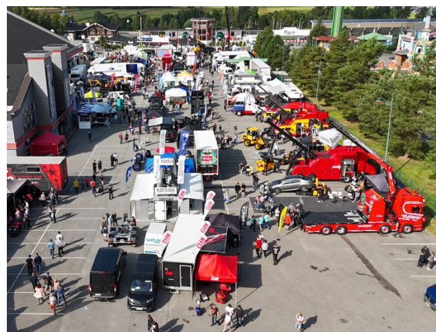
Power Truck Show'ssa ennätysmäärä näyttelyasettajia! Tapahtuma-alue täyttyi jälleen raskaankaluston maahantuojista, varustelijoista, palveluntarjoajista ja kuljetusalan asiantuntijoista - mukana noin 180 messuosastoa, jotka esittelevät alan uusimmat ratkaisut ja innovaatiot.

- Haluamme tarjota alalle konkreettisia näkymiä siihen, millaisia vaihtoehtoja perinteisten polttoaineiden rinnalle on jo nyt saatavilla ja mitä tule-