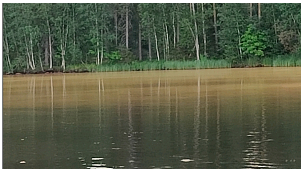
Kuusen-suopursunruosteen ruostesienen itiöpöly saattaa kuivina ja tuulisina päivinä kulkeutua ilmapölystä mukana ja laskeutua vesistöihin.