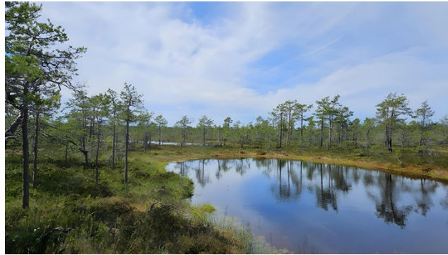
Lukuisat ja monimuotoiset suoalueet ovat tunnusomaisia Etelä-Pohjanmaalle. Soilla tavataan useita uhanalaisia lintu- ja hyönteislajeja.

– SYKEN selvitys on ainutlaatuinen, sillä Pohjanmaan alueella ei ole koskaan aiemmin tehty näin kattavaa ja yksityiskohtaista selvitystä alueen luontotyypeistä ja lajeista ja vieläpä maan parhaiden asiantuntijoiden toimesta. Selvitys on suureksi avuksi työssä luonnon monimuotoisuuden edistämiseksi Pohjanmaan ja Etelä-Pohjanmaan maakun-