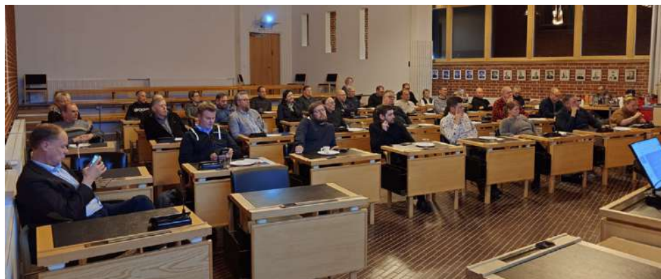
Kyselyn tuloksia esiteltiin alajärvellä yrittäjille kaupungin ja Alajärven Yrittäjien järjestämässä Pizzaillassa.

tuli kuitenkin siitä, että yrittäjät eivät koe Alajärveä vetovoimaiseksi kunnaksi.