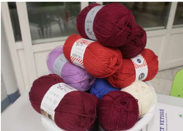
SPR:n vapaaehtoiset toimivat monella eri tavalla myös oman paikkakunnan hyväksi. Osasto lahjoitti jäsenilleen lankaa, joista neulotaan monta sukkaparia tuomaan lämpöä.