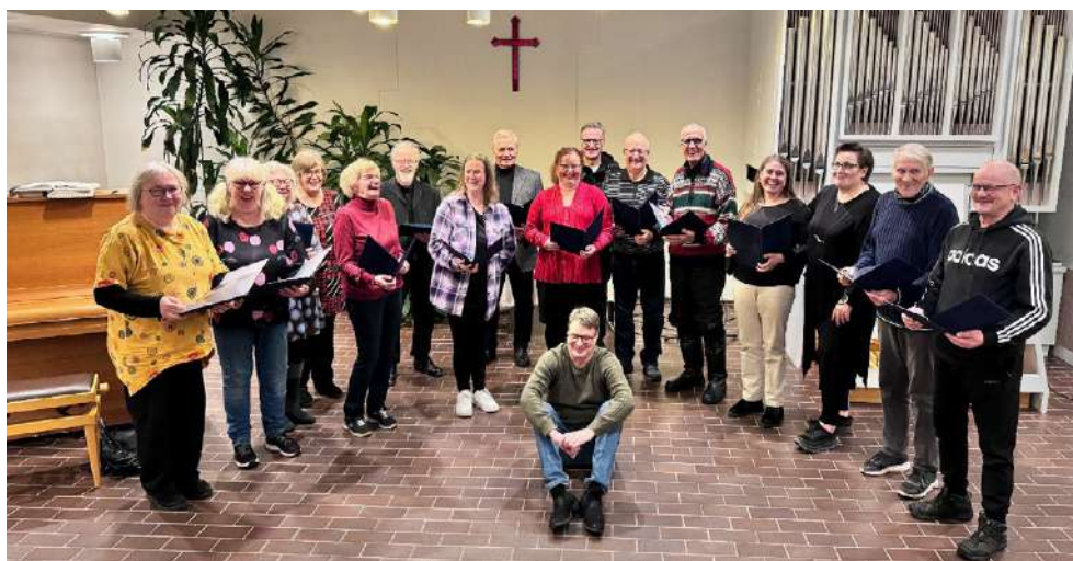
Kuoro on kiitollinen Osuuspankilta saamistaan uusista kansioista.

Oppiminen tuo mukavaa haastetta, kun lauletaan neliäänisesti. Kirkkokuoron harjoittelu on pitkäjänteistä. Harjoituksia on pidetty suunnilleen kerran viikossa.