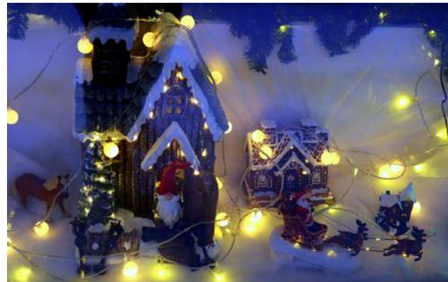
Alajärven Optiikan jouluisissa näyteikkunassa riittää ihania yksityiskohtia! Kannattaa poiketa katsomaan!

den voimakkuudet, kirjoitat ne vaikka lapulle mukaan, mutta välttämätöntä tämä ei ole.