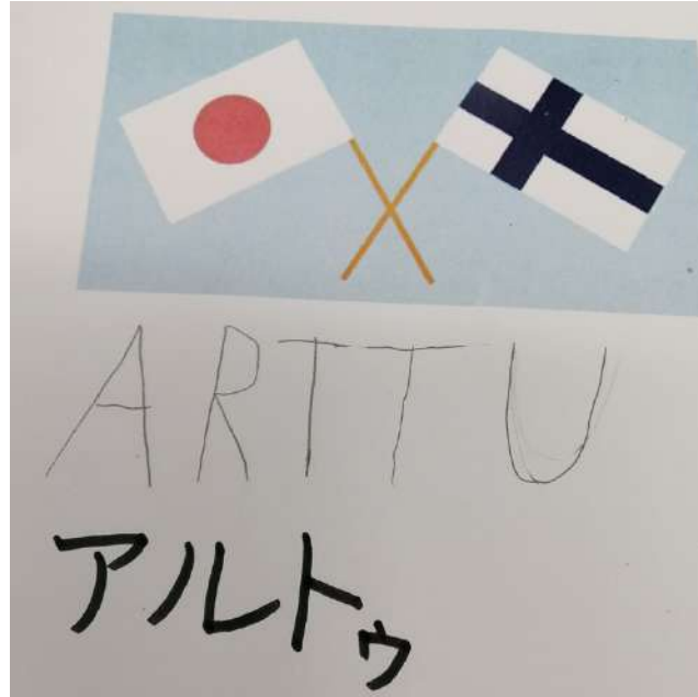
Artun nimi kirjoitettuna japaniksi.

Moni innostui niin, että tammikuussa alkava peruskurssi