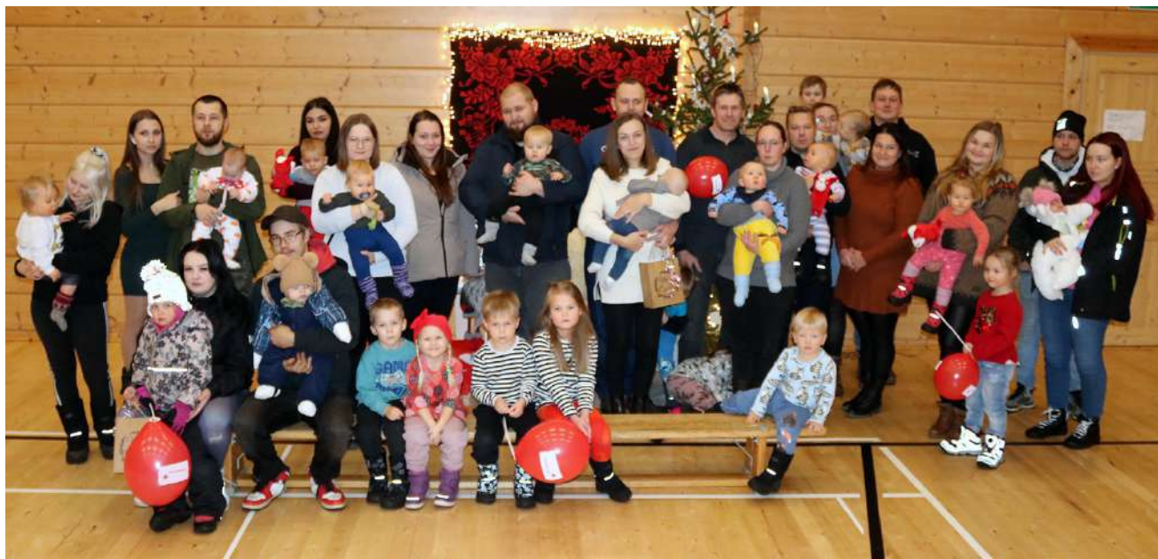
SPR:n Lehtimäen osasto muisti Lehtimäellä tänä vuonna syntyneiden vauvojen perheitä sekä ensimmäistä kertaa myös yksivuotissynttäreitään juhlivia!