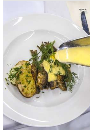
Yksi kilpailun pääruoka-annos oli paistettut muikut, kastikkeena voi-valkoviinikastike.

”Pitääkö suomalaisessa ravintolassa tai kahvilassa asiakaspalvelijoiden mielestäsi osata suomea? ”Ei välttämättä. Kansainvälisyys korostuu etenkin Helsingissä.”