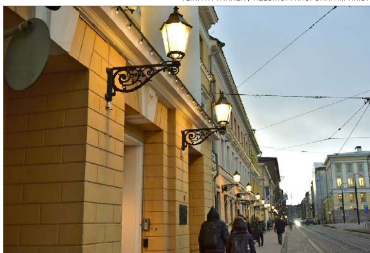
TEINA RYNNÄNEN / HELSINGIN KAUPUNKIYMPÄRISTÖ

UUSI VALAISTUS on parhaimmillaan hämärinä illan ja yön hetkinä. Uuden valaistuksen avulla aukioalueen hämärän ajan kaupunkinäkö on tasapainoinen ja tunnistettava kokonaisuus. Senaatintorin uusi valaistus käsittää katu- ja torivalaistuksen lisäksi ympäröivien rakennusten julkisivuvalaistukset. Lisäksi Katari-