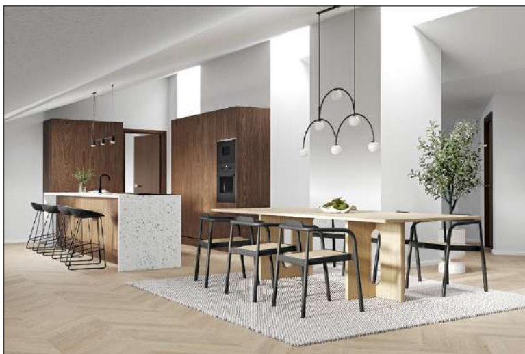
Asunnot toteutetaan laadukkaasti. Hissikin nousee huipulle asti.

sekä valtavirrasta poikkeavat tilaratkaisut.