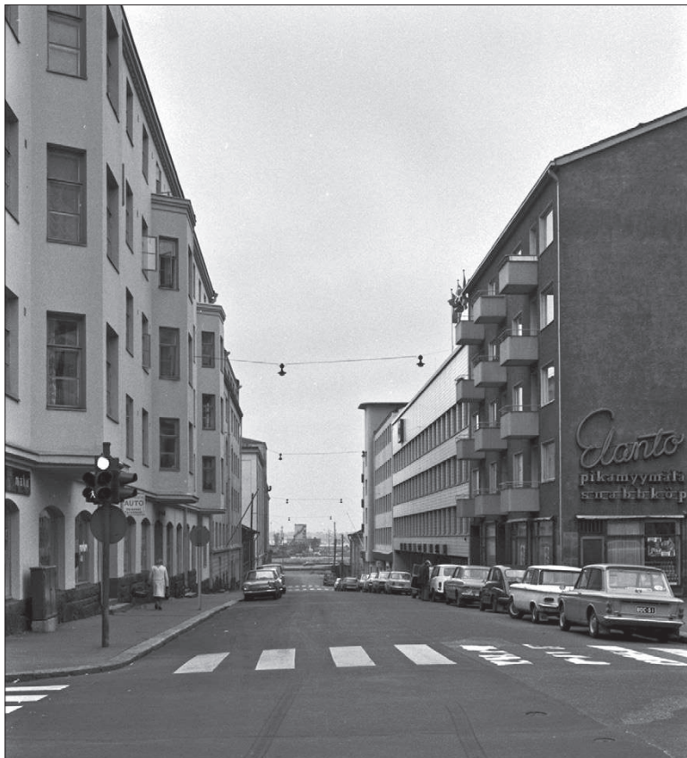
Näkymä Eerikinkadun ja Hietalahden risteykseen vuonna 1970, Eerikinkatu 48 etualalla vasemmalla.

Ullakkoasunnot ovat yleensä laatikkomaisia kerrostalohuoneistoja persoonallisempia. Ostajia miellyttää monimuotoiset ja korkeat huoneet, ikkunanäkymät