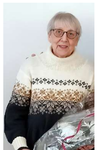
2021-2022 ja liittohallituksessa vuodesta 2023 alkaen.