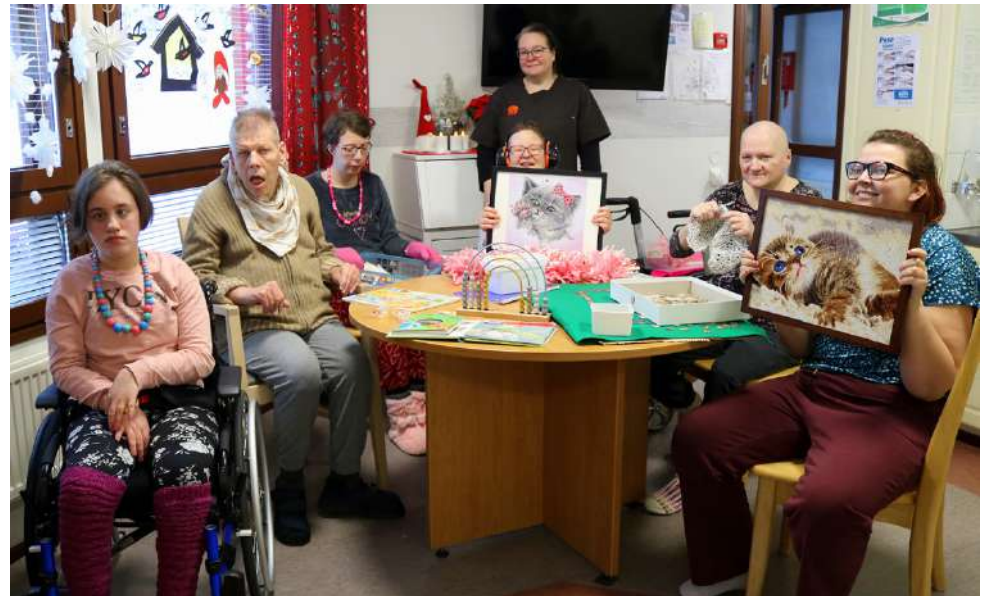
Kuusioslinna Terveys Oy:n Soinissa sijaitsevan Asumispalveluyksikkö Apilan asukkaat ovat ohjaajiansa ja Työpaja Vipun päivätoiminnassa valmistaneet monenlaista kaunista askartelua, taidetta ja käsityötä, joihin pääsee tutustumaan ensi viikon ajan Soinin kirjaston näyttelytilassa!

Näiden tuotteiden kanssa esille pääseminen on Apilan