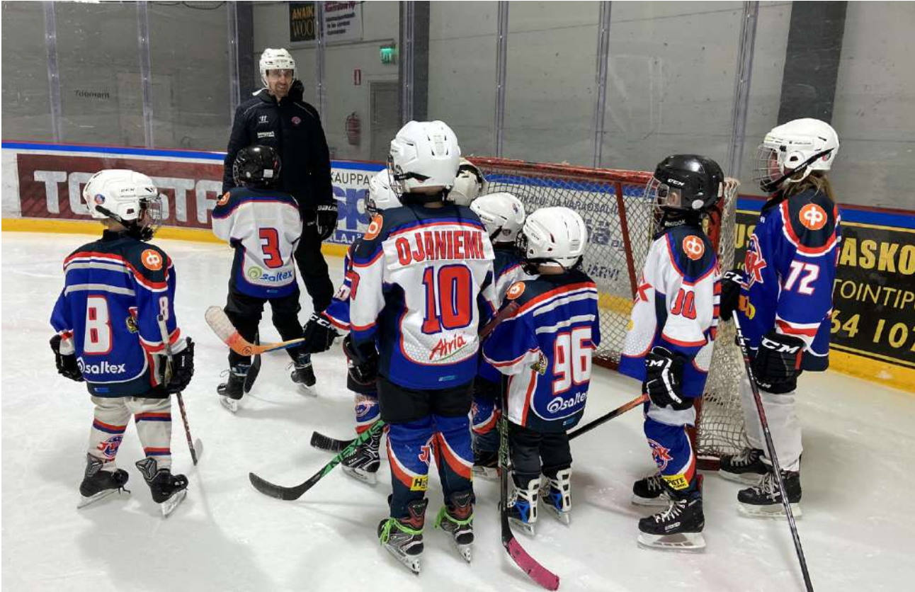
Järvisuodun Pallokerhossa halutaan tukea lasten ja nuorten liikuntaharrastusta, oli kyseessä tavoitteellinen harjoittelu tai mukava harrastus kavereiden kanssa.

Järvisuodun Pallokerho on paaluttanut tavoitteekseen olla alueen liikuttavin seura.