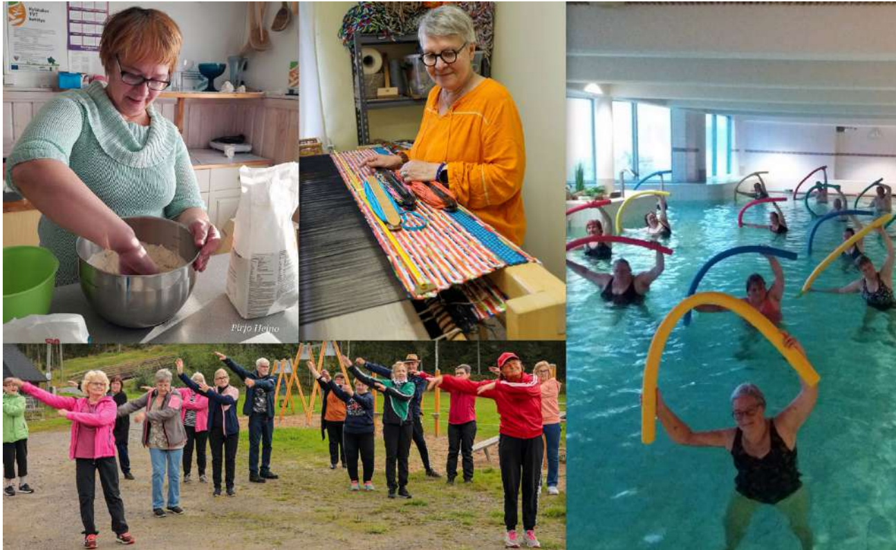
Kevään 2024 kurssiohjelmassa on huomioitu osallistujilta tulleet kurssitoiveet. Monenlaista mukavaa on siis luvassa myös kevätkaudelle.