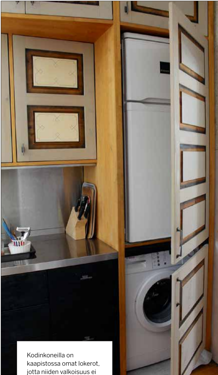
Kodinkoneilla on kaapistossa omat lokerot, jotta niiden valkoisuus ei riko keittiön värimaailmaa.