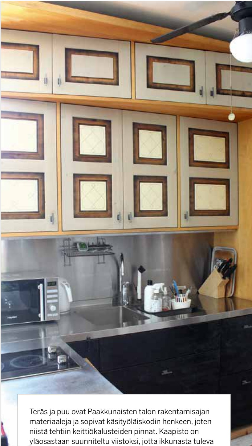
Teräs ja puu ovat Paakkunaisten talon rakentamisajan materiaaleja ja sopivat käsityöläiskodin henkeen, joten niistä tehtiin keittiökalusteiden pinnat. Kaapisto on yläosastaan suunniteltu viistoksi, jotta ikkunasta tuleva luonnonvalo saadaan hyödynnettyä parhaalla tavalla.