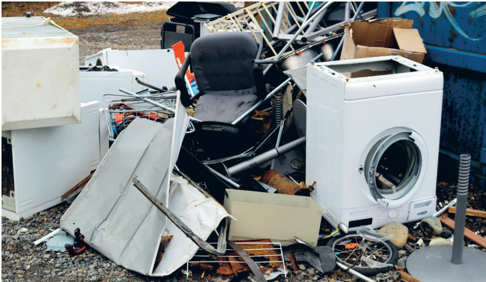
Tämä ei ole sitä, mille metallinkeräyspaikalla pitäisi näyttää. Pahimmillaan koko toiminta vaarantuu, koska paikalle tuodaan sinne kuulumatonta tavaraa.