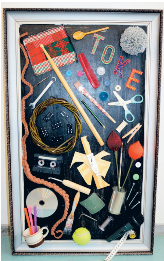
Toke-työ löytää paikkansa token seinältä. Siinä kuvataan oivallisesti, mitä kaikkea toimintakeskuksen päivät pitävät sisällään!

sissa on kukkia – vaikka miehet ovatkin tekijöinä – näyttelyn nimeksi tuli ”Antaa kaikkien kukkien kukkia vaan”. Tämä nimi paitsi kuvastaa esillä olevaa taidetta, myös kertoo siitä, että kaikilla on oikeus