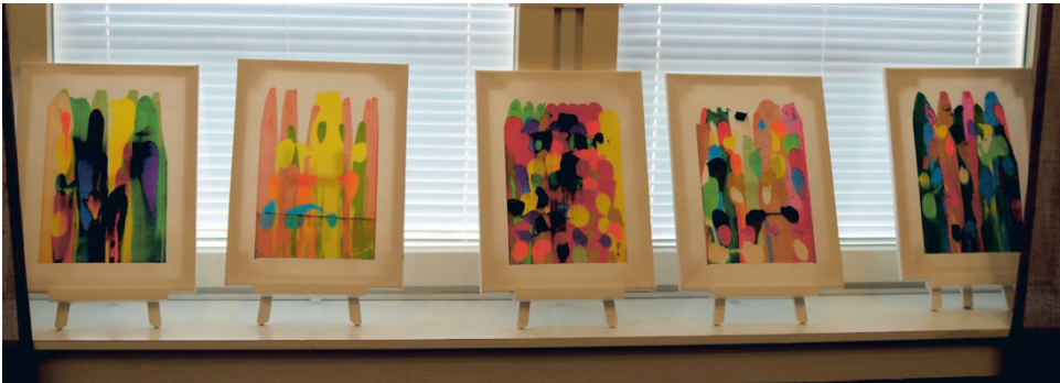
Ikkunalastalla ja akryylinväreillä on saatu aikaan hämmästyttävän hienoja tauluja. Jos nämä teokset tulevat näyttelyn jälkeen myyntiin token myymälään, niin omakseen sellaista haluavan kannattaa pitää kiirettä!