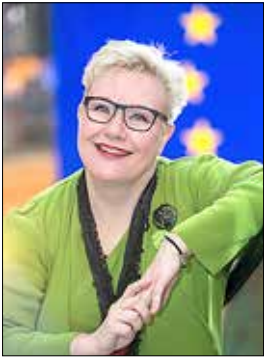
Sirpa Pietikäinen Kirjoittaja on Euroopan parlamentin jäsen. sirpa.pietikainen@europarl.europa.eu