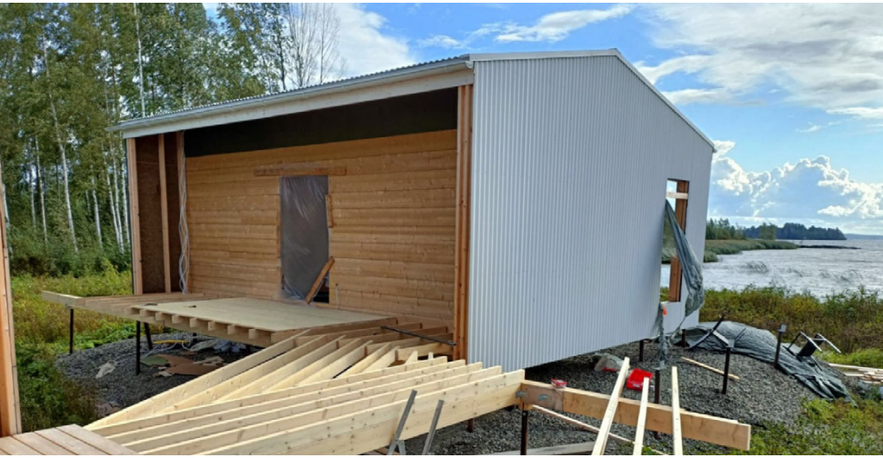
Ovatko purettavat ja siirrettävät rakennukset tulevaisuutta?