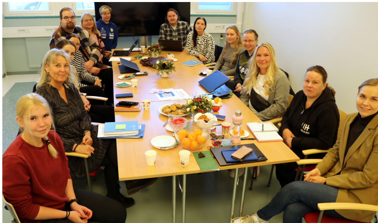
Ready 4 Life on tunnettu laadukkaana messutapahtumana ja tulevia messuja suunnitellaan isolla ja innostuneella porukalla. Jokainen mukana oleva tuo messujen käyttöön oman osaamisensa.