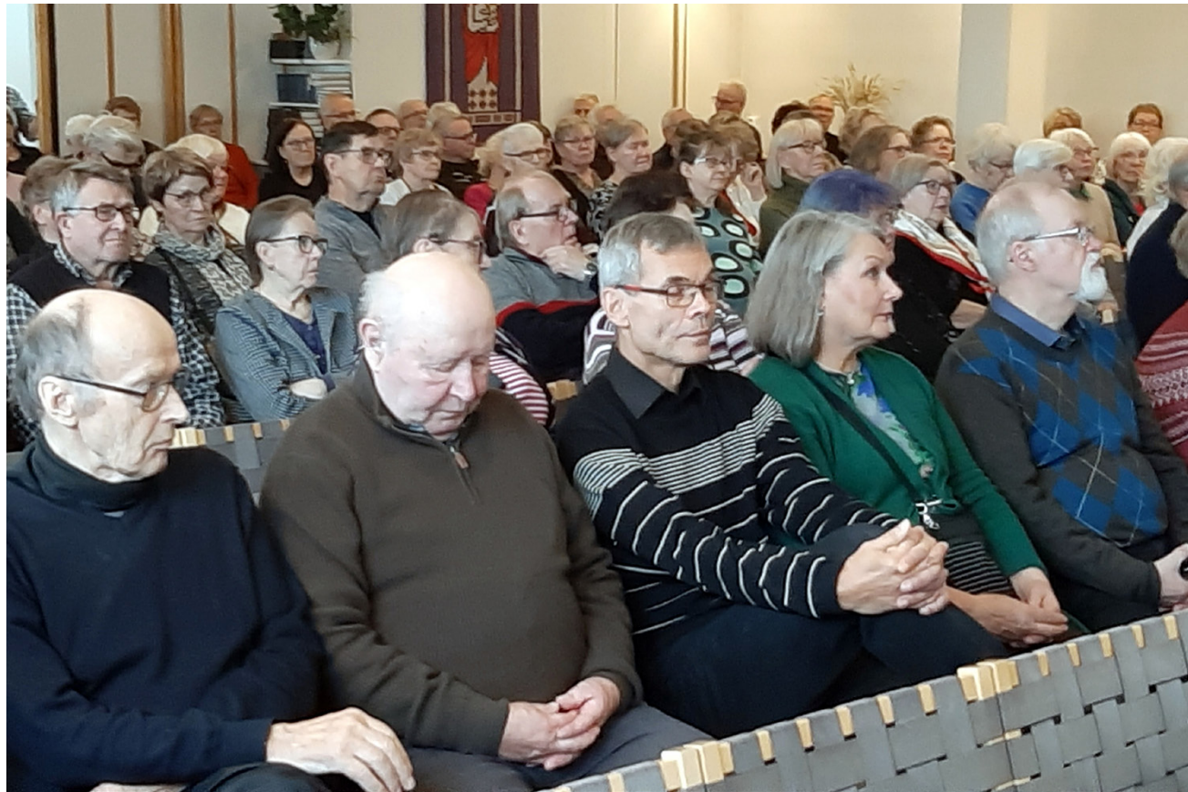
Eläkeliiton Alajärven yhdistyksen syyskokoukseen seurakuntatalolle kokoonnut peräti 190 aktiivista jäsentä.

Urheilulinjan tavoitteena on luoda tavoitteelliselle urheilijalle mahdollisuus yhdistää toisen asteen opinnot ja urheilijan polku, toteuttaa treenit kahdesti viikossa koulupäivän aikaan sekä suunnitella urheilijoiden treniohjelmata yhdessä linjan ja urheilijoiden omien valmentajien kanssa.