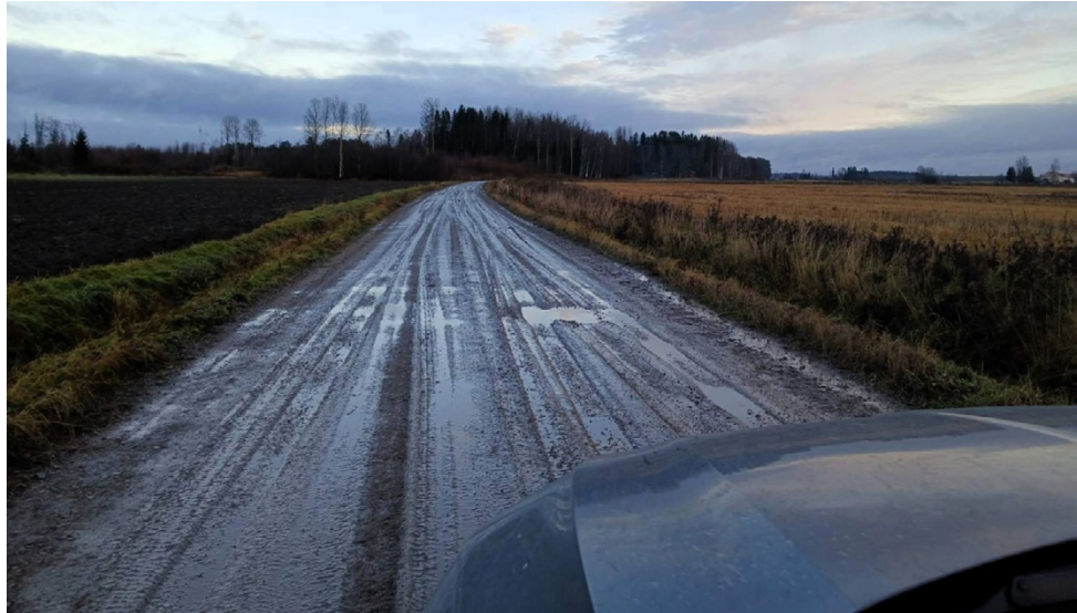
Syksyn pintakelirikko on vaikea hoidettava, koska tien pintakerrokseen on jäätyessään sitoutunut runsaasti vettä, joka sulaessaan rikkoo ja pehmentää soratien pinnan.

tymässä tarvittaessa Jos sää pysyy lämpimänä, kunnossapitourakoitsijat aloittavat kelirikon hoitotoimenpiteet, jotka sisältävät kevyttä lanausta sekä karkean kelirikkomurskeen levittämistä parantamaan tien pintaa. Tienkäyttäjiltä toivotaan malttia ja suositellaan noudattamaan varovaisuutta erityisesti kosteilla ja liukkailla tieosuuksilla, ja mukauttamaan ajonopeutta tien kunnan mukaan.