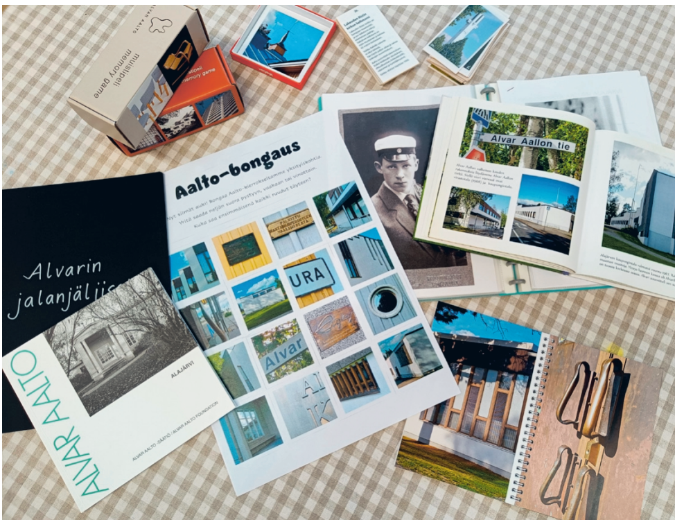
Aalto täyttää Paavolan koulun arjen ja tekee myös arjesta juhlaa.

Koululaiset välittävät myös itse oppimaansa. Alvarin jalanjäljissä -kiertokävelyssä yleisö pääsee kulkemaan arkkitehdin suunnittelemissa rakennuksissa. Kohdetietouden lisäksi mausteena on ohjelma-numeroita, jotka vievät katso-