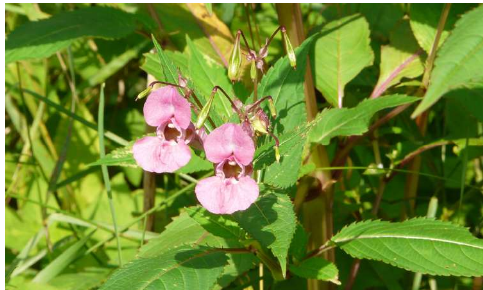
Jättipalsamia ja muita vieraslajeja voi kitkeä vielä heinä-elokuun vaihteen tienoilla.

Luonnonvaraisten lintujen joukkokuolemista ja yksittäisistä kuolleista petolinnuista tulee ilmoittaa kunnan- tai läänineläinlääkärille.