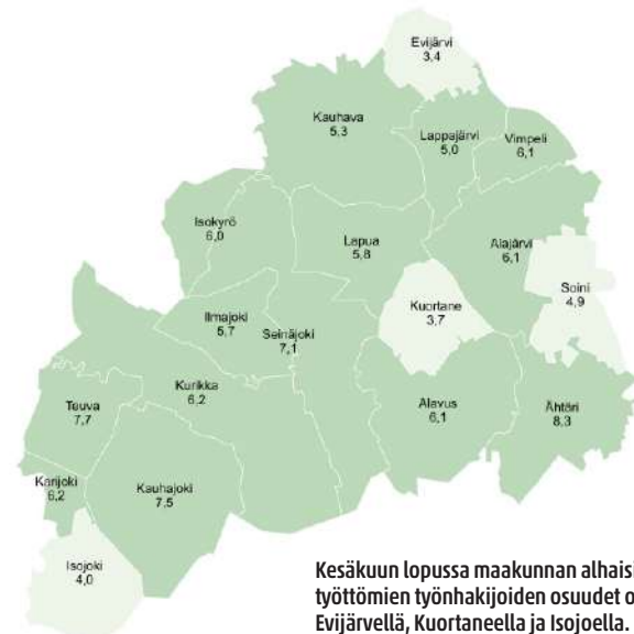
Kesäkuun lopussa maakunnan alhaisimmat työttömien työnhakijoiden osuudet olivat Evijärvellä, Kuortaneella ja Isojoella.