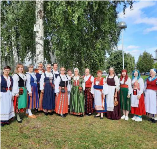
Alajärvellä järjestetään kansallispuvujen tuuletuspiknik tulevana lauantaina. Viime vuonna tapahtuma järjestettiin Alajärvellä ensimmäistä kertaa.

Kansallispuvun syntymäpäivä on 5.8. ja sitä juhlistetaan kansallispuvujen tuuletuspiknikillä eri puolilla Suomea. Merkkipäivä juontaa juurensa Venäjän keisari Aleksanteri III:n ja keisarinna Maria Feodorovnan vierailuun Suomessa. 5.8.1885 keisarinna annettiin