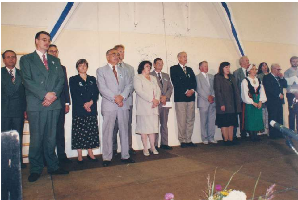
Keisarin sukuseuran toimijoita Karstulan sukujuhlissa vuonna 2002.