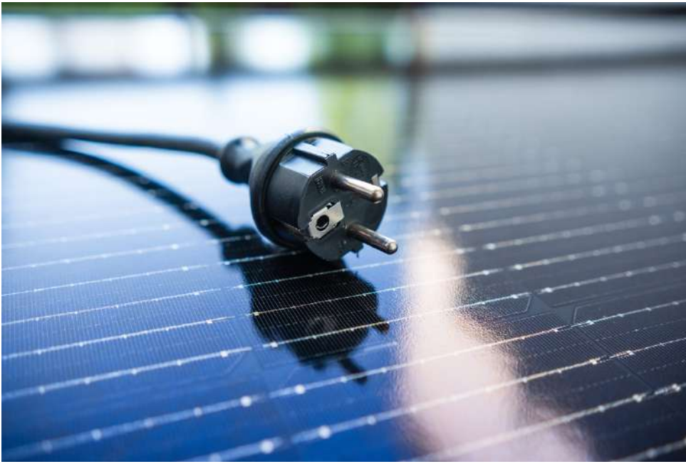
Turvallisuus- ja kemikaalivirasto Tukes kehottaa kuluttajia välttämään pistorasiaan kytkettävien aurinkopaneelien ostamista, sillä tällaisia laitteita ei saa käyttää Suomessa. Kuvituskuva.

Kiinteistöjen sähköverkot on mitoitettu ja rakennettu niin, että sähkö syötetään yleisestä sähköjakeluverkosta jakokeskukselta sähkö-