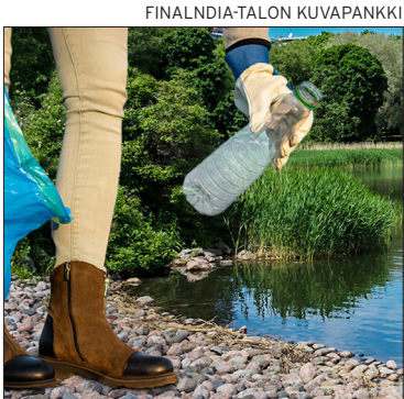
Töölönlahden ympäristöä siivotaan roskista.

Töölönlahti on kaupungin keskeisin ulkoilupaikka, joten alueen