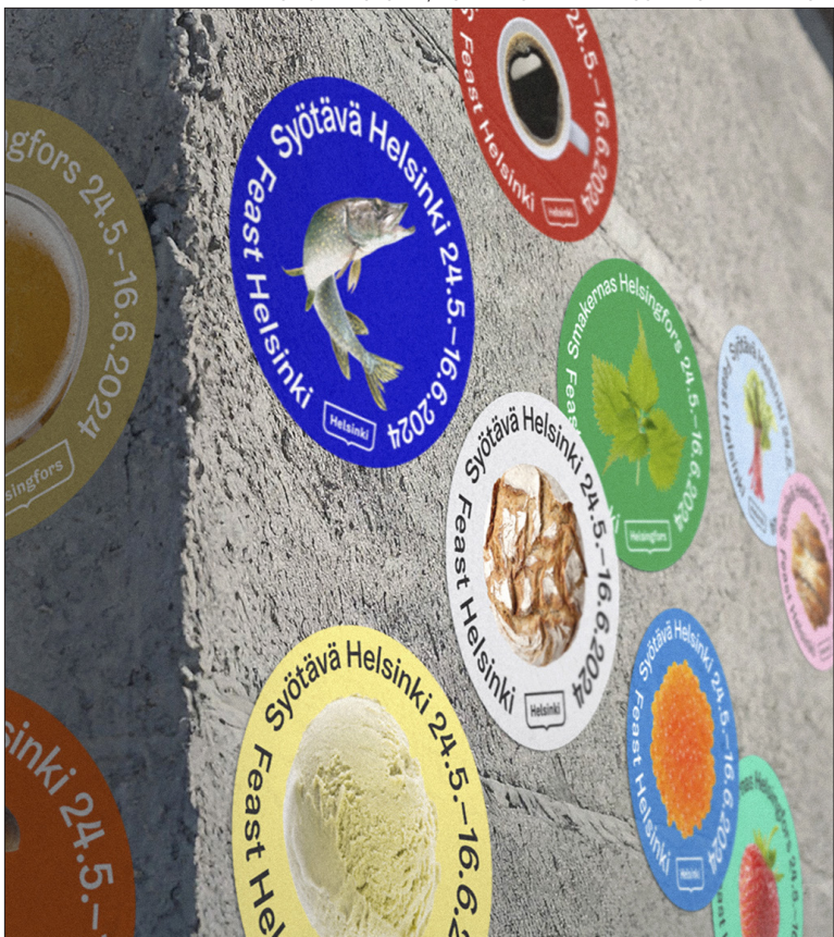
Syötävä Helsinki -tapahtumat tunnistaa helsinkiläisiä makuja kuvaavista tarroista.

RUOKA on tänä vuonna yksi Helsingin matkailun ja tapahtumallisuuden strategisista kärki-