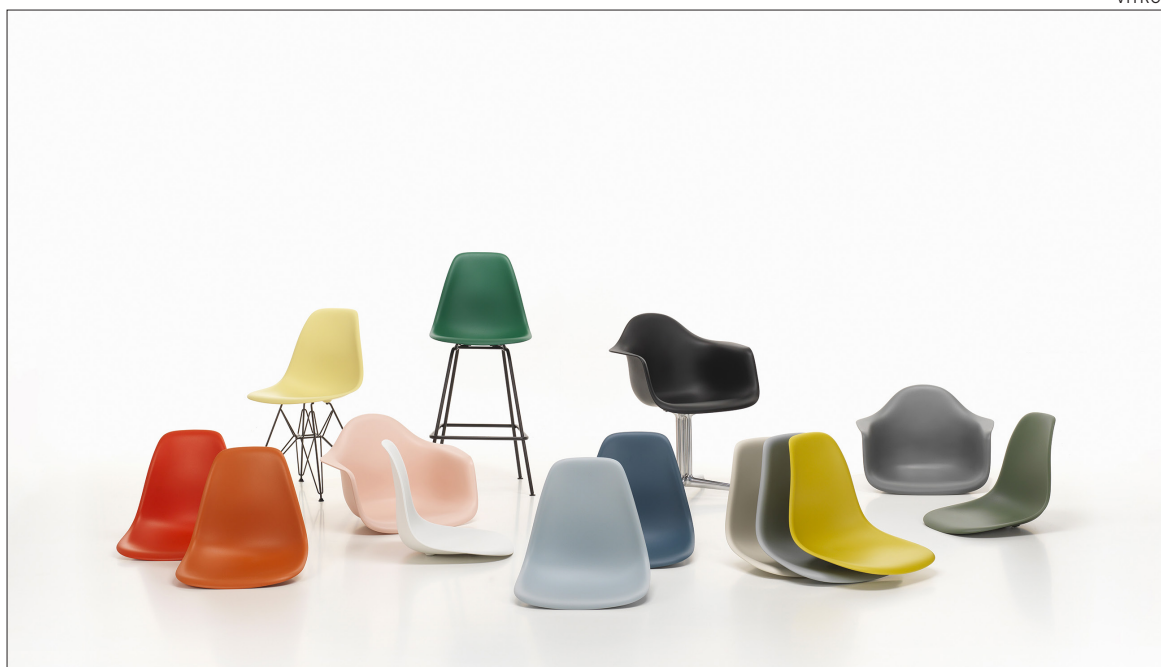
Eames Plastic Chair eli EPC, lukuisissa eri variaatioissaan valmistetaan nyt täysin kotitalouksilta kerätystä kierrätysmuovista.

Muovi on vauhdittanut Vitran nousua yhdeksi maailman johta-