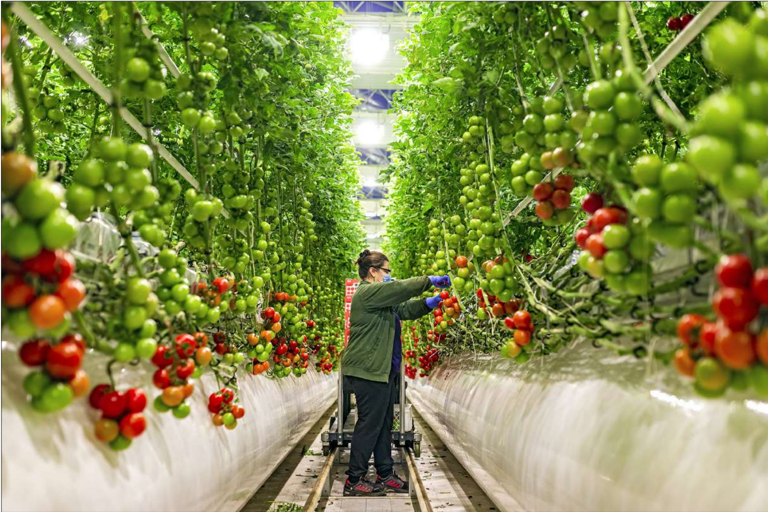
Namsin tomaatit poimitaan terttuineen vasta aivan kypsinä. Näin voidaan luvata makutakuu.

Mitä jos ensi kerralla kokeilisit tomaattien kuningasta Roternoa? Viiden tai kuuden tomaatin tertuissa kasvava punaposkinen