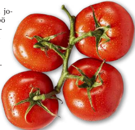
Tomaattien köynnökset ovat kuin powerbankeja.