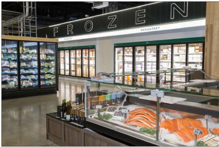
Liha- ja kalatiskiltä löytyy tuoreet raaka-aineet joka lähtöön. Pakastekaapit ovat pullollaan monen sortin mereneläviä.