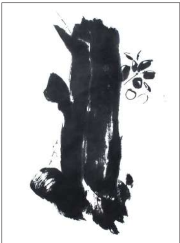
Kirsikan kukat ja luumupuu, 2023, 62 x 41cm.

”Löysin tuolloin itselleni tärkeät työvälineet, siveltimet, hierrin kiven ja tussitangon, josta tussi hierretään. 1990-luvulla Bulevardilla sijaitsi liike, joka myi tussimaalauksen tarvittavia materiaaleja. Myöhemmin ostin tarvikkeet Vallilassa sijainneesta kiinalaisen