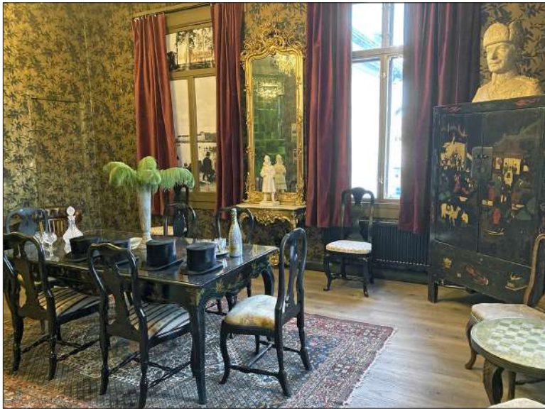
Mannerheim-kabinetissa on monia kiinnostavia yksityiskohtia, kuten tapettiin kätkeytyvä salaovi.

TAMMIKUUSSA 2023 on aika nostella laseja toisen kerran. Aurinkoisena torstaiaamupäivänä asiakkaita alkaa kertyä paikalle jo klo 10 jälkeen, vaikka ravintola avataan vasta klo 11. Pian päästäänkin sisälle ja ihmiset huokailivat ihastuksesta nähdessään valoa tulvivan, vaalein empiresävyin maalatun rotundasalin viherkasveineen. Asiakkaita valuu tasaisena virtana sisään ja pian kakkuvitriinin ääreen on jo pitkä jono. Jututtaessani ihmisiä paljastuu, että monella on henkilökohtainen suhde ravintolaan aiemmilta vuosilta.