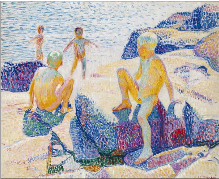
Esillä oleva näyttely, Väriä & valoa - impressionismin perintö, esittelee impressionistista ja uusimpressionistista taidetta ajanjaksolta 1860-1916. Kuvassa Verner Thomén teos Kylpeviä poikia (1910).

”Kiinnostus taiteen maailmaa kohtaan herää usein jo kouluikässä. Mekin Ateneumissa panostamme paljon lapsiin ja nuoriin.