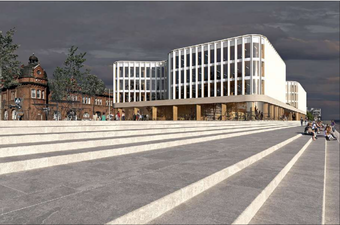
Katajannokan Laituri valmistuu nimensä mukaisesti Katajanokalle.