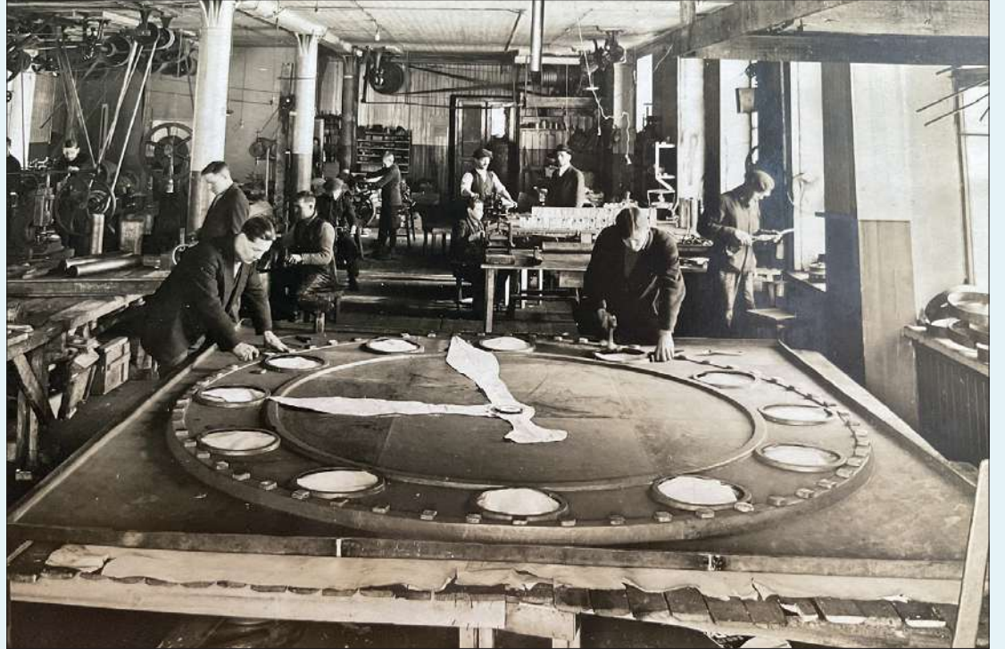
Urhon Hakaniemenkujan tehdashallissa valmistui mm. Rautatieaseman suuret kellot.