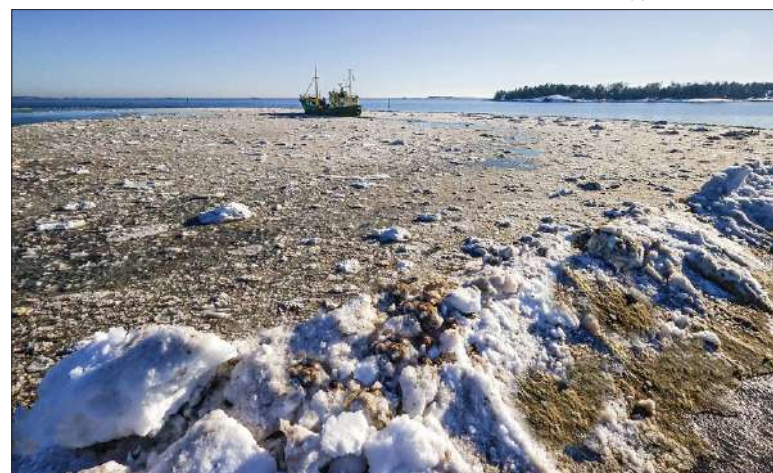
Helsinki hakee tällä hetkellä ympäristölupaan jatkaakseen lumenkaatoa mereen.

Hiilidioksidipäästöjä seurataan maailmalaajuisesti, mutta Itämeri ei tunnu olevan kaupungille yhtä arvokas. Kuitenkin kaupunki kertoo osallistuvansa Itämeren suojeleluun. Haluaisin nähdä konkreettisia toimenpiteitä. Suojelutyöhön