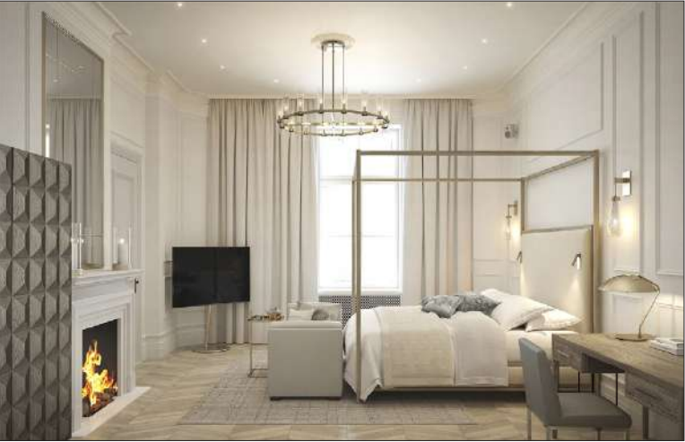
The Hotel Maria erottautuu Helsingin hotellitarjonnasta suurilla huoneilla, sviittien määrällä (40 kpl) ja kylpyhuoneisiin sijoitetuilla saunoilla, höyryhuoneilla ja kylpyammeilla.