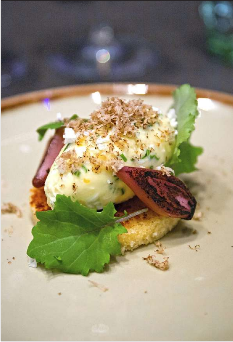
Alkuvuoden premiumtuote on talvitryffeli. Siitä on tarjolla kaksi annosta, alku- ja pääruoka. Tryffelitoast ja munavoi ovat kuin karjalanpiirakan moderni versio.