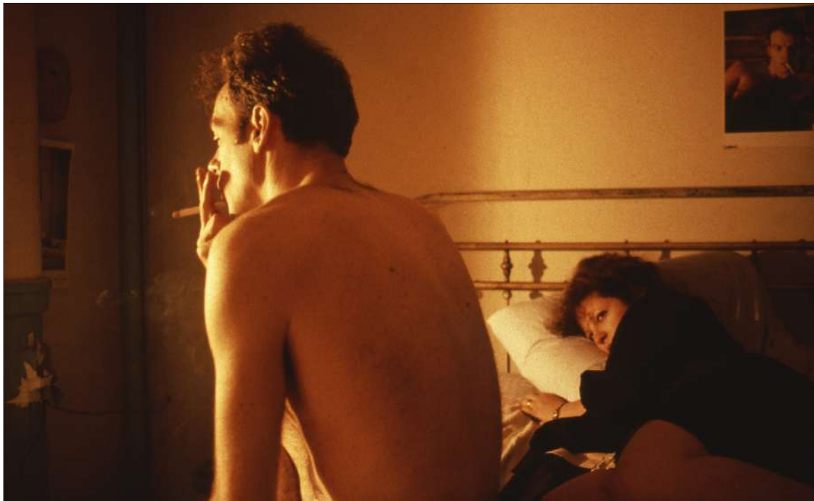
Laura Poitrasin Venetsian elokuvajuhlien pääpalkinnon voittaneen All the Beauty and Bloodshed Suomen ensi-ilta on festivaalin ohjelmassa.

DOCPOINT / HELSINGIN DOKUMENTTIELOKUVAFESTIVAALI