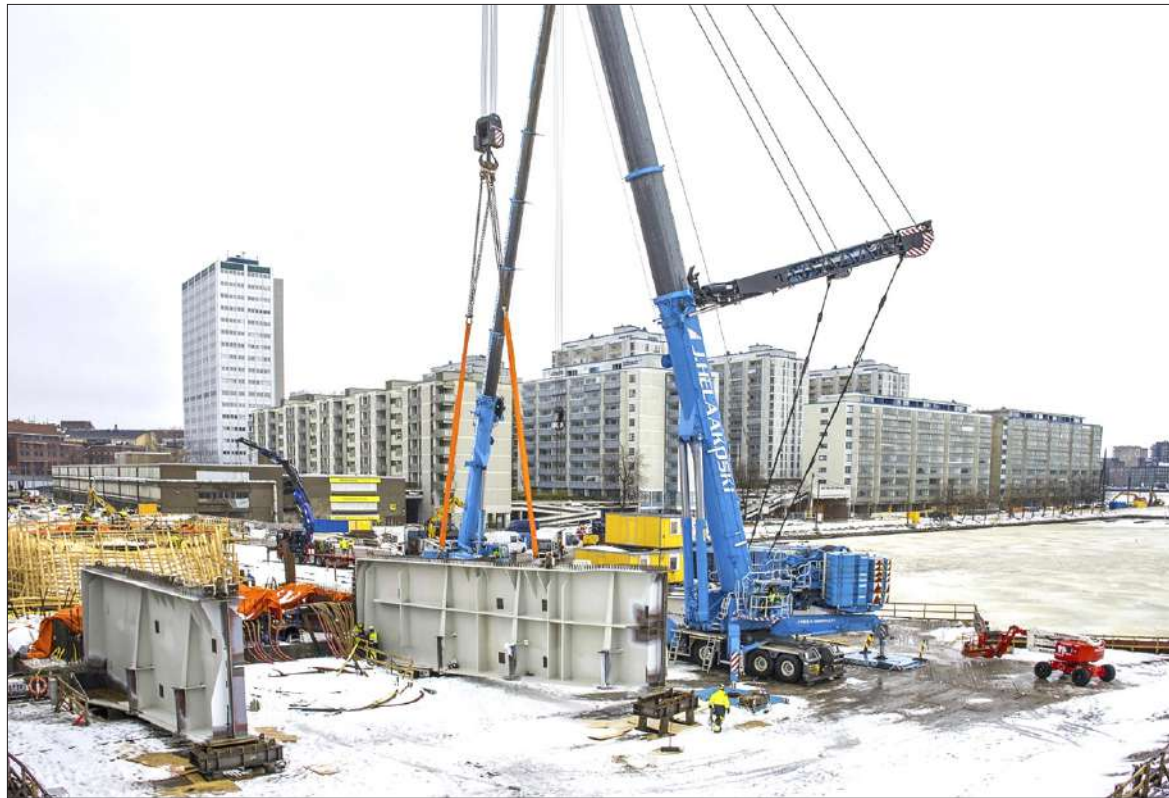
Ensimmäinen teräsosa (vas.) saatiin nostettua paikalleen jo tiistaina 10.1. Tuulen yltyminen vuoksi toinen palkki nostettiin vasta seuraavana päivänä.

Nostojen tarkkailu on mahdollista myös sillalta käsin, joskaan se ei ole suositeltavaa, koska Hakaniemensillan toinen puoli on