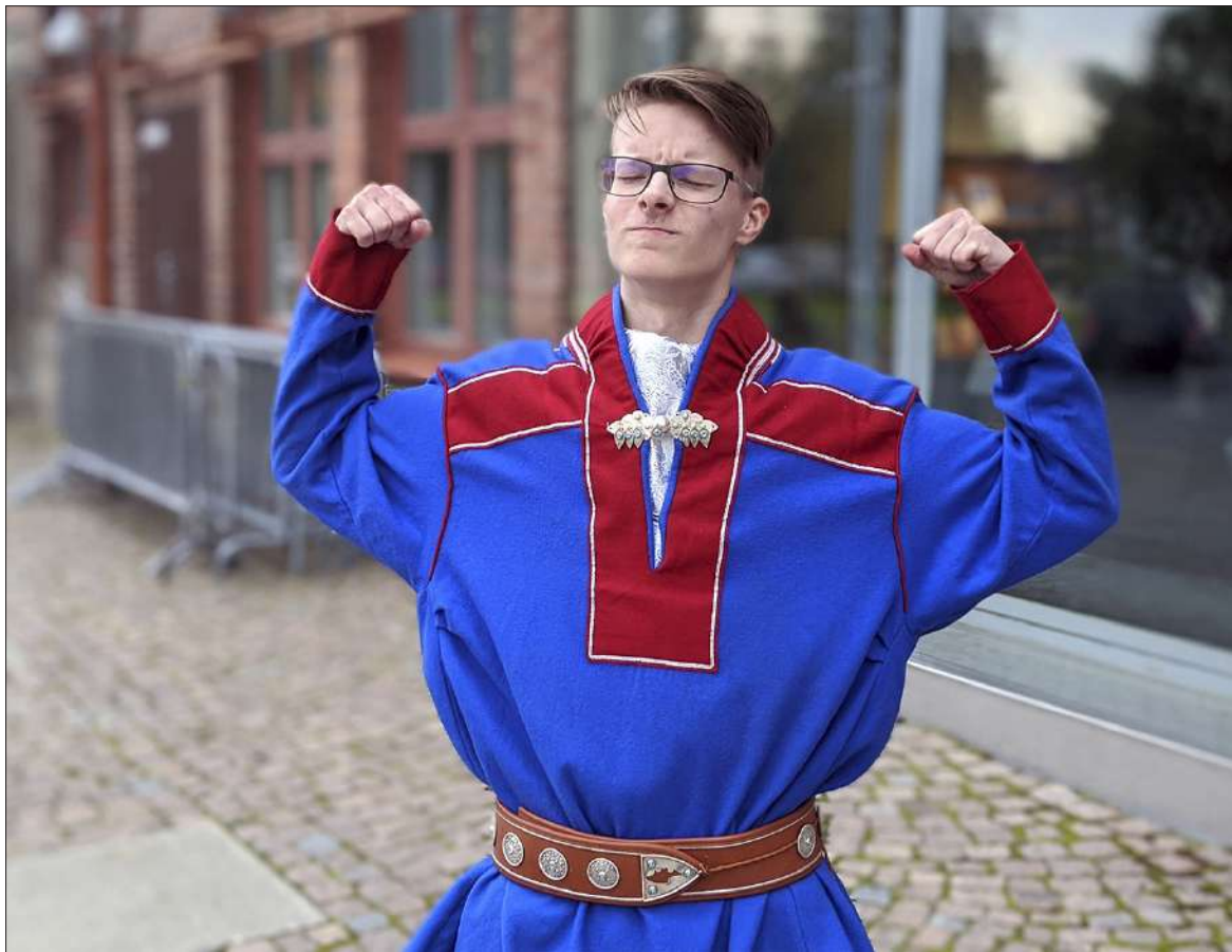
Musiikkiteemaisen ohjelmiston avaa saamelaisräppäri Yungmiqusta kertova Revontulten räppäri.

DOCPOINT / HELSINGIN DOKUMENTTIELOKUVAFESTIVAALI