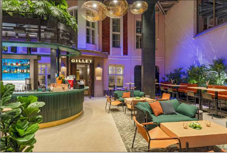
Lasipihan paikalla oli vielä muutama vuosi sitten parkkipaikka. Remontin myötä tila katettiin. Sisääntulijaa tervehtii näyttävän kokoinen baaritiski.

”Gilletissä ollaan vahvasti trendien äärellä.