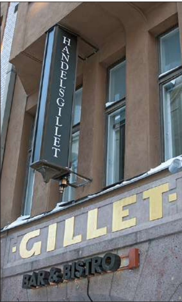
Vuodesta 1924 julkisivussa on lukenut sana Gillet. Talossa toimii myös suomenruotsalainen kauppiaskilta Handelsgillet ry.

binettia pienempiä tilaisuuksia tai kaveriporukoita varten.