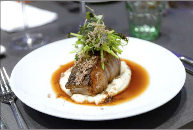
Pääruoksi tarjoiltava turskanseläke, merirapuliemi ja talvitryffeli muodostavat trendikkään, umamipitoisen annoksen.

Gillet on Ravintolakolmio-konserniin kuuluvista ravintoloista