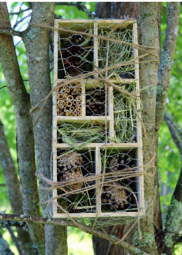
Hyönteishotellit sijaitsevat puiden katveessa.