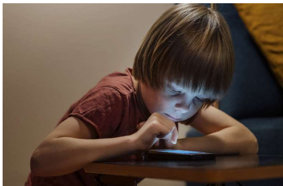
Lasten likinäköisyys on kasvanut voimakkaasti mm. vähentyneen ulkoilun ja lisääntyneen ruutuaajan seurauksena.

lapsen keskittymis- ja oppimisvaikeudet koulussa, päänsärky