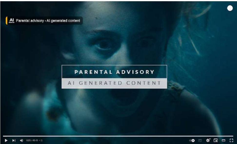
Mannerheimin Lastensuojeluliitto ehdottaa Parental Advisory -leiman tavalla toimivaa tunnusta, joka auttaa tunnistamaan tekoälyllä tehdyt sisällöt.

Todellisuutta on yhä vaikeampi tunnistaa Tekoälyn selittäminen lapsil-