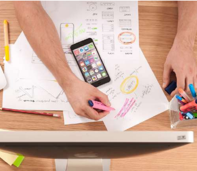
Ideasta bisnestä -kiertue vieraillee jokaisessa Järvi-Pohjanmaan kunnassa tuomassa tietoa ja innostamassa liikeidean kehittäjiä.

Kiertue järjestetään osana JPYP:n hallinnoimaa Liiketoimintaa uudessa normaalissa –hanketta.