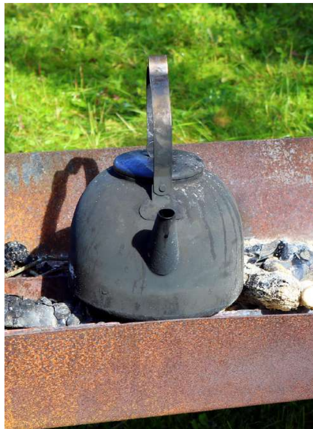
Vieraille oli perinnepäivässä tarjolla muun muassa nokipannukahvia.

kannalta, mutta yhtä lailla kotona voi hyönteisiä ajatellessaan jättää pihaan pientä risukasaa tai tehdä avokompostia puutarhajätteistä.