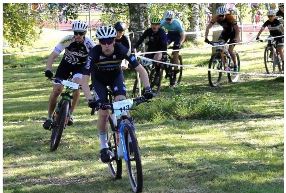
Alajärvi MTB pyöräillään jo viidennen kerran.

Sarjoja tapahtumasta löytyy niin kilpailijoille, kuntoilijoille kuin junioreillekin. Kilpasarjoissa matkana on 50 kilometriä, junioreissa 18 ja kuntosarjoissa matkan voi valita 18, 35 tai 50 kilometrin väliltä.