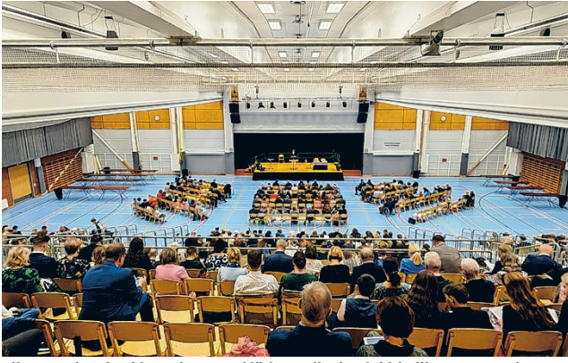
Viime syyskauden kierroskonventti järjestettiin Ilmajoki-hallissa.

Konventin teema perustuu Johanneksen 4:24:stä löytyviin Jeesuksen sanoihin. Tilaisuudessa valaistaan sitä, mitä Jee-