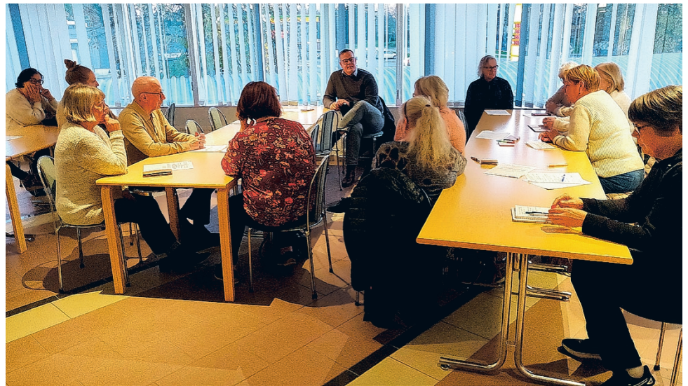
Lehtimäellä järjestetyssä tilaisuudessa keskusteltiin SPR:n Lehtimäen osaston mahdollisesta yhdistymisestä Alajärven osastoon. Paikalla vallitsi myönteinen ja yhteistyöhenkinen ilmapiiri.

Yhdistymisen tavoitteena on ennen kaikkea hallinnon keventäminen, jotta toimivien jäsenten aika voidaan suunnata varsinaiseen toimintaan. Lehtimäellä ei siis olla lopettamassa SPR:n toimintaa – päinvastoin. Yhdistyminen mahdollistaa sen, ettei omaa hallitusta enää tarvittaisi. Se taas voisi madaltaa kynnystä uusien aktiivien mukaantulolle ja va-