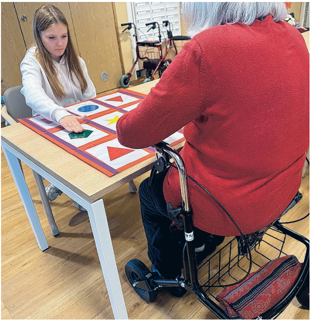
Yhteinen tekeminen innostaa molempia: lapsi ja ikäihminen ratkovat tehtävää keskittyneesti Ahkerat Aivot® -menetelmän hengessä.

ja ajattelu tukevat toisiaan: fyysinen toiminta aktivoi hermostoa ja vahvistaa muistia ja tarkkaavaisuutta. Ahkerat Aivot® -harjoitteet pohjautuvat tähän tutkimustietoon, mutta tuovat siihen käytännöllisen, selkeästi rakennettun ja monipuolisen kokonaisuuden.