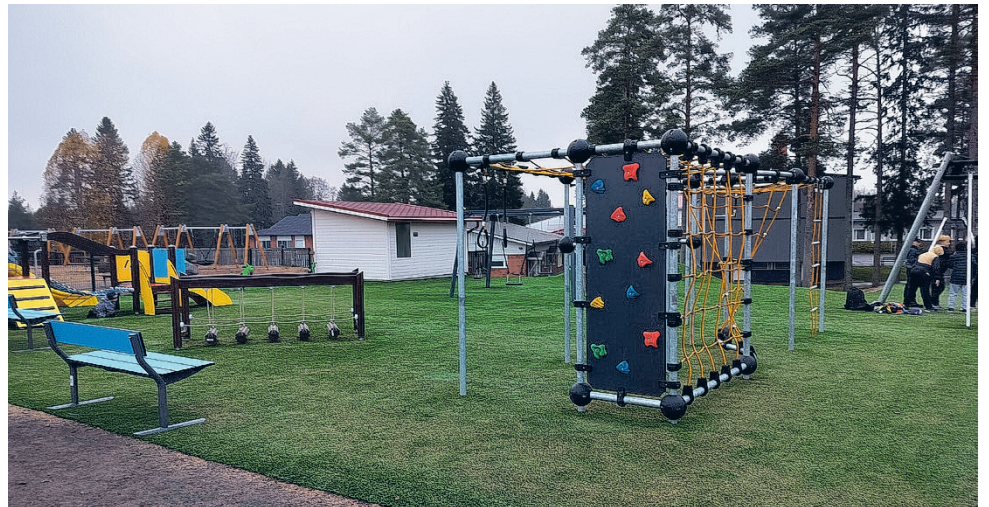
Lasten toiveista syntynyt uusi leikkialue on rakennettu tekonurmelle, joka tekee pihasta turvallisen ja viihtyisän myös syysällä.

Lasten ideat muovasivat alueen Leikkialueen suunnittelus-