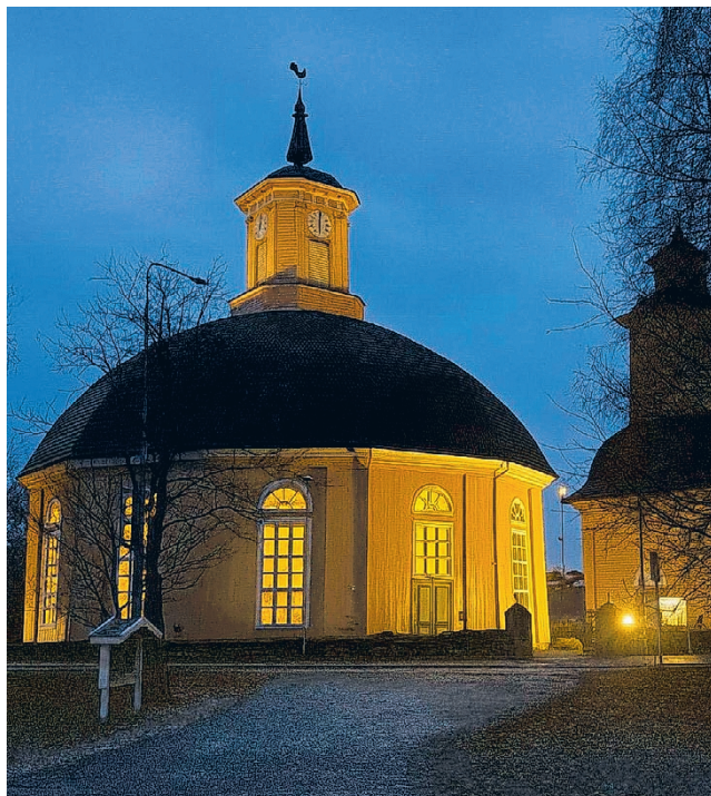
Pyhäinpäivän aattona, perjantaina 31. lokakuuta kello 19, vietetään perinteistä Toivon ja lohdun musiikki-iltaa, tällä kertaa Vimpelin kirkossa.

Monipuolinen ohjelma on kaunis ja koskettava: yksinlauluja, tyttökuoron lauluja, duettoja ja runonlausuntaa. Säestyssoittimina ovat piano, urut, sello ja huilu. Mukana on monille tuttuja hartaita lauluja, kuten Tuonne, tuonne kai-