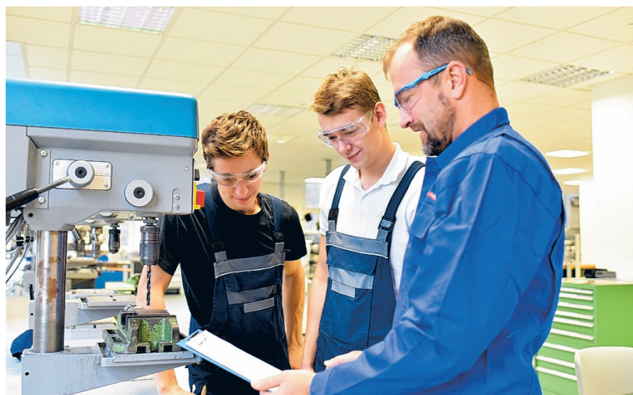
Toiminnanohjauksen kokeilu on osa hallitusohjelman mukaista ammatillisen koulutuksen uudistamista. Kuvituskuva.

Osana toiminnanohjauksen uudistamista ministeriö syventää vuoropuhelua kaikkien ammatillisen koulutuksen järjestäjien kanssa.