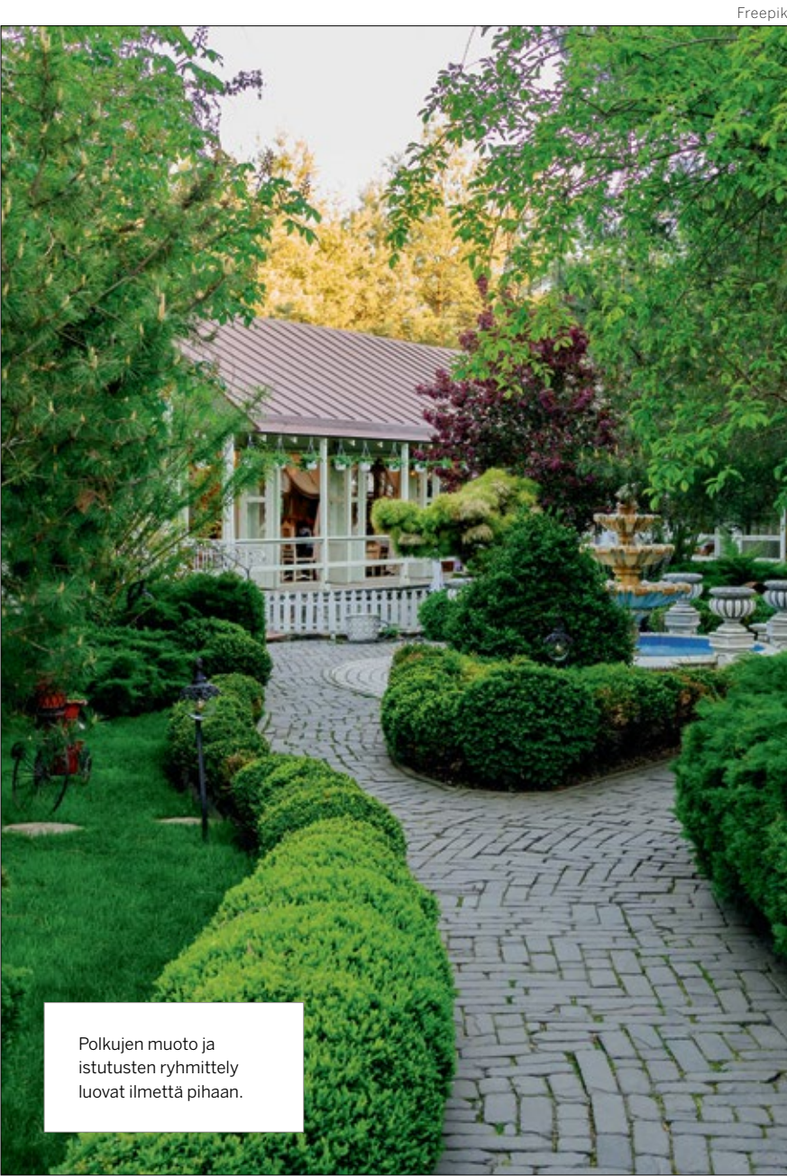
Polkujen muoto ja istutusten ryhmittely luovat ilmettä pihaan.

nitella pihansa kokonaan itse, pohjustamiseen tarvitaan asian- tuntijan apua ja neuvoja. Esimerkiksi pintavesien suuntaamiseen on olemassa hyviä keinoja, kuten maan kallistuksia, kouruja ynnä muuta, mutta niitä on vaikea suunnitella ja toteuttaa ilman ammat- tilaista. Pohjustuksen yhteydessä luodaan muun muassa tarvitta- vat profiloinnit ja mahdolliset salaojat. Sen jälkeen pihakiveyksen alla olevat routivat maalajit, kuten savi, turve ja hiesu, pitäisi kor- vata vettä läpäisevällä aineksella kuten hiekalla tai soralla ainakin 40 senttimetrin vahvuudelta, ja sen jälkeen tiivistää uusi routima- ton kerros kovaksi. Pohjan rakentaminen on siis monivaiheinen työ, mutta siitä ei kannata tinkiä – jos pohja pettää, pettää kaikki sen päällä oleva saman tien.