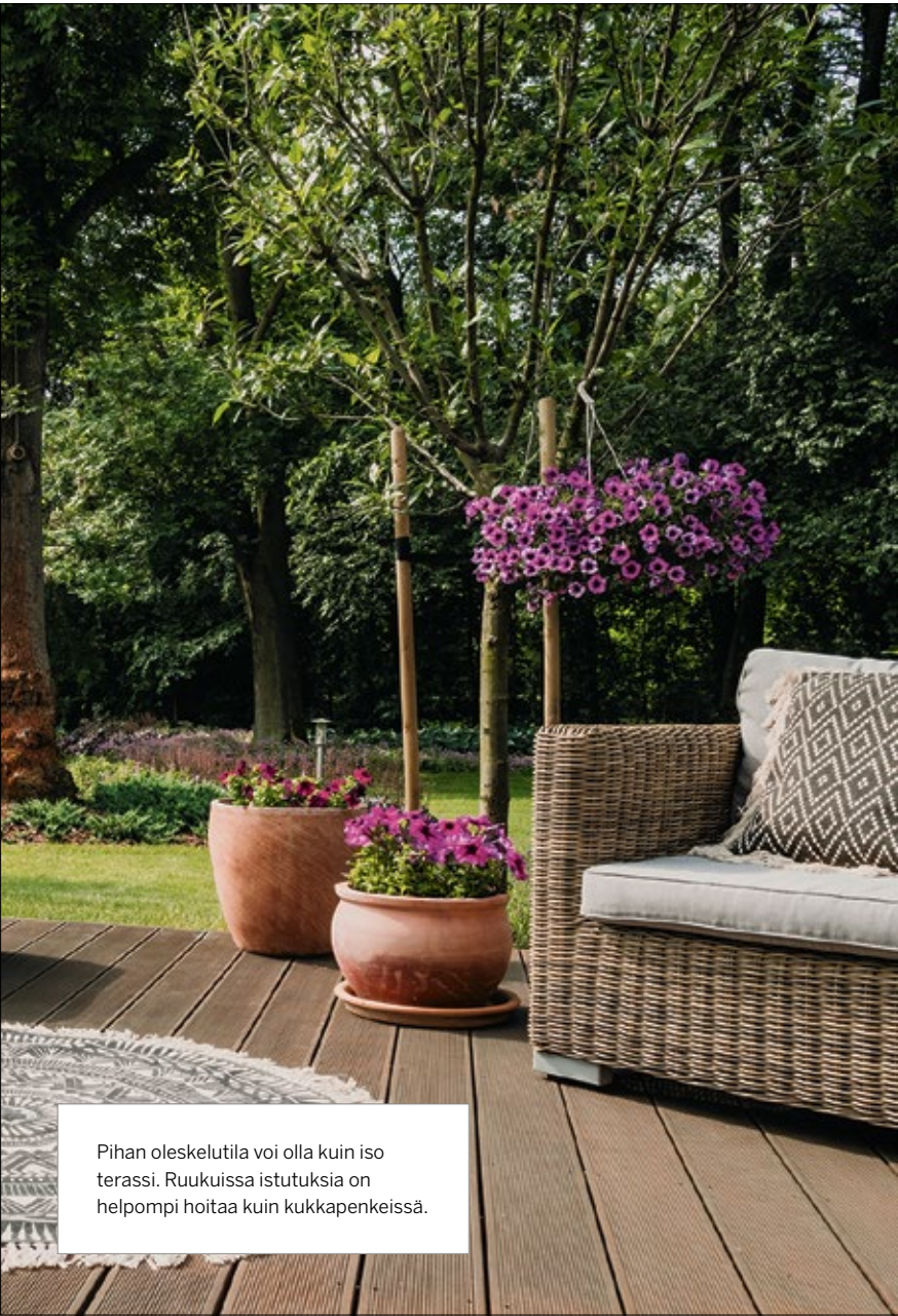
Pihan oleskelutila voi olla kuin iso terassi. Ruukuissa istutuksia on helpompi hoitaa kuin kukkapenkeissä.

Sovelluksia on mahdollista käyttää pihasuunnittelussa myös omatoimisesti.