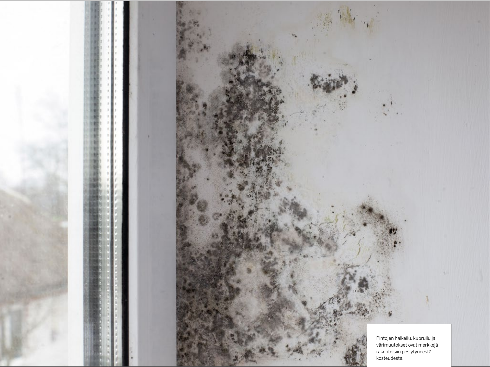
Pintojen halkeilu, kupruilu ja värimuutokset ovat merkkejä rakenteisiin pesiytyneestä kosteudesta.