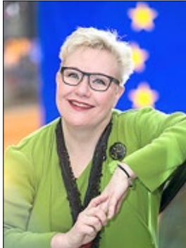
Sirpa Pietikäinen Kirjoittaja on Euroopan parlamentin jäsen sirpa.pietikainen@europarl.europa.eu

Haluamme varmasti kaikki tuntea olomme turvalliseksi kotonamme. Siksi myös rakennusmateriaaleja valittaessa turvallisuus on ensisijaista. Rakentamisessa turvallisuus käsitetään yleensä kestävyydellä, luotettavuudella tai esimerkiksi paloturvallisuudella.