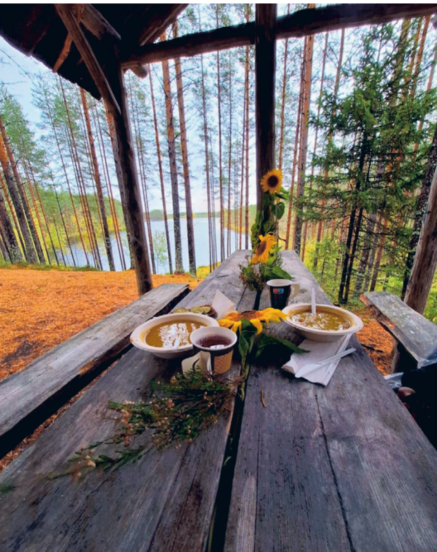
Patikan päätepisteessä, Kaihiharjun kauniissa maisemissa, oli odottamassa maastoruokailu.

Paikallisen Peuran Liikenteen bussit kuljettivat patikoijia