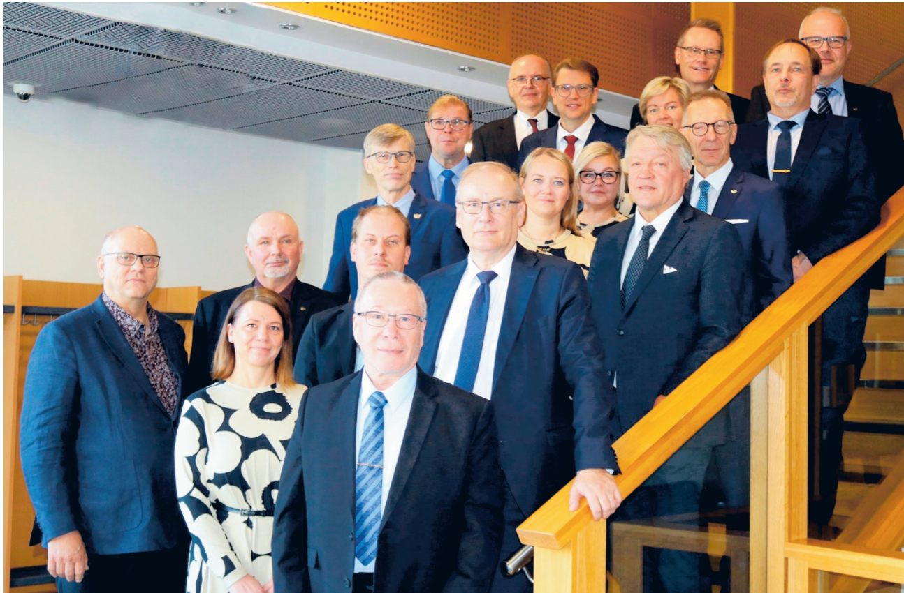
Kuuden osuuspankin edustajat allekirjoittivat viime perjantaina yhdistymissuunnitelman asiakirjat. Uuden OP Järvi-Pohjanmaan pääkonttori tulee Alavudelle, mutta kaikki yhdeksän konttoria jatkavat yhdistymisestä huolimatta toistaiseksi. Lopullinen päätös yhdistymisestä tehdään joulukuussa.

Yhteisillä voimavaroilla pankit pystyisivät tehokkaam-