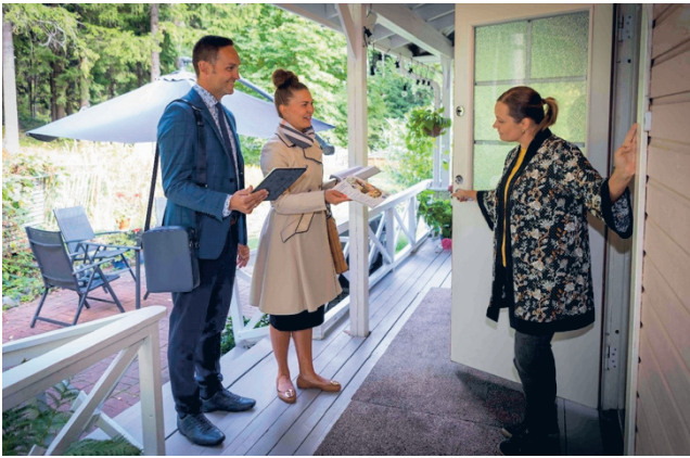
Suomessa ilmaisia raamattukursseja tarjoaa noin 18000 Jehovan todistajaa.

– Syyskuussa 2022 järjestimme samanlaisen kampan-