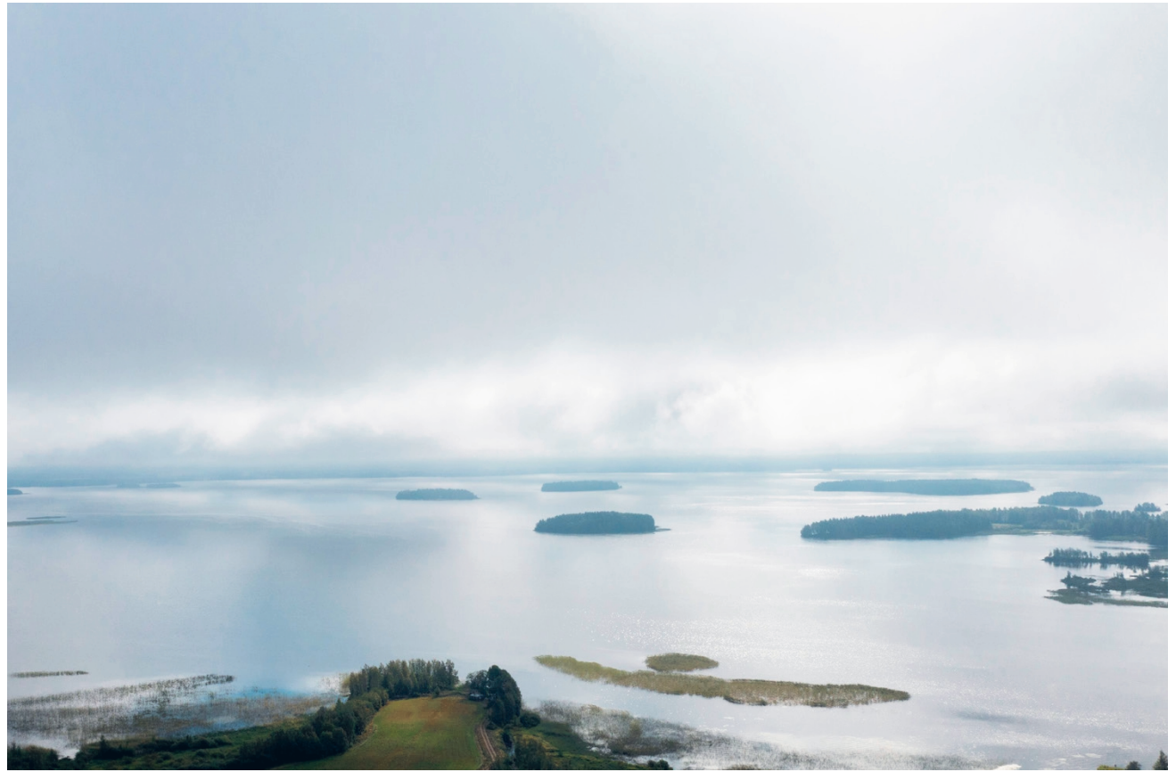
Kraatterijärvi Geopark on lanseerannut valokuvakilpailun teemalla "Maiseman merkitys meille".