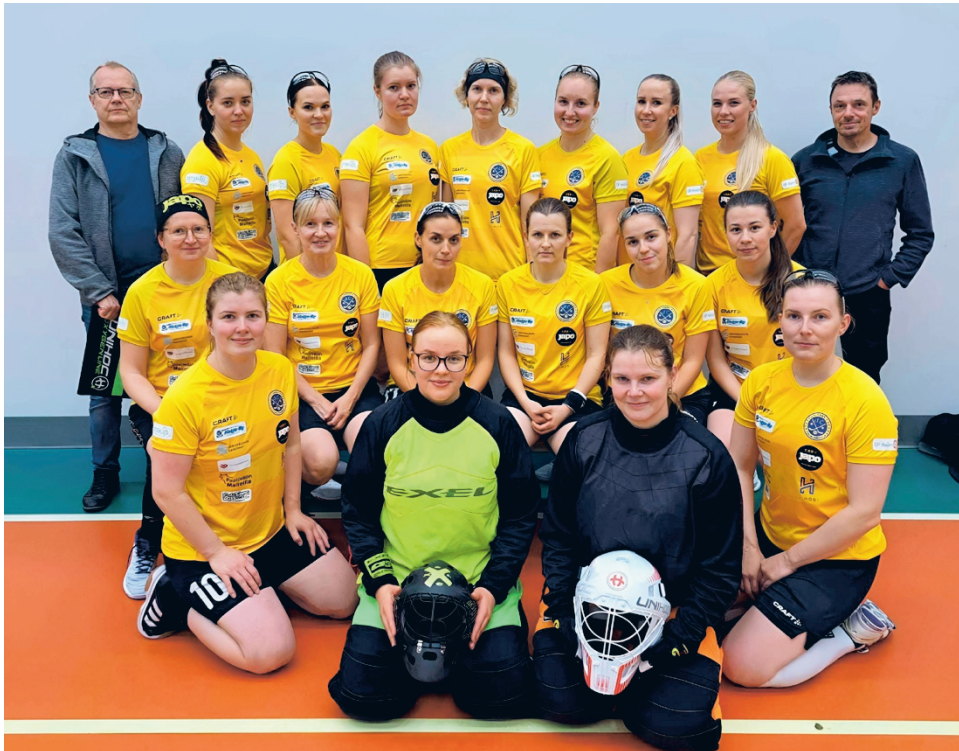
S.C. Alajärven naiset ovat valmiina alkavaan sarjakauteen kakkosdivisioonassa.

– On mielenkiintoista ja mukavaa lähteä uuteen sarjaan ja nähdä, mikä siellä on taso. Sarjassa on nyt kolme uutta joukkuetta, kun Va-