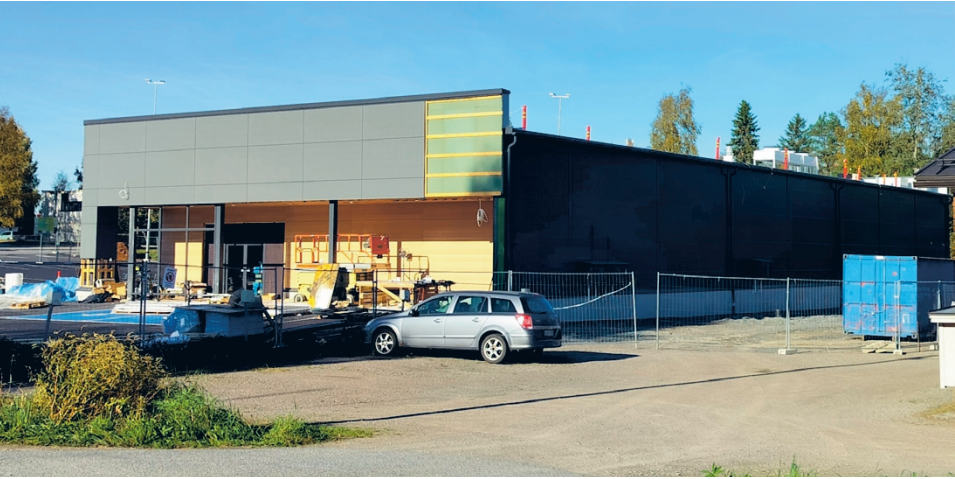
Lehtimäen uusi Sale on valmistumassa vinhaa vauhtia, sillä avajaisia vietetään jo 10.10. kello 10!

Etelä-Pohjanmawan Osuus-kauppa, Eepeen, rakennuttama täysin uusi Sale Lehtimäki avataan supertilipäivänä 10.10. kello 10. - Uuden kaupan avajaisia on jo kovasti odotettu. Lehtimäen henkilökunta on rakentamisen ajan työskennellyt Eepeen lähialueen marketeissa ja nyt kaikki odottavat innolla omaan kauppaan töihin palaamista ja tuttujen asiakkaiden kohtaamista, kertoo myymäläpäällikkö Aili Halla-aho . - On todella hienoa olla avaamassa Lehtimäelle uutta uusien upeiden valikoimien Salea. Saamme myymälään muun muassa paistopisteen. Odotamme innolla, miten asiakkaamme ottavat uuden kaupan vastaan, kertoo ryhmäpäällikkö Mari Humppi . - Uuden Sale Lehtimäen rakentamisen ajaksi Eepee järjesti lehtimäkeläisille asiakkailleen kauppakuljetuksia Alajärven keskustaan yhteistyössä Härmän Liikenteen kanssa. Nämä kuljetukset olivat suosittuja, kertoo toimialajohtaja Iina Kalliorinne. Sale Lehtimäellä on suunniteltu ja toteutettu energiatehokkuus ja vastuullisuus pit-