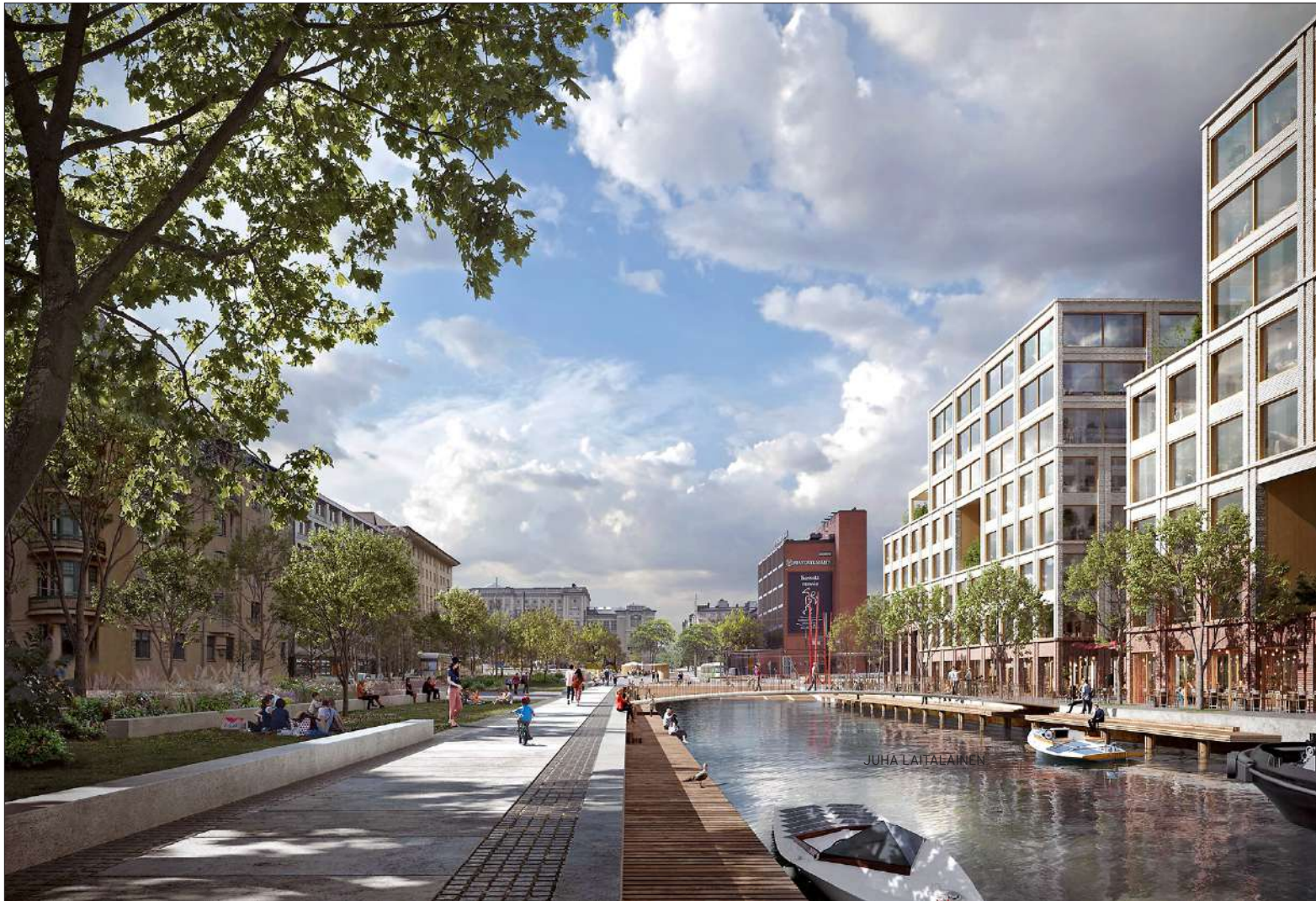
Havainnekuva Hietalahden altaan reunalta Bulevardin suuntaan suunnilleen nykyisen Merimakasiinin kohdalla. Suunnitelmia on muutettu tämän kuvan laatimisen jälkeen.

”Hietalahdentorin kehittäminen on yksi osa kokonaisuutta. Torin perusparannushanketta viitellään ja siihen liittyen kuullaan