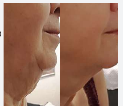
Ennen ja jälkeen yhden hoitokokonaisuuden jälkeen