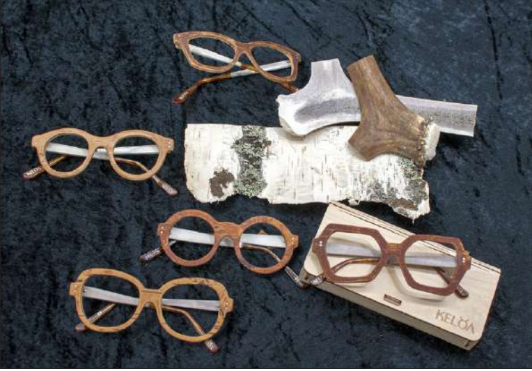
Kehyksen etuosaan Knuuti käyttää tuohta kerroksittain viilutettuna, mikä tukevoittaa kehystä.

”Mitä kauemmin ihmisillä on kehyksiäni käytössä, sitä enemmän saan varmasti kuulla, miltä