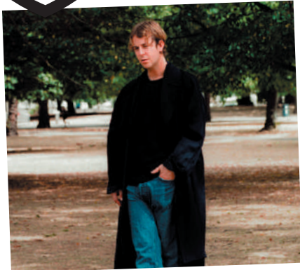
TOM ODELL UK