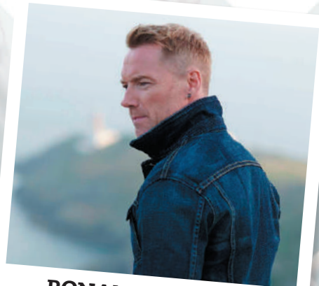
RONAN KEATING IE