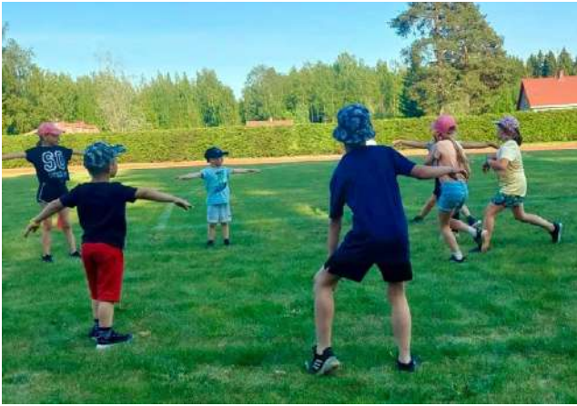
Urheilukoulussa lapsilla on kivaa! Jyske tarjoaa tämän mahdollisuuden lapsille täysin maksutta!

– Suositukset lasten liikku- miselle ovat olleet nyt ajan- kohtaisia yhteiskunnallisessa