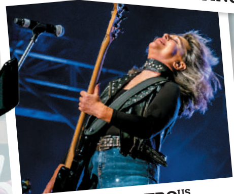
SUZI QUATRO US