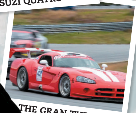
THE GRAN TURISMO