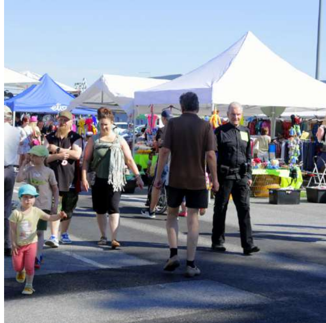
Markkinamyymien luoma tunnelma ja tuttu tapaaminen on se ykkösjuuttu monille Rokulipäiville saapuville! Kuva kesän 2022 Rokulipäiviltä.

Musiikillinen ilta huipentuu kello 19 alkavaan Mikko Harjun ilmaiskonserttiin. Harju on tullut tutuksi muun muassa platinalevyt saavutta-neista singleistään ”Mä olen