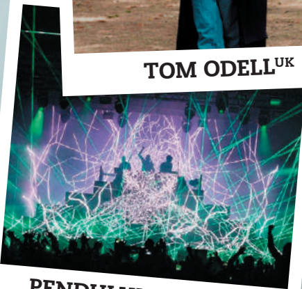
PENDULUM DJ SET UK