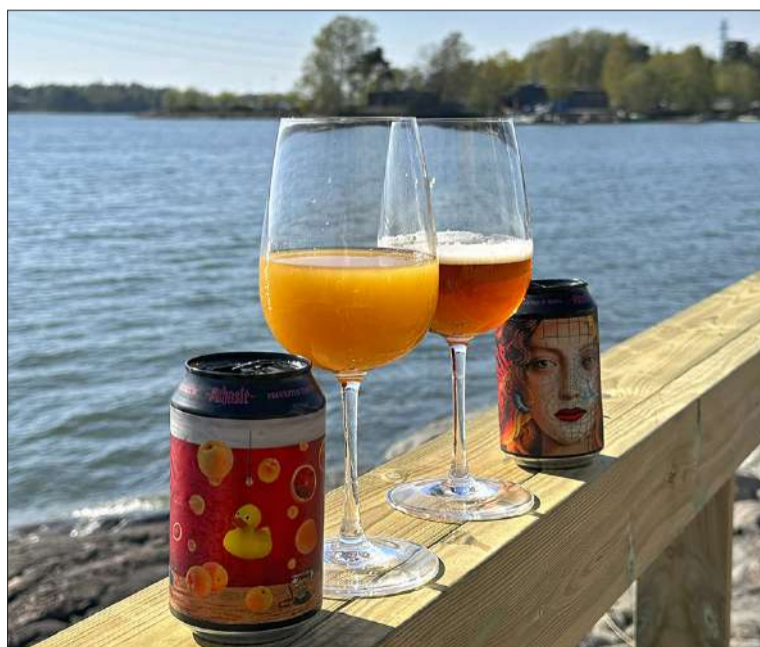
Taivallahden rannan terassilla tai rantakalliolla voi nauttia kesästä ja virvokkeista. Tartolaisen Pühasten juomat ovat maukkaita ja näyttävästi pakattuja.

lemme kattavan läpileikkauksen Marionin musiikista, jota iskelmä-tähti on tehnyt kahdeksalla vuosikymmenellä. Biisien lomassa hän kertoo myös tarinoita elämästään. ”El Bimbo oli vain mies, niin villi