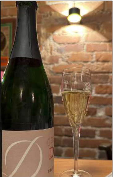
Ravintola Zinnkeller on liputtanut saksalaisviinien puolesta jo vuodesta 1980 lähtien. Aterian voi aloittaa Dössin maukkaasti kuplivalla Rieslingillä.

99-VUOTIASTA Kosmosta jos ketään voi kutsua todelliseksi ravintolaklassikoksi, jossa elämä soljuu valkoisten pöytälinojen äärellä mitä mukavimmin. Pittoreskissa, ja kodikkaassa ravintolasalissa nautitaan helsinkiläisestä ruoasta, jossa on paljon vaikutteita niin idästä kuin lännestä. Rieslingviikoilla Kosmos tarjoilee kolmen ruokalajin menun, jonka kullekin annokselle esitellään suositusviini. Rings on phalzilainen pientuottaja, jonka erinomaista Kallstadter Steinacker Riesling Trockenin hyvältä viinivuodelta 2018 maistelimme pääruoan kera. Maittakoon, että Kosmos järjestää tiistaina 23.5. Rings Tastingin, jossa voi antautua neljän hyvän viinin vietäväksi. Ringsin viinitarhassa rypäleet kasvavat karussa kalkki-