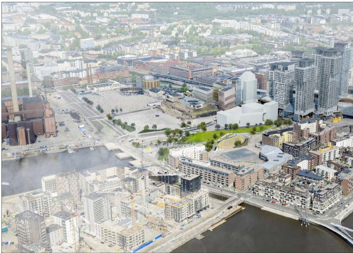
Havainnekuva Suvilahden tapahtuma-alueesta Event Hubin valmistumisen jälkeen.

"Tulevaisuuden Suvilahti on koti monipuolisille tapahtumille, ei vain suurille konserteille ja alueen kehitys tekee Helsingistä entistäkin eläväisemmän tapahtumakaupungin. Suvilahdessa voidaan jatkossa järjestää hyvin moninaisia tapahtumia kirpputoreista festareihin", kertoo Helsingin brändi