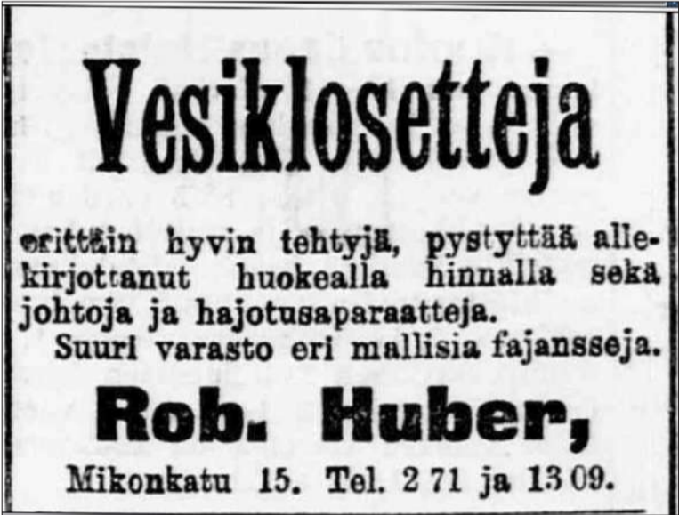
Vuonna 1902 valmistuneessa Semaforissa oli jo aikanaan uudenaikaisia mukavuuksia, kuten vesiklosetit ja kylpyammeet.

”Historiikki ei kerro vain talon vaiheista, vaan ulottuu laajemminkin käsittelemään Katajanokan historiaa ja värikkäitä vaiheita.