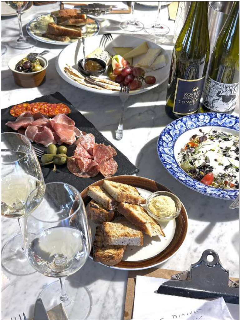
Miellyttävässä Bistro Brykissä voi asettautua muun muassa Chef's Tablen äärelle nauttimaan joukolla Välimeren innoittamasta ruoasta ja saksalaisesta Rieslingistä.

HELSINKI on mittakaavaltaan mitä mukavin kaupunki. Paikasta toiseen voi siirtyä apostolin kyydillä, ja esimerkiksi Bistro Brykiin, Arabiaan on keskustasta sangen antoisa viiden kilometrin kävelymatka. Paluumatkalla huvoneita voimia voi kompensoida raitiotievaunulla. Bistro Bryk asettuu Arabian vanhan tehtaan alakertaan. Savupiippu on kauas näkyvä maamerkki. Rakennuksen julkisivua koristavan keraamikko Michael Schilkinin antiikin tematiikkaan tukeutuvan reliefin alle levittäytyy iso terassi. Sisällä tunnelma on välitön ja nuorekas sekä ajoittain myös musikkosen soundien sävyttämä. Pyöreän Chef's Tablen, joka sijaitsee avokeittiön kupeessa, äärelle mahtuu useampikin vieras. Brykin menulta voi valita ruokia isoon, pieneen ja makean nälkään. Klassinen katkarapuleipä eli Toast Skagen liittoutuu Korrellin Rieslingin kanssa sujuvasti. Nautimme edustavasta Charcuterie-leikkelelautasesta, juustolajitelmasta sekä vaahdotetusta Fetasta, joiden kera mais-