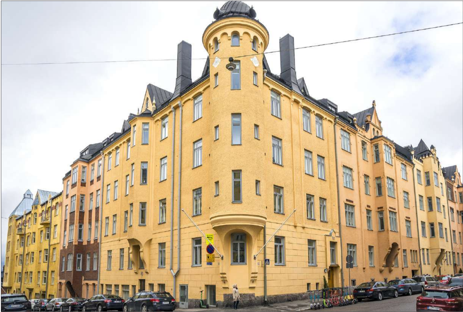
Semaforin rakennusten julkisivut koostuvat Luotsikadun puolella kolmesta ja Katajanokankadun puolella kahdesta erilaisesta lohokosta, joissa seinäpintojen käsittely ja koristeaiheet vaihtelevat. Aikoinaan ikkunoista avautui avarat näkymät merelle, ja kerrotaan, että parvekkeilta saattoi kuunnella Korkeasaaren leijonien karjuntaa.

KATAJANOKAN keskeisellä paikalla sijaitseva arvotalo ansaitsee edustavan katsauksen 120-vuotiseen historiaansa. Heinämies selvittää talohistoriikissa Bostads Ab Semaforin kahden rakennuksen vaiheet aina yhtiön perustamisesta, rakennusten toteuttamisesta sekä erilaisten perusrakennusten ja muutostöiden kautta tähän päivään. Taloyhtiön pitkän historian ohella kirja on oivallinen teos Katajanokan historiasta pitkällä aikavälillä ja siten paljon muutakin