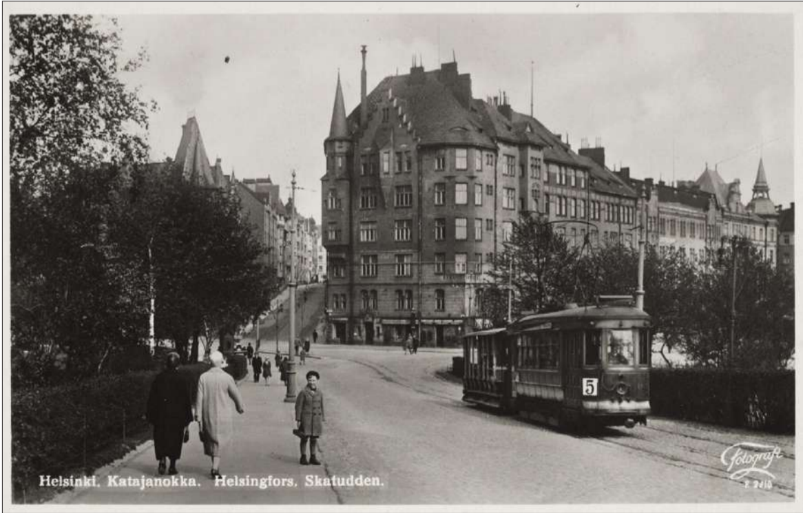
Luotsikadun länsiosaa jakoi Katajanokan puiston (nyk. Tove Janssonin puiston) kahtia, kunnes 1977 katu korvattiin puistokäytävällä ja raitoliikenne numero 5 kiskoineen siirrettiin Kanavakadulle.

kuin yksistään talohistoriikki. Katajanokan historiaa teos käsittelee tarkastelemalla Vironniemen kärjen muutosta Katajanokaksi ja julkisten rakennusten alueeksi. Alueella olleesta vaatimattomasta kalastajahötkkelikylästä tuli ajan mittaan arvostettu asuinalue, jolla sijaitsee niin arkkitehtonisia helmiä kuin ”moder-