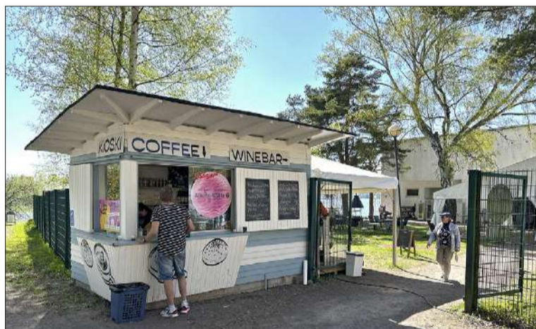
Porttikioskista saa kylmää ja kuumaa juotavaa sekä makeaa ja suolaista pikkusyötävää.

SOUTUSTADIONIN grillin tuoksujen ja musiikin säestämä kesäkuusi alkaa toden teolla torstaina 1.6., jolloin lavalle nousee iki-ihana iskelmälegenda Marion Rung , kun tähtilaulajan 50 vuotta Tom Tomista -kiertue starttaa Soutustadionilta. Vuonna 1962 Marion sijoittui Euroviisuissa laulullaan Tipi-tii hienosti seitsemänneksi, ja vuonna 1973 hänen esittämänsä Tom Tom Tom kiilasi jo kuudenneksi. Soutustadionilla kuu-