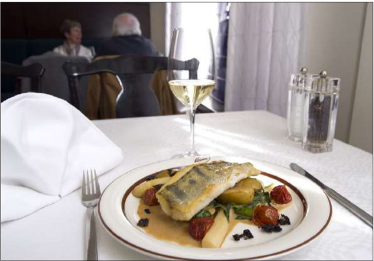
Klassikkoravintola Kosmoksessa Riesling-menulle valittiin ensin suositusviinit ja sitten niille hyvin istuvat ruoat. Ringsin viinitalon loistavalle Rieslingille kelpasi hyvin alkukesän raikkautta puhkunut paistettu siika sesongin kasvien ja hummerikastikkeen kera.

kivimaassa, joka yhdessä viileän ilmaston kanssa tarjoaa kasvuolosuhteet loistavalle suodattamattomalle ja vegaaniselle viinille. Viiniloilla on lähes poikkeuksetta pitkät perinteet. Ringsillä viiniviljelyn ja -tekemisen taitoa vaalitaan jo kuudennessa polvessa. Kosmoksessa valittiin ensi hyvät viinit ja sitten niille mietittiin sopivat ruoat. Pääruokana tarjottavalle peuralle suositellaan saksalaista Pinot Noiria eli Spätburgunderia. Maistelimme toisena pääruokana