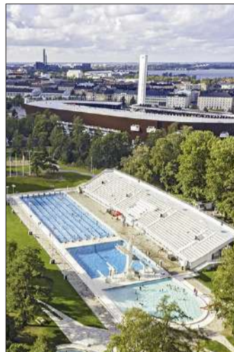
Stadikka on klassinen uimapaikka.