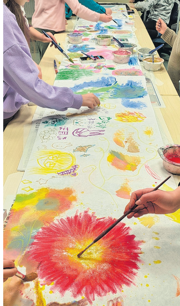
Näyttelystä löytyy myös yhteistyönä syntyneitä, suuria, vapaalla tekniikalla tehtyjä maalauksia, joissa on annettu luovuuden läikehtiiä.

vuoden aikana syntynyt monenlaisia taideteoksia: aurinkopallotyö keltaisen sävyineen, unelmien koti teos, omena-asetelma ja talvella tehtiin haus-