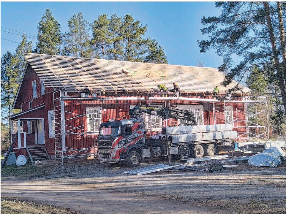
Leader rahoituksella mm. Menkijärven kylätalo sai uuden katon.

Leader-toiminta ei ole vain hankerahoitusta – se tuo alueelle yhteistä tekemistä, vah-