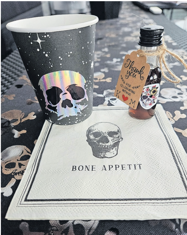
Kirjanjulkustilaisuuden kattausta oli yhtä persoonallinen kuin julkaistava kirjakin!

Kirjaa voi tiedustella sosiaalisen median kautta "Kari ja Mari, kallopari" -sivulta sekä sähköpostitse.