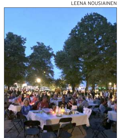
Liisanpuistikko on tapahtuman pääpaikka.

”Kaupunginosayhdistysten kannattaa lähteä kokeilemaan tapahtuman järjestämistä vaikka vaatimattomallakin panostuksella. Tarvitaan vain perusvarustus eli pöydät ja tuolit sekä itse tuodut ruuat ja ruokajuomat. Lopputulos on yhdistyksen ja asukkaiden oman aktiivisuuden tulosta. Hyvä ateria lyhtyjen ja kynttilöiden valossa on hieno kokemus.”