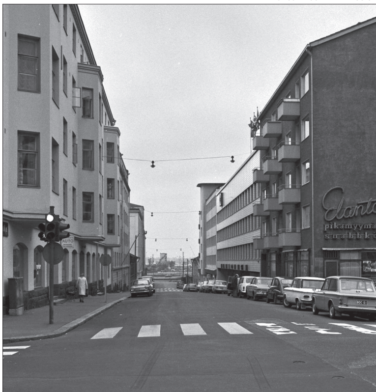
Näkymä Eerikinkadun ja Hietalahden risteykseen vuonna 1970, Eerikinkatu 48 etualalla vasemmalla.

”Laidasta laitaan, mutta sanoisin, että työelämässä hyvin pärjäävät nuoret aikuiset, 28-45-vuotiaat ovat yksi merkittävä kohderyhmä. Ullakolla on hiljaista ja siellä voi elää hyvin rauhassa kaupungin