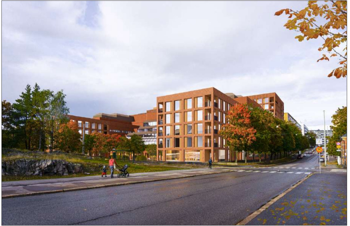
Kalliossa sijaitsevan Kuntatalon sivusiipien tilalle on suunniteltu uutta asuinrakentamista. Havainnekuvassa avautuu näkymä etelästä Wallininkadun suuntaisesti. Uudet asuintalon ovat etualalla.

”Kuntaliiton palkkaamana Trevian Asset Management toimii hankkeen vetäjänä ja eräänlaisen isännöitsijän roolissa hoitaen kiinteistöön liittyviä tehtäviä. Se arvioi tulevien vuokralaisten tarpeen ja sen, millaisilla sopimuksilla hoidetaan esimerkiksi pysäköinti ja muut kiinteistön käytännön asiat. Edelleen se ehdottaa, mikä osa tulevasta kiinteistöstä myydään tai vuokrataan ulkopuolisille toimijoille. Valmistelussa käytettävät suunnitelmat