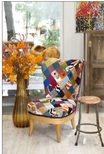
1940-luvun nojatuoli on vironnut hienosti kunnostajansa käsissä.