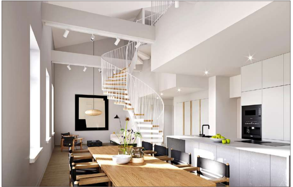
Kahteen tasoon asettuvan huoneiston toisessa kerroksessa on iso, punavuorelaismaiseman sävyttämä kattoterassi porealtaineen.