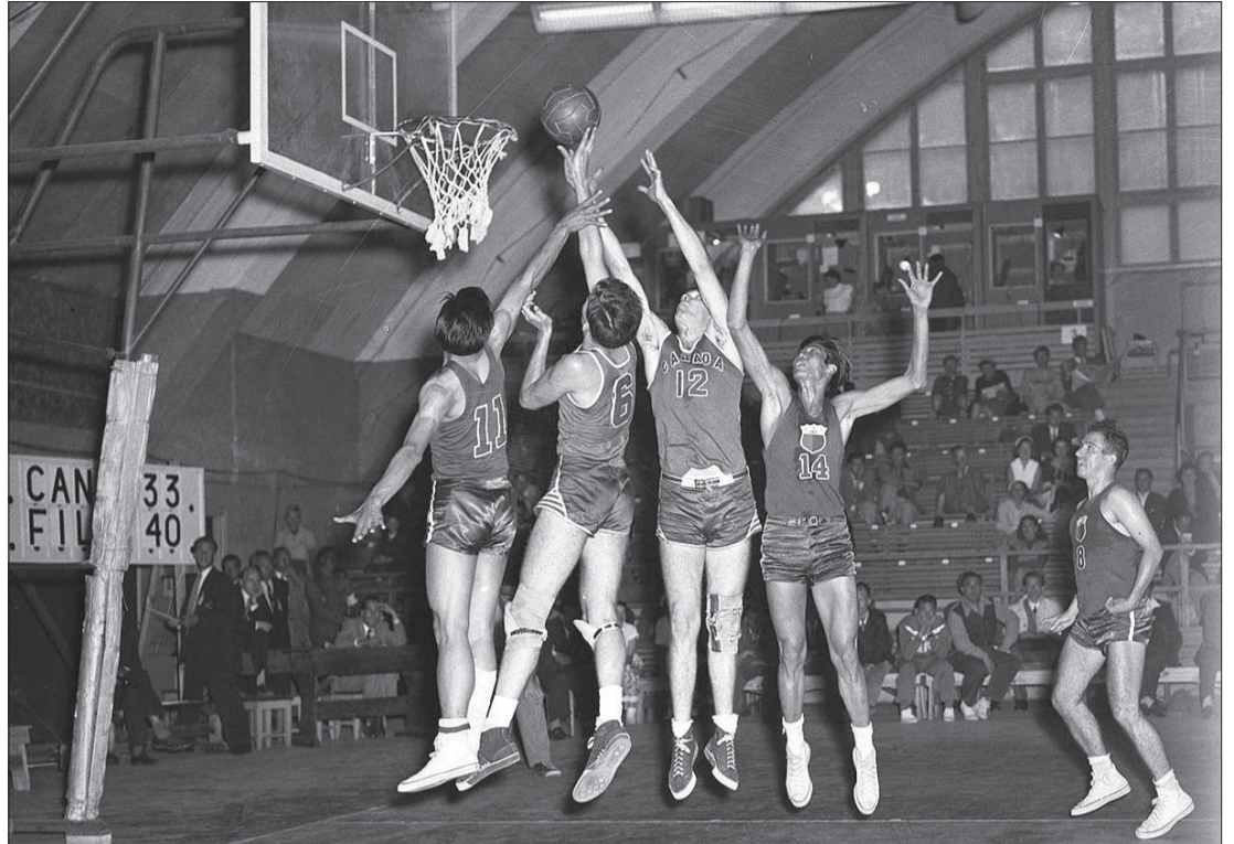
Olympialaisten koripallo-ottelu Kanada-Filippiinit pelattiin vuonna 1952 Tennispalatsissa.