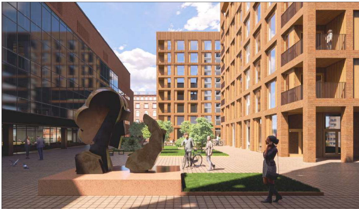
Näkymä korttelin pohjoispuolelle muodostuvasta piha-aukiosta.

”Erityisesti asukkaita harmittaa uudisrakennusten Toisen linjan puoleisen kerrostalon korkeus verrattuna Kuntatalon toimistosii-ven korkeuteen, sekä ylipäättään Toisen linjan puolelle suunniteltu 8-kerroksinen uusi asuinrakennus, joka massiivisuudellaan sulkisi korttelin umpeen. Suojeltavaksi luokiteltu Kuntatalon osa