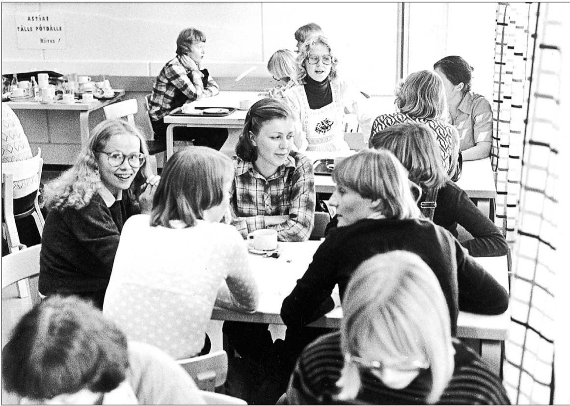
Helsingin yliopiston opettajankoulutuslaitoksen opiskelijoita lounaalla.

lä kuohui, kun ketju luopui kokonaan naudanlihan käytöstä. Viime vuonna ketju laski kaikkien aterioidensa hiilijalanjäljen raaka-ainekohtaisesti ja avasi ensimmäisen kokonaan vegaanisen ravintolansa. UniCafe tavoittelee hiilineutraaliutta vuoden 2025