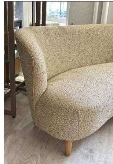
Askon Elisabet-simpukkasohvan kruunaa Raf Simonsin suunnittelema kangas.

kuten isoäidin nojatuoli, jolla on tunnearvoa, kunnostettuna ja uudelleen omalla suosikkikankaalla verhoiltuna suorastaan kutsuu vastustamattomaan syleilyynsä. Kierrätys, joka allekirjoittaneelle oli vielä 10 vuotta sitten aika vieras asia, on nyt osa jokapäiväistä elämää. Tutkin pakkauksien kierrätysohjeita. Biojätteestä syntyy Bokaski-kompostorissa ravinnerikasta multaa, josta kasvit kiittävät. Huonekalut ovat paitsi mukavia ja kauniita myös arvonsa säilyttäviä designklassikoita, joiden korjaaminenkin kannattaa aina. Kodin omaisuusluetteloon kirjattu Aalto-jakkara menee oikein hinnoiteltuna mennessä tullen kaupaksi, jos elämäntilanne sen myyntiä edellyttää. Kiertotaloutta sekin. Rikkinäiset tavarat eivät ainakaan kohota tunnelmaa.