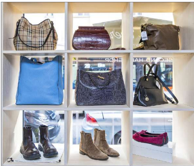
Asusteet kiinnostavat käytettyinäkin.

uusien sukupolvien myötä. Tyyppillinen asiakkaani on laatua ja vaivattomuutta arvostava nainen, jolla ei ole aikaa käydä läpi kirpputorien loputtomia rekkirivejä. Olenkin lajitellut kaikki tuotteet koon ja tuoteryhmän mukaan. Laukut liikkuvat aina hyvin, kos-