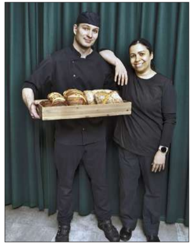
Nykyään UniCafen 18 ravintolaa palvelevat kaikilla Helsingin yliopiston kampuksilla.

HOTELLI- ja ravintolamuseossa UniCafen juhluvuotta vietetään syksyn aikana näkyvästi. Museossa on 30.11.2023 asti esillä pienoishäilytely, jonka äärellä voi