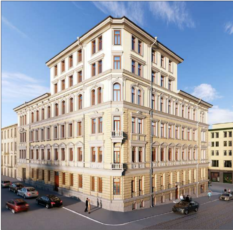
Uusrenessanssitalo Ratakadun ja Yrjönkadun kulmassa valmistui 1800-luvun lopulla.