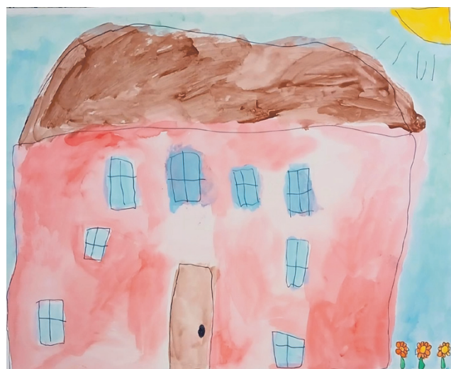
Kuvataidekoulu Eeron avoimissa ovissa on esillä oppilaiden tekemiä Unelmien talo -töitä ja pienoismalli Alajärven kirkosta.

Esillä on oppilaiden tekemiä Unelmien talo -töitä ja pienoismalli Alajärven kirkosta. Lisäksi on tarjolla tekemisen lomassa. Kuvataidekoulu Eerossa opetusta saavat lapset ja nuoret 5-vuotiaista valmentavista aina 18-vuotiaaksi asti. Kuvataide-