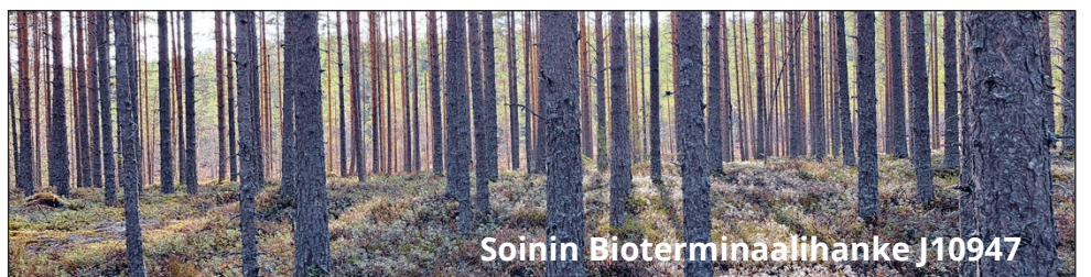
Soinin Bioterminalihankkeen infotilaisuus