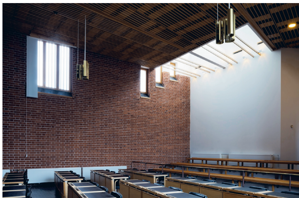
Alajärven kaupungintalo (1966-69) on yksi Alvar Aalto -viikon kohteista.

Alajärvellä on ainutlaatuinen mahdollisuus tutustua arkki-