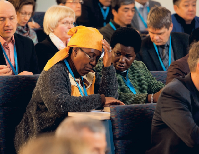
Suomen evankelis-luterilainen kirkko on järjestänyt Lähetyskumppanuus-neuvottelut kerran aikaisemmin, vuonna 2014.

Suomen evankelis-luterilai-sen kirkon vuoden 2024 mer-kittävin kansainvälinen tapah-tuma, Lähetyskumppanuus-neuvottelut, järjestetään Hel-singissä 26.7.30. elokuuta 2024 Kulttuurikeskus Sofissa. Lähetyskumppanuusneu-votteluihin on tulossa kirkon kahdeksan lähetysjärjestön sekä Kirkon Ulkomaanavun yhteistyökumppanien edus-tajia eri puolilta maailmaa. Kaukaisimmat osallistu-jat tulevat muun muassa Ja-panista, Taiwanista, Ango-lasta Kambodzasta ja Kolum-biasta. Monet vieraista ovat maista, joissa kirkko elää kes-kellä sotatannerta, ja arkea lei-maa muun muassa pakolais-uus. Lähetyskumppanuusneu-votteluissa on mahdollista kuulla, mitä noin neljällekym-menelle yhteistyökirkolle tai-järjestölle kuuluu ja jakaa ko-kemuksiaan lähetystyössä tä-män ajan lähetystyöstä ja käy-tössä olevista välineistä. Tapaa-