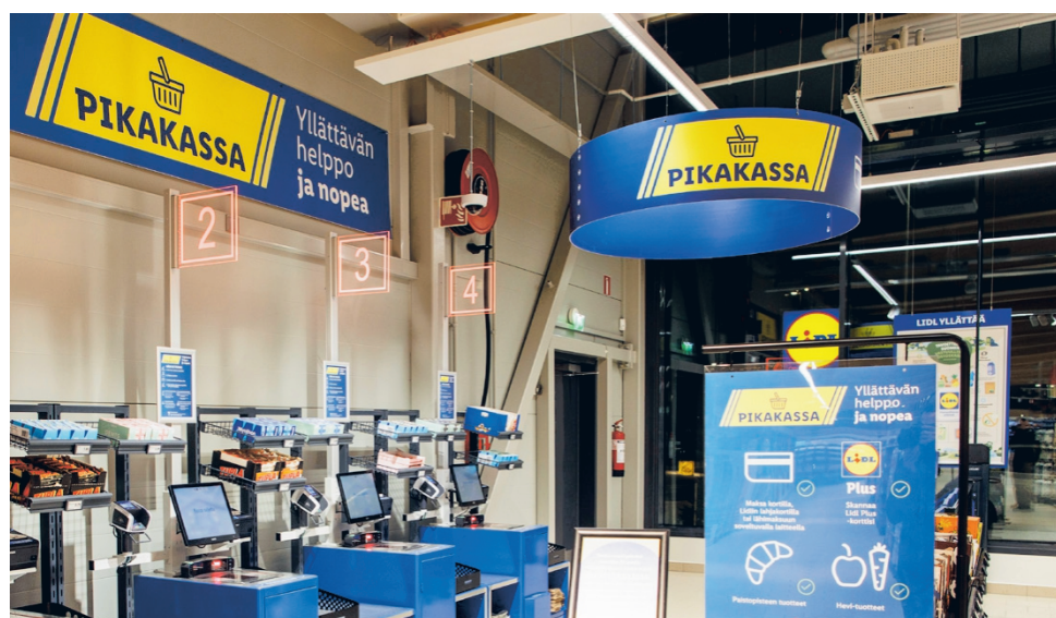
Seuraavan puolen vuoden aikana Lidl asentaa pikakassat lähes kaikkiin myymälöihinsä Suomessa. Alajärven myymälään pikakassa tulee alkuvuodesta 2025.

Henkilökunnalla on keskeinen rooli asiakaspalvelun ja sujuvan myymäläarjen mahdollistamisessa. Pikakassat eivät vähennä työntekijöiden tarvetta myymälässä ja Lidl tarjoaa jatkossakin asiakkaille mahdollisuuden henkilökoh- passikäynnistä entistä sujuvamman. Hedelmät ja vihanekset on helppo punnita itse – tuotteet voi valita kuvallisesta