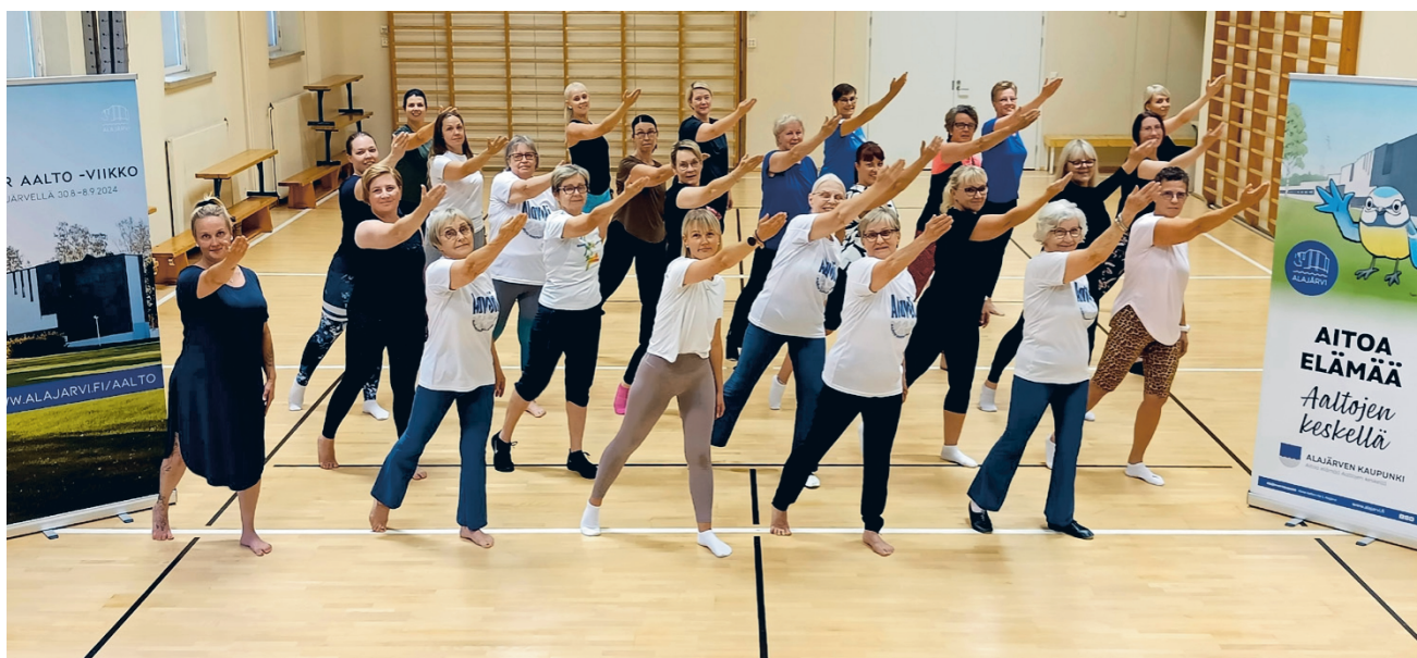
Aaltoliikkeessä -tanssiteosta harjoitellaan kolmenkymmenen Alavolin tanssinharrastajan voimin.