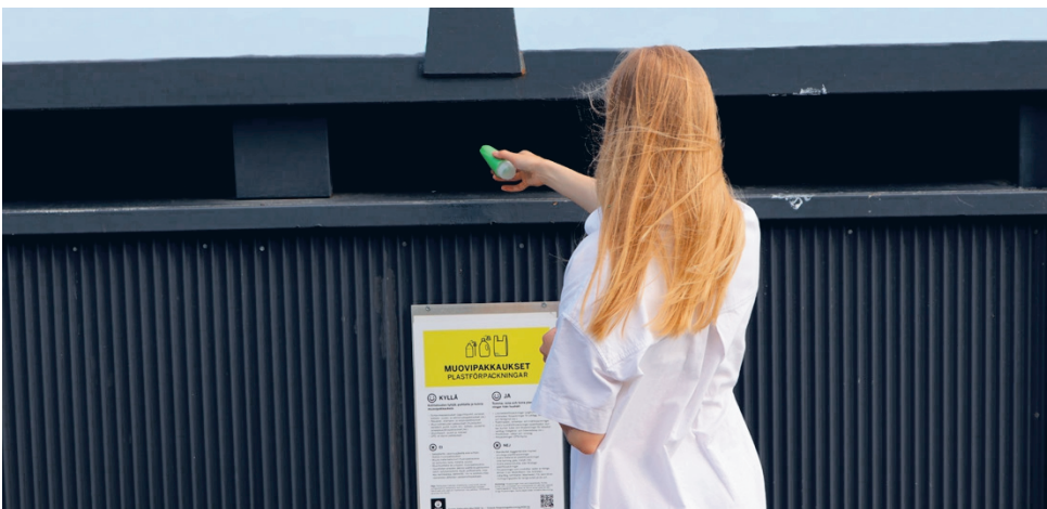
Muovin lajittelusta ei kannata pitää kesälomaa.

2. Muista lajitella muovipakaukset. Puhdistukseksi riittää pakkauksen huolellinen tyh-