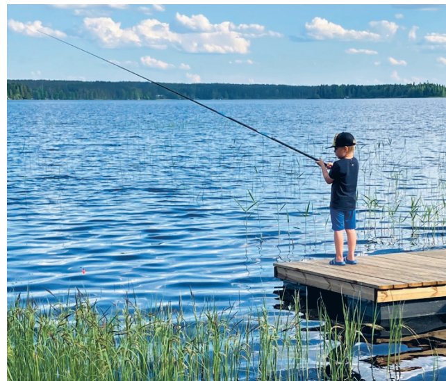
Yhteinen Ähtärinjärvi ry järjestää "Puhtaan veden puolesta"-tapahtuman lauantaina 29.6. kello 12-18.

daan esille, miten maanomistajat, ranta-asukkaat, mökkiläi-