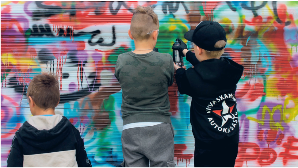
Lukkarinpuiston lipputankoihin pingotetun muovin edessä kävi melkoinen kuhina graffitityöpajan aikaan.

Katutaidetta alueelle Graffitityöpaja järjestettiin