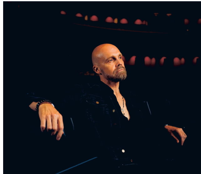
Tänä kesänä festilavalla nähdään juhluvuotta viettävä Juha Tapio.

mana Fagerkullafest mahtuu Juha Tapion tiiviiseen keikkakalenteriin. Kevään aikana artistin Elämänviivat-kiertue on toteutettu konserttisaleissa eri puolella Suomea mies ja kitara -konseptilla.