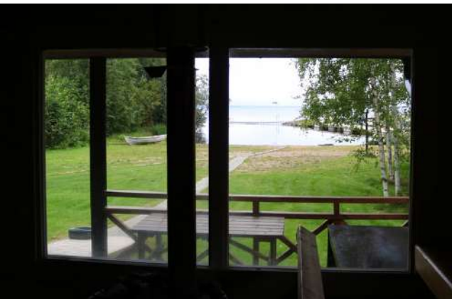
Koivulehdossa saunojalla on hyllyt näköalat suoraan Lappajärvelle.

Nämä tehtävät hoidetaan vakipaikoilla olevien toimista, joita on tänä kesänä ollut 22 vaunukuntaa.