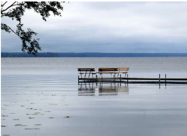
Tänä kesänä Lappajärven laineille laitettiin uusi laiturirakennus istumapaikkoineen. Tällä laiturilla voi istua ja miettiä syntyä syviä.