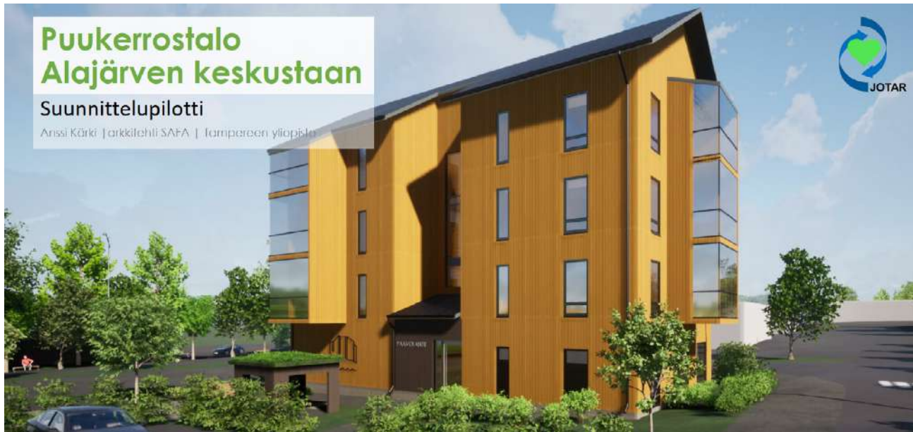
Havainnekuva Alajärvelle rakentuvasta puukerrostalosta.

vähähiilisen puurakentamisen edistäminen suunnitelmalla yksi puukerrostalo Alajärven keskustaan. Hankkeen käynnistyessä todettiin kuitenkin, että Alajärven keskustan rakentamaton tonttipari Hotelli-Ravintola Alvariinin takana sopisi kokonaisuudessaan puukerrostalarakentamiseen.