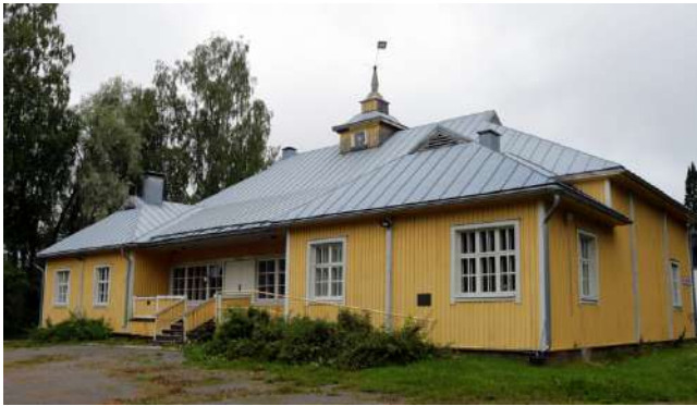
1919 rakennettu Alajärven Kirkonkylän Nuorisoseuran talo on mainiossa kunnossa juhlien, kokousten tai vaikka koulutuksien järjestämiseen. Talo kaipaa muutoinkin kaikenlaista toimintaa, mutta innokkaita toimijoita ei tunnu löytyvän.

teen. Nämä kaksi naista huolehtivat siitä, että laskut tulevat maksuun. Laskujen maksumen varat on saatu viimeiset kaksi vuotta kaupungin hallinnoimasta Pentti Moisio-rahastosta. Niillä rahoilla maksetaan välttämättömät kulut, ei muuta.